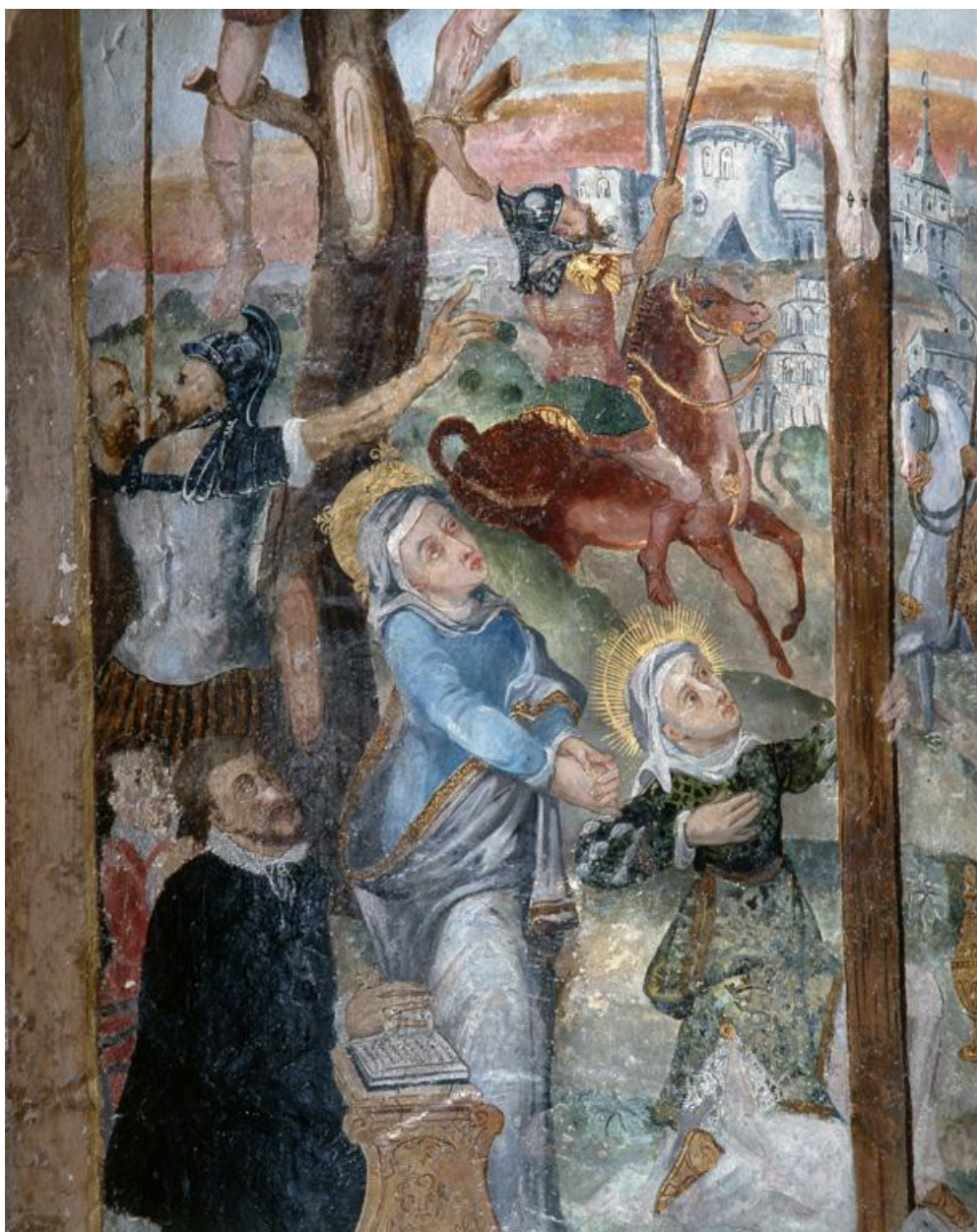
Détail de la partie latérale gauche : Vierge avec sainte Marie-Madeleine, 2 donateurs en prière (dont Jacques de Coucy ?), et les cavaliers romains à l'arrière-plan.