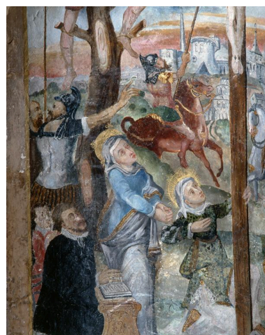
Détail de la partie latérale gauche : Vierge avec sainte Marie-Madeleine, 2 donateurs en prière