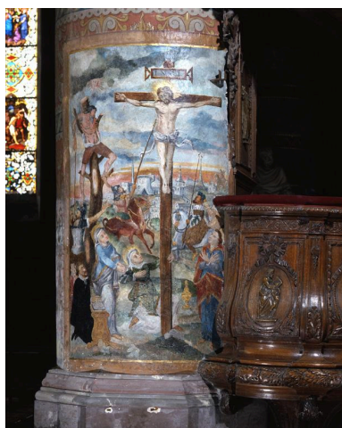
Vue d'ensemble de l'oeuvre.