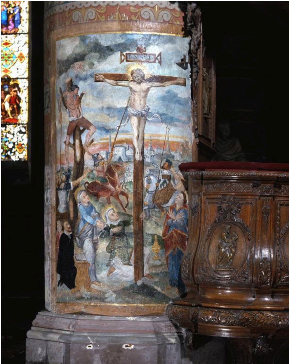
Vue d'ensemble de l'oeuvre.