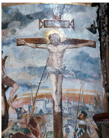
Détail du Christ en croix, des cavaliers perçant son flanc, et la ville de Jérusalem à l'arrière-plan.