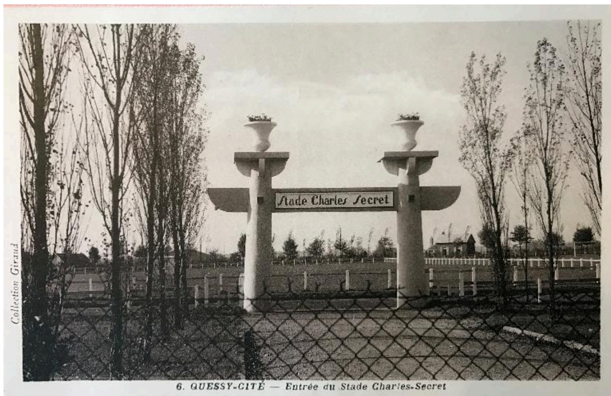
Entrée de l'ancien stade Charles Secret, carte postale, vers 1930 (coll. part.).