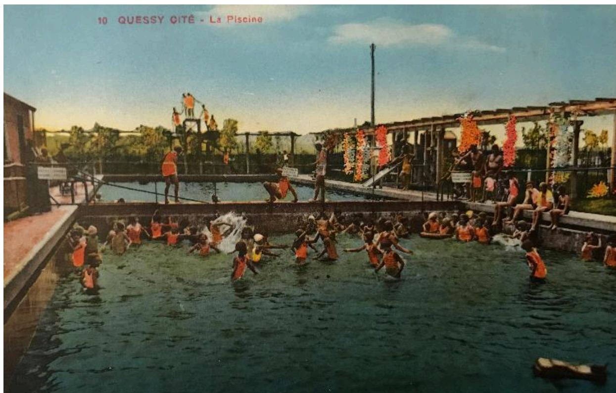
Quessy-cité, la piscine, carte postale, vers 1930.