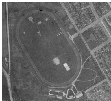
Le stade. Vue aérienne, 1931 (IGN ; C94PHQ4451_1931_NP3_HR50_0006). IVR32_20220205083NUCA