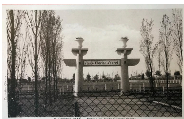
Entrée de l'ancien stade Charles Secret, carte postale, vers 1930 (coll. part.). IVR32_20170205066NUCA