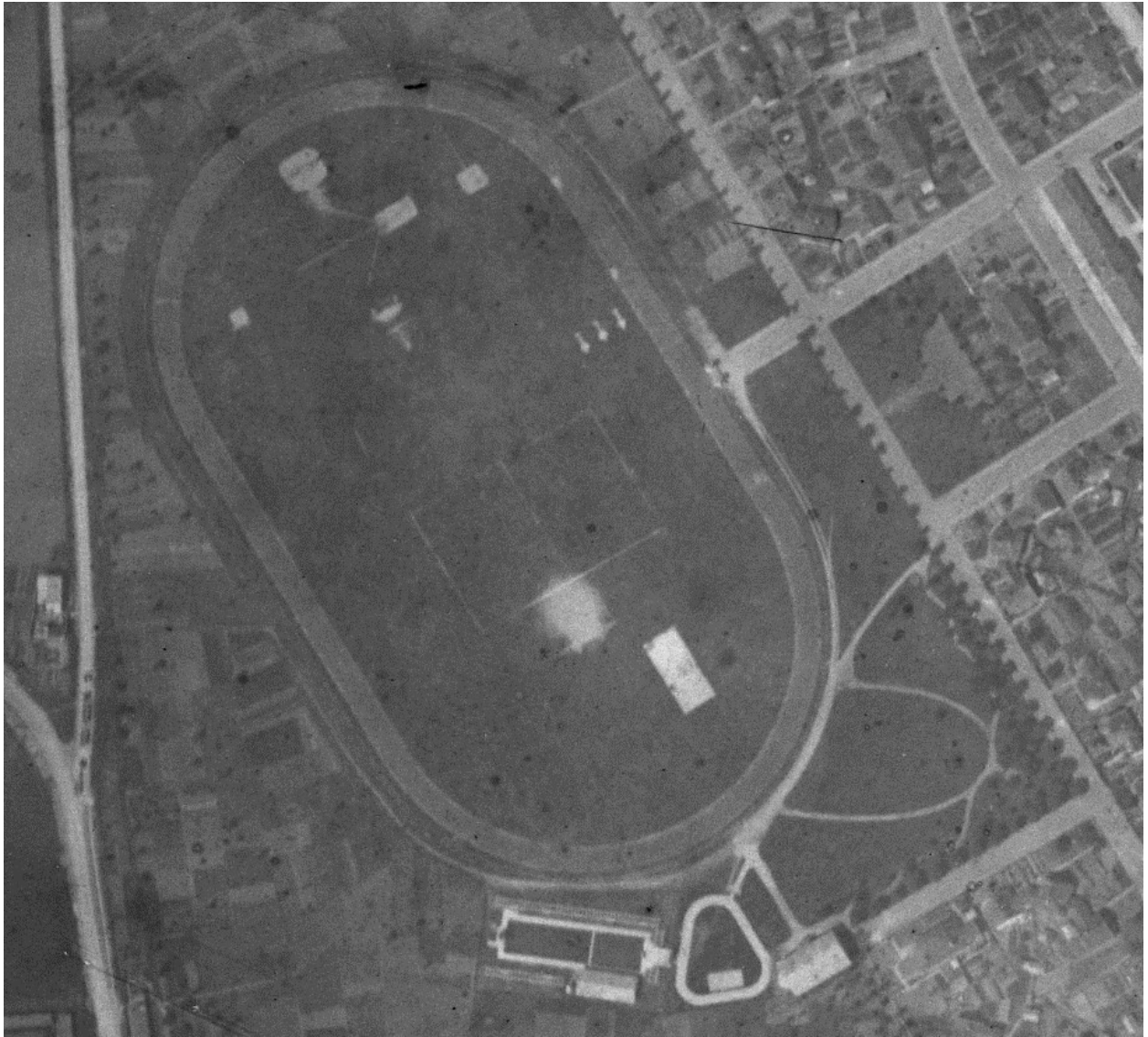
Le stade. Vue aérienne, 1931 (IGN ; C94PHQ4451_1931_NP3_HR50_0006).