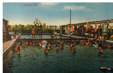
Quessy-cité, la piscine, carte postale, vers 1930 (coll. part.). IVR32_20170205067NUCA