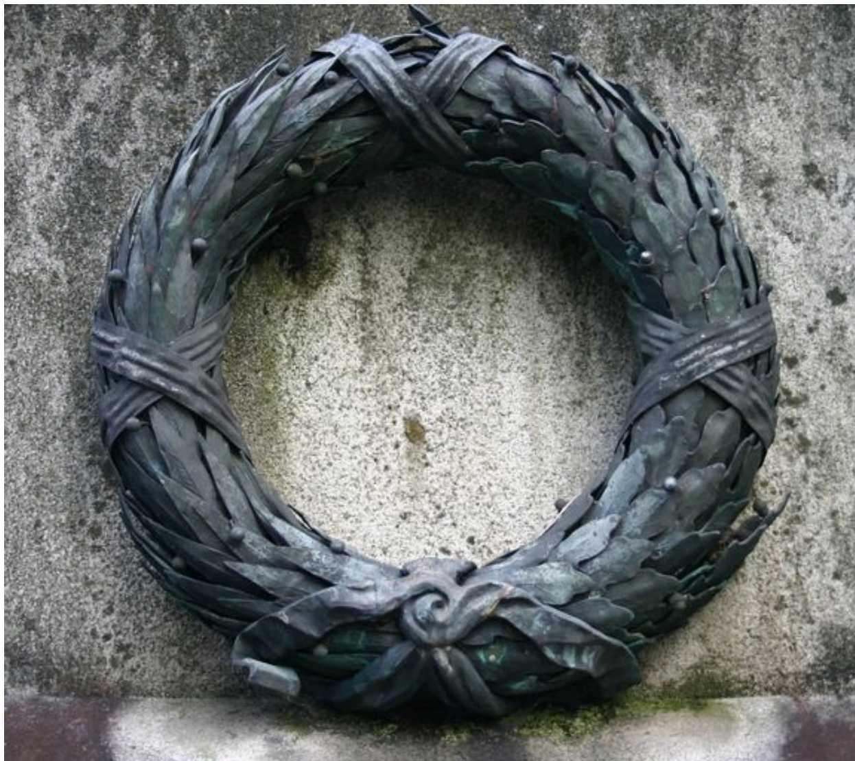
Vue de détail sur la couronne mortuaire.