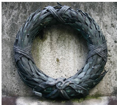
Vue de détail sur la couronne mortuaire.