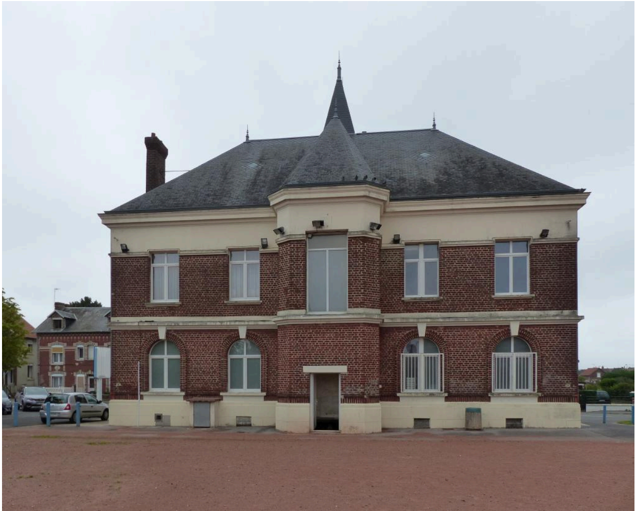
Vue de la façade arrière (ouest).