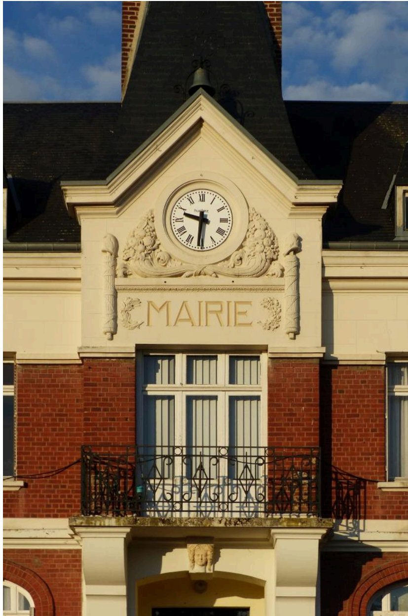
Vue de détail sur la travée centrale.