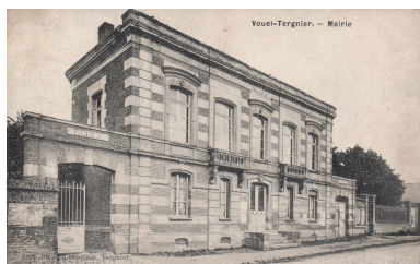
Vouel. La mairie et les écoles primaires. Carte postale, début 20e siècle (coll. part.).

Phot. Isabelle Barbedor IVR32_20210205182NUCA