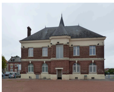
Vue de la façade arrière (ouest).

Phot. Isabelle Barbedor IVR32_20210205089NUCA