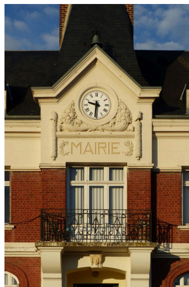
Vue de détail sur la travée centrale.

Phot. Isabelle Barbedor IVR32_20210205088NUCA