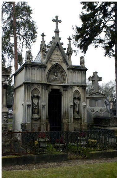
Vue générale. IVR22_20058000377NUCA