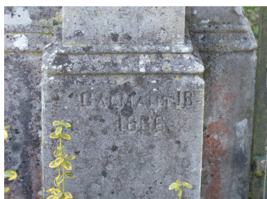
Vue de détail sur la signature de l'entrepreneur. IVR32_20168006443NUCA