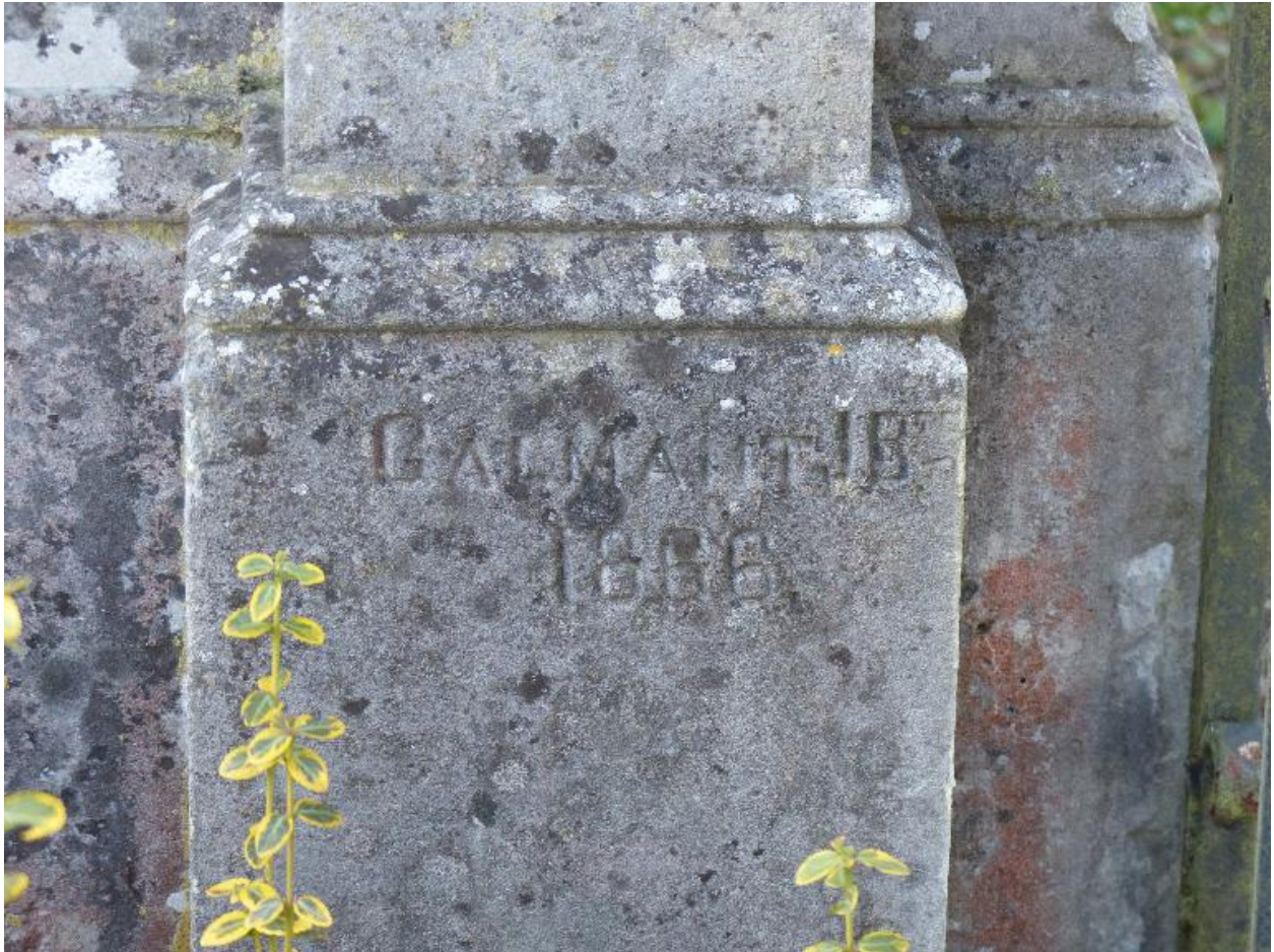
Vue de détail sur la signature de l'entrepreneur.