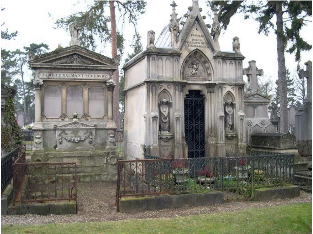
Vue de situation, tombeau à droite de l'image.