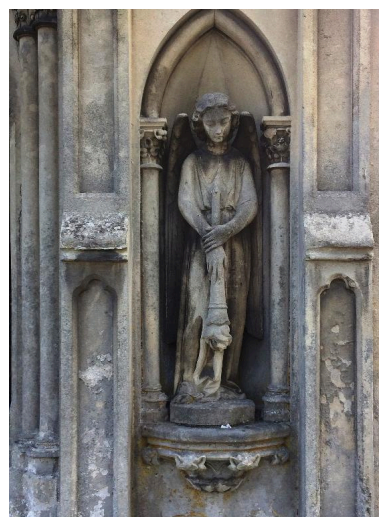
Vue de la statue d'ange (niche droite).