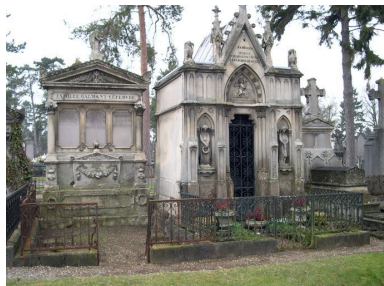
Vue de situation, tombeau à droite de l'image. IVR22_20058010039NUCA