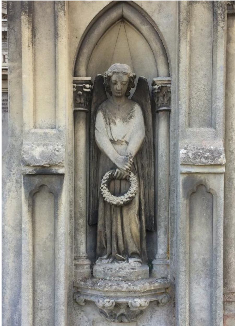
Vue de la statue d'ange (niche de gauche).