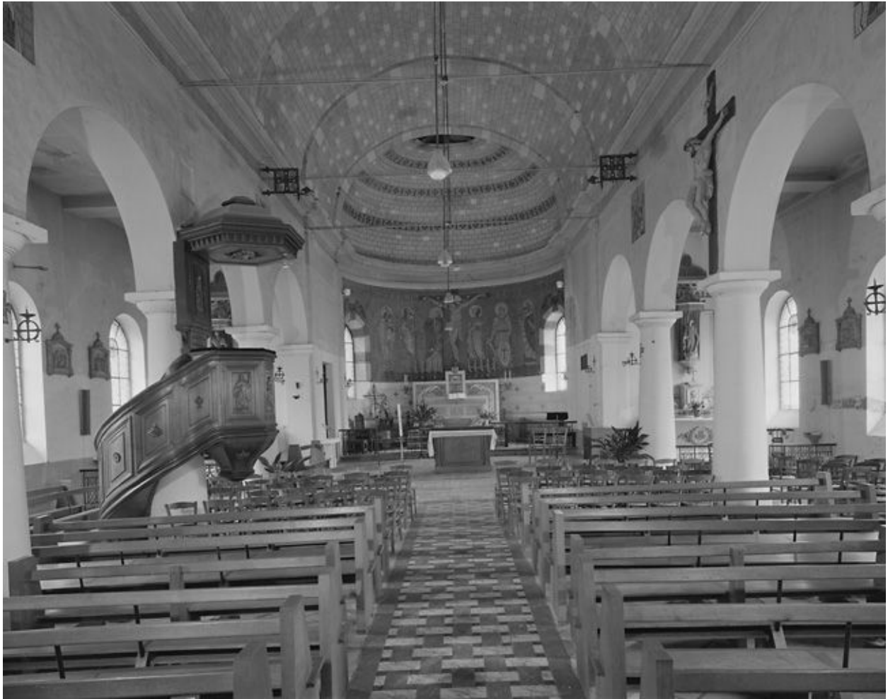
Vue intérieure vers le chœur.