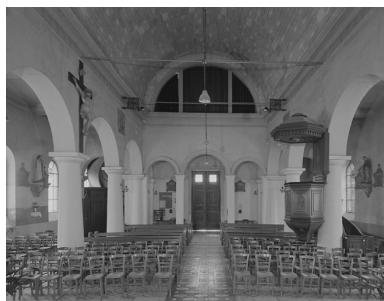
Vue intérieure vers l'est.