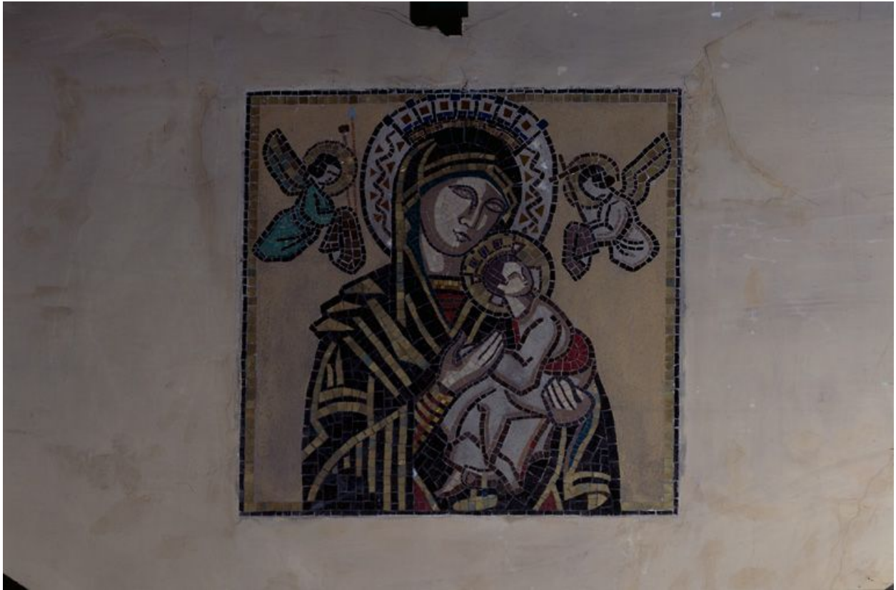
Décor d'un médaillon en mosaïque de P. Ansart, placé sur les voussures des arcades.