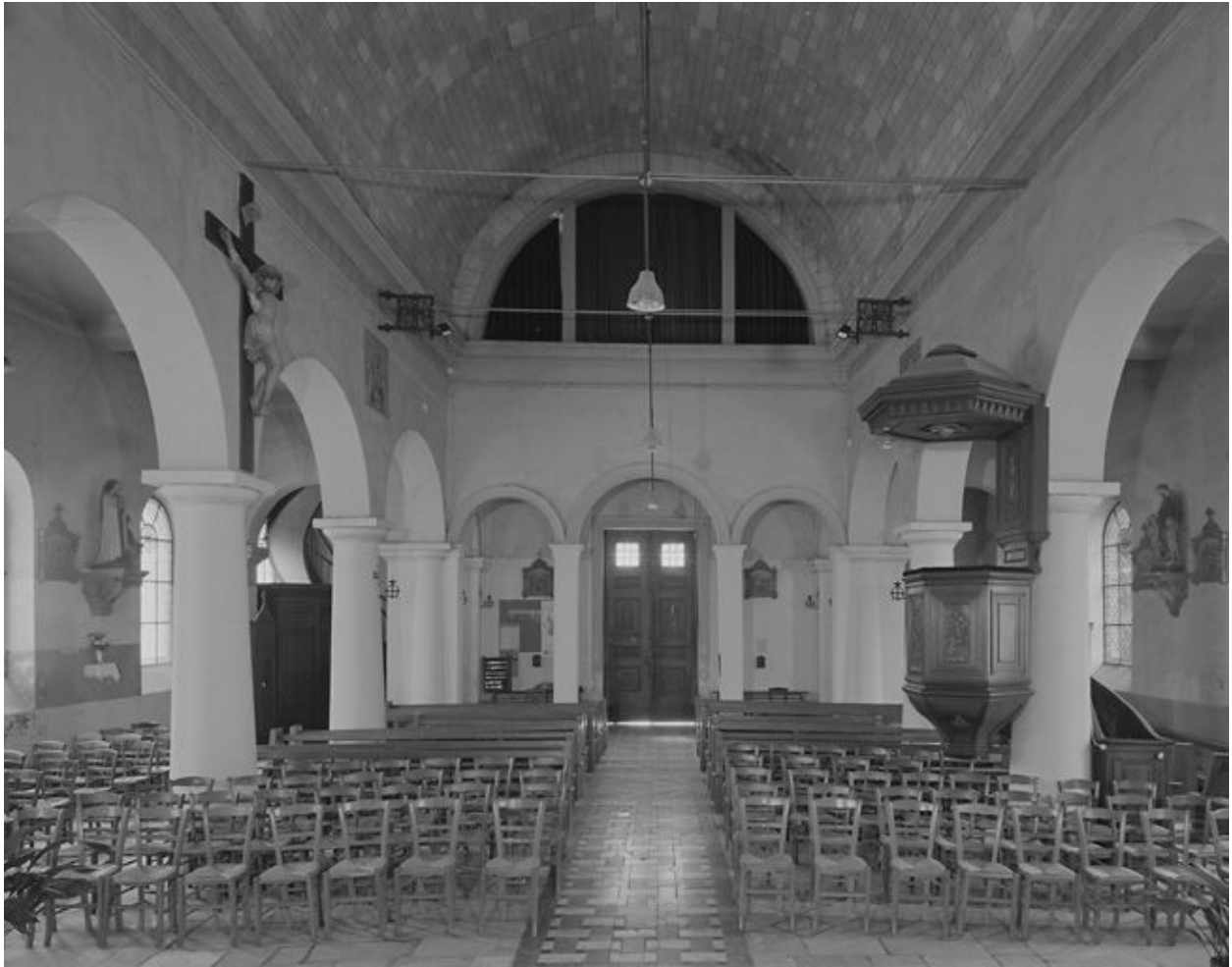
Vue intérieure vers l'est.