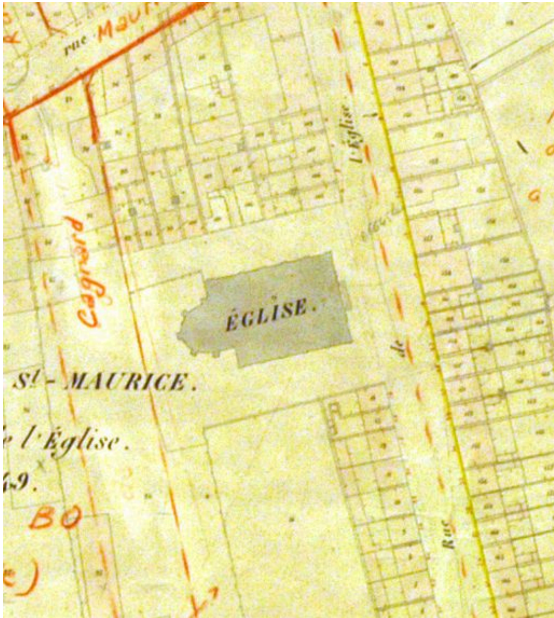
Extrait du cadastre de 1852 (DGI).