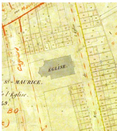
Extrait du cadastre de 1852 (DGI). IVR22_20038010438NUCA