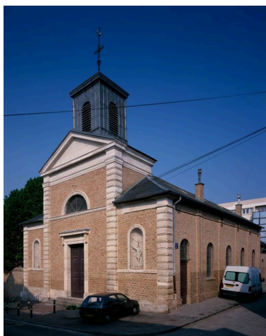
Vue générale. IVR22_20038000387VA