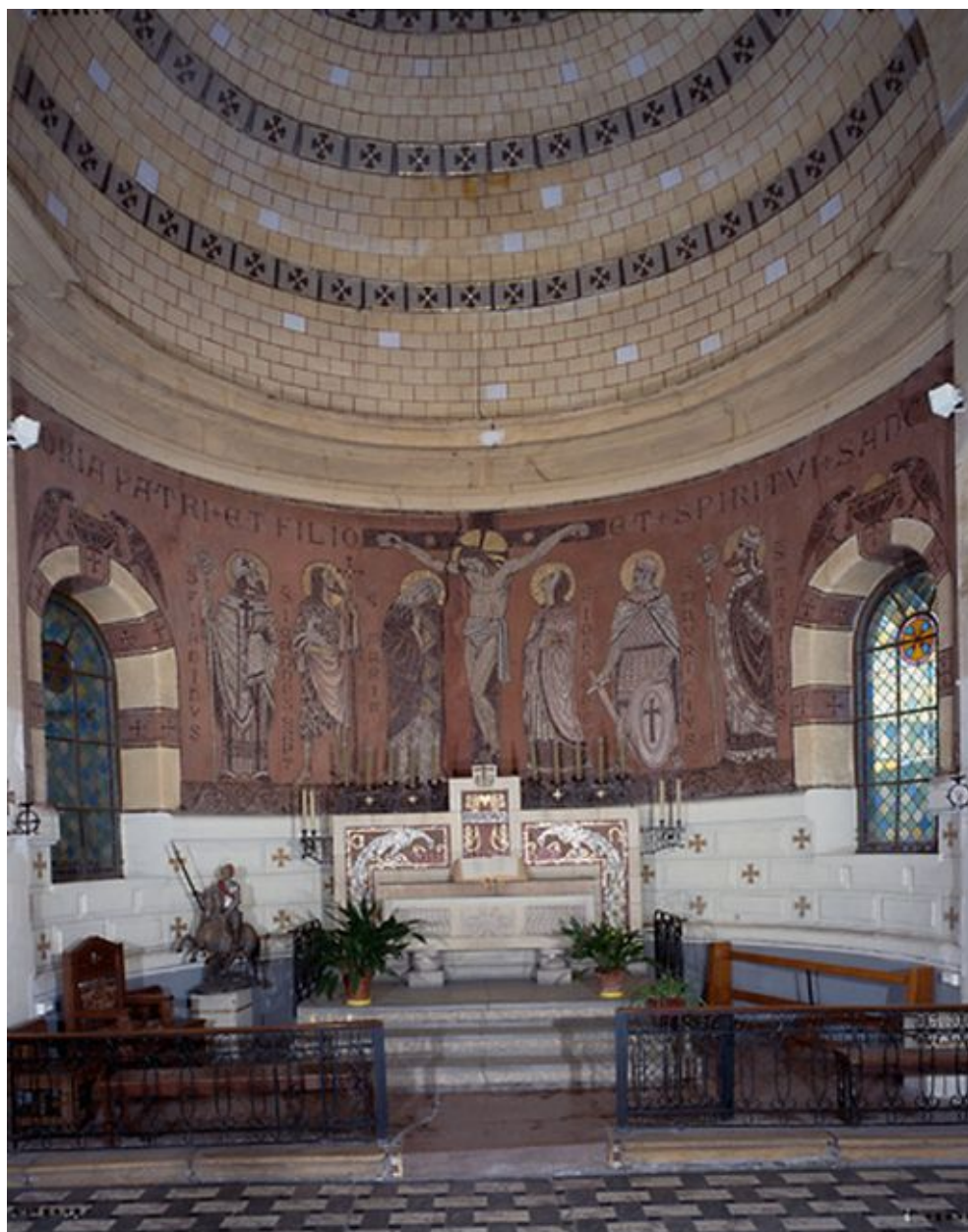
Décor de mosaïque du choeur de P. Ansart.