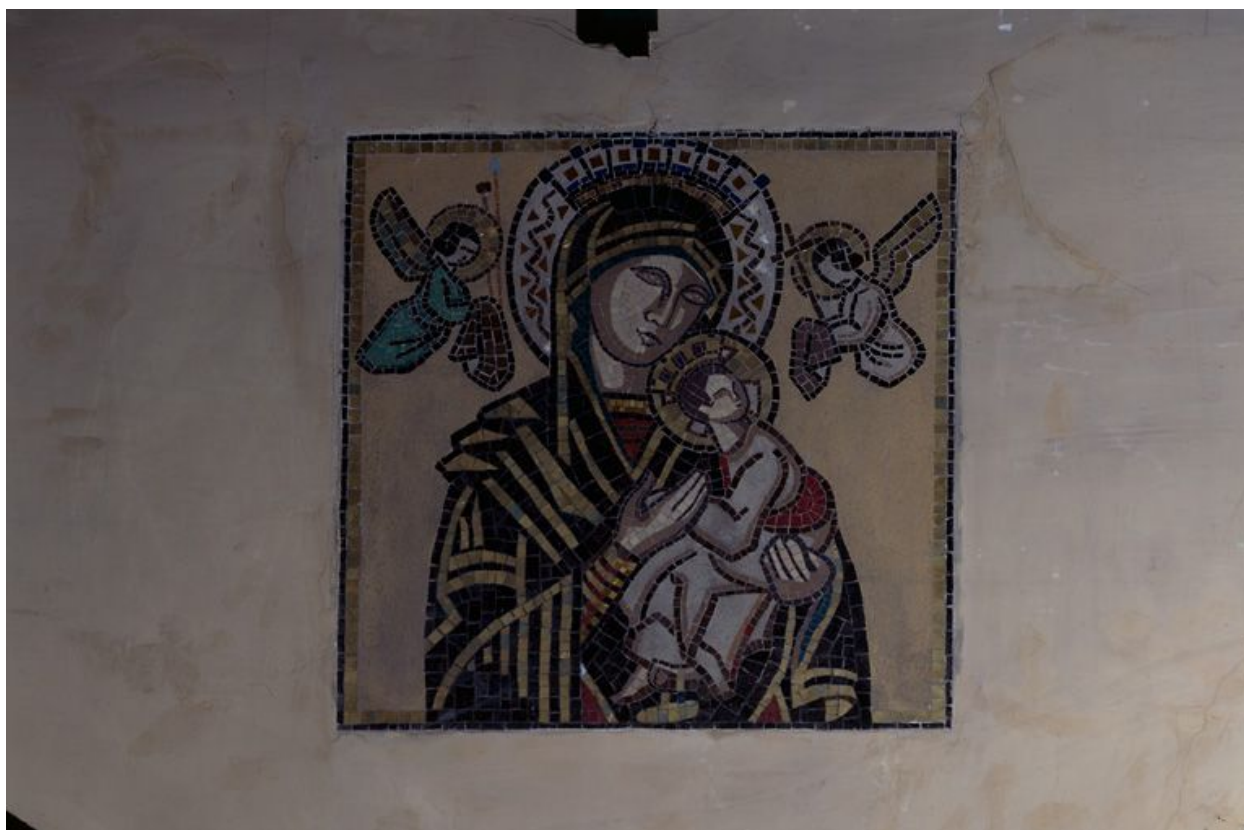
Décor d'un médaillon en mosaïque de P. Ansart, placé sur les voussures des arcades.