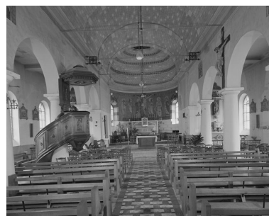
Vue intérieure vers le chœur. IVR22_19968000261V