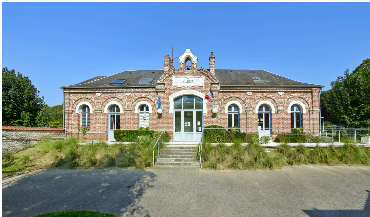
Vue de la façade sud.