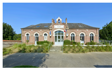
Vue de la façade sud.