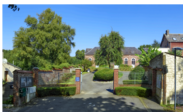
Vue de la mairie depuis la rue.