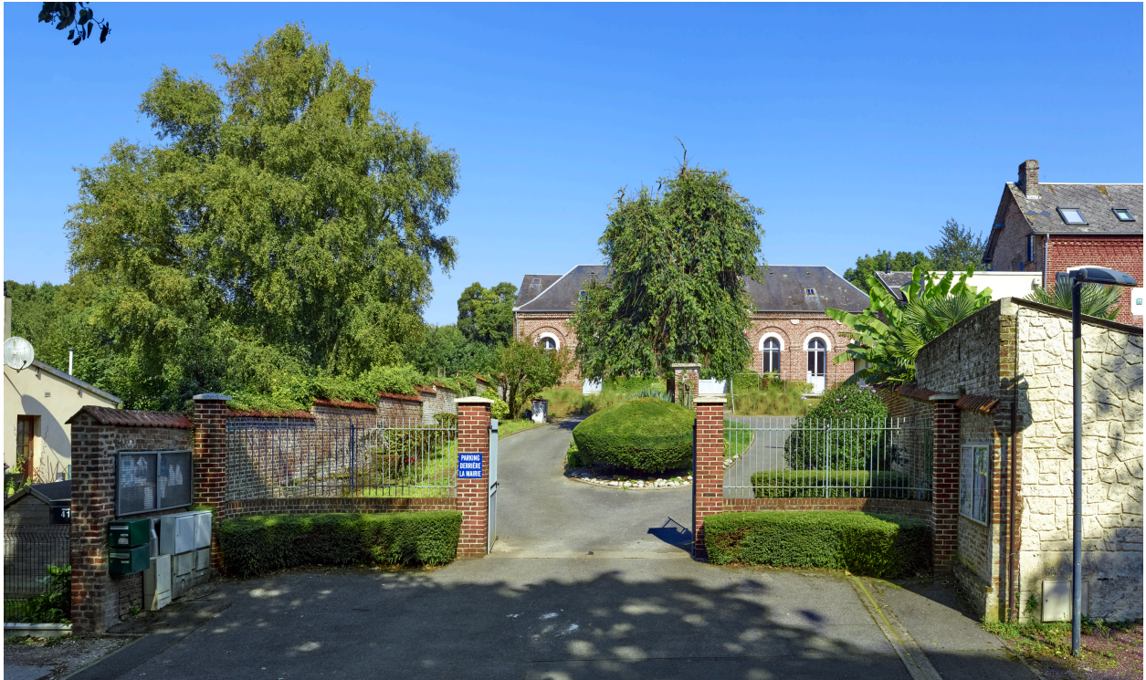
Vue de la mairie depuis la rue.