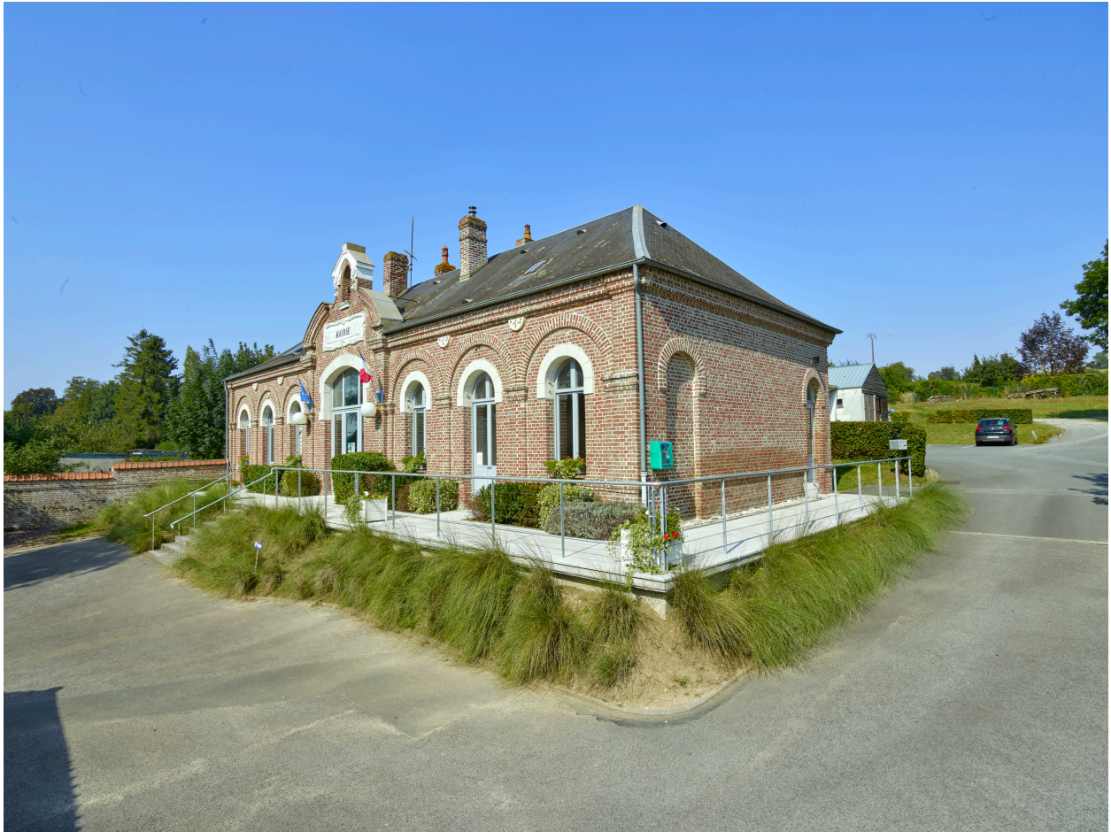
Vue d'ensemble, depuis le sud-est.