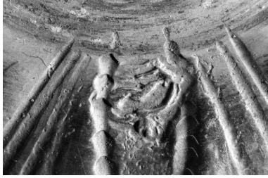
Poinçon de décharge.