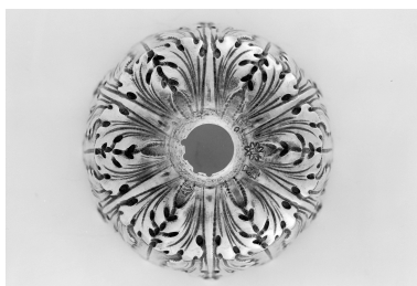
Coupe, vue de dessous, poinçons. IVR31_19876201060X