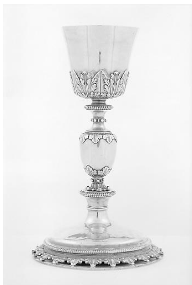
Vue générale. IVR31_19876201097X