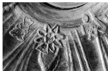
Poinçon de maître, poinçon de charge, détail. IVR31_19876201177Z