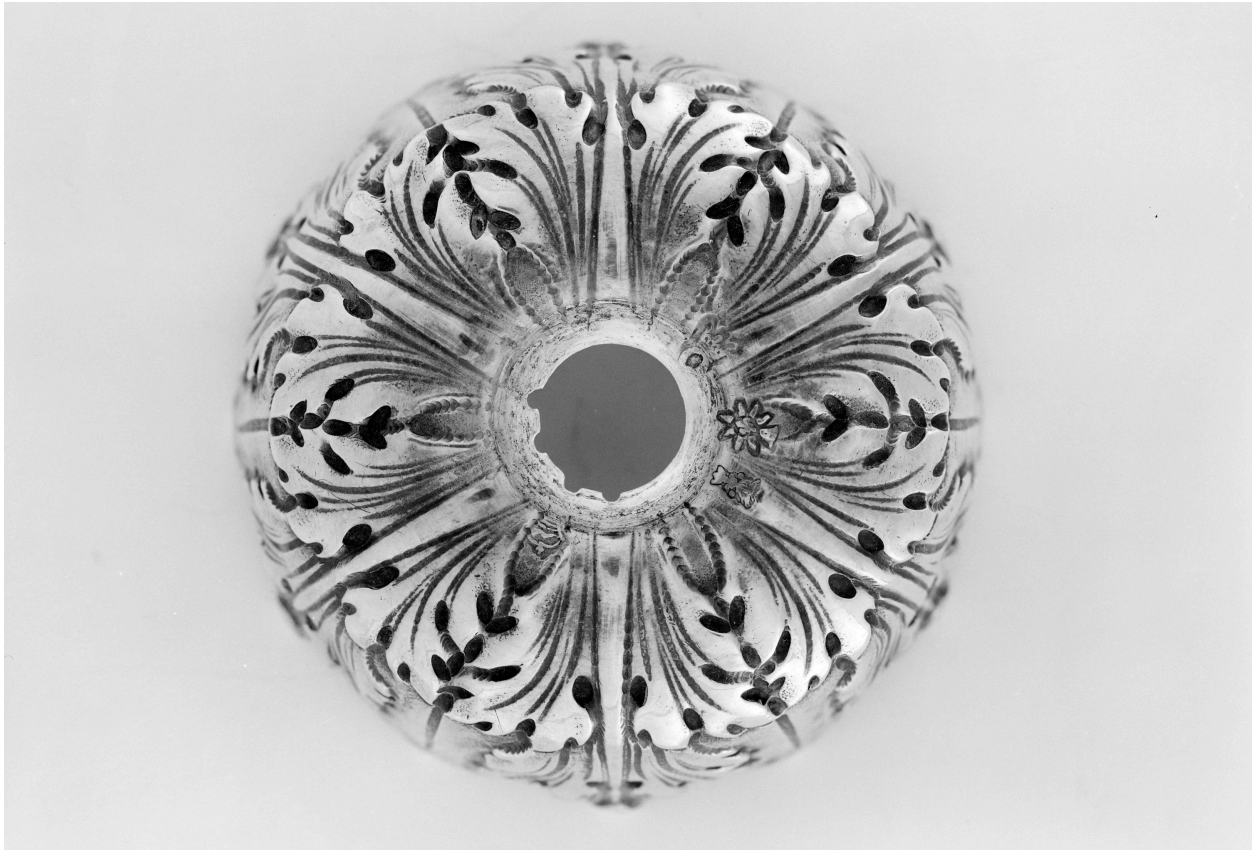
Coupe, vue de dessous, poinçons.