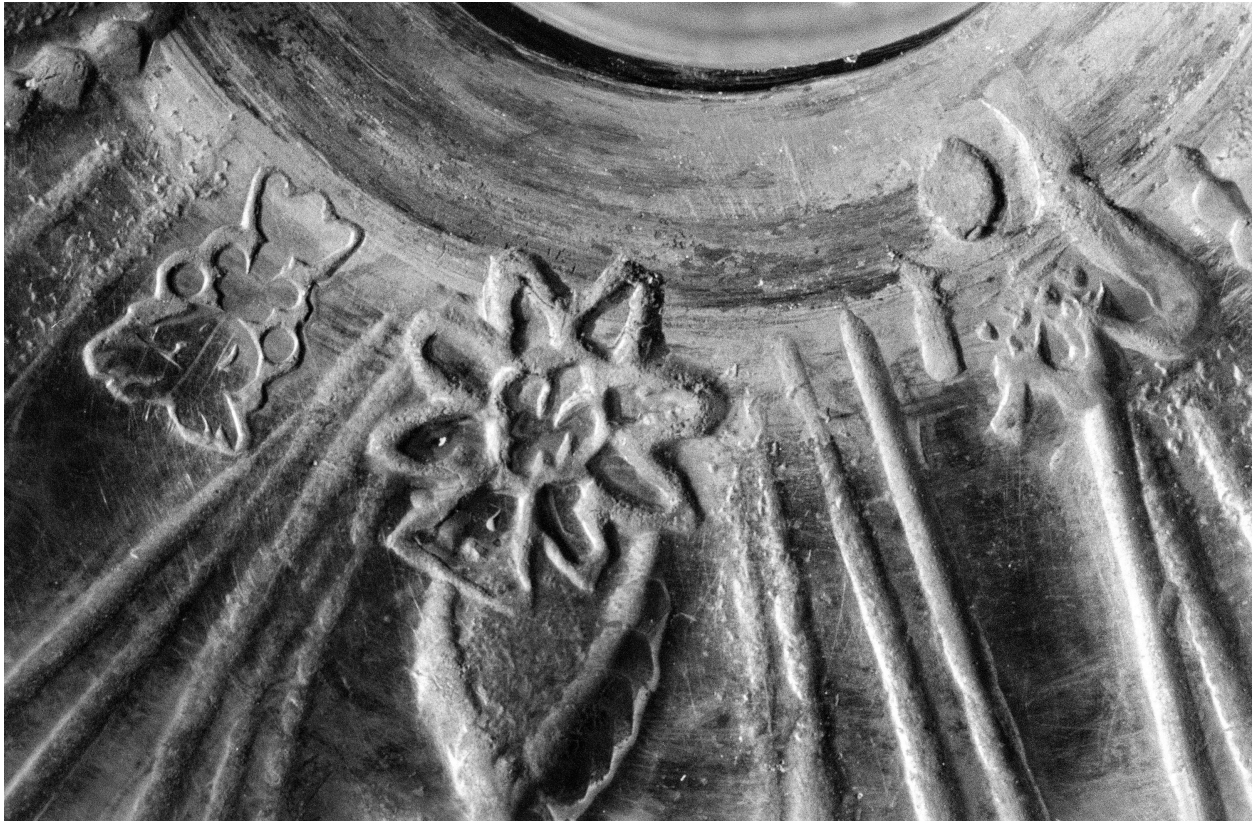
Poinçon de maître, poinçon de charge, détail.