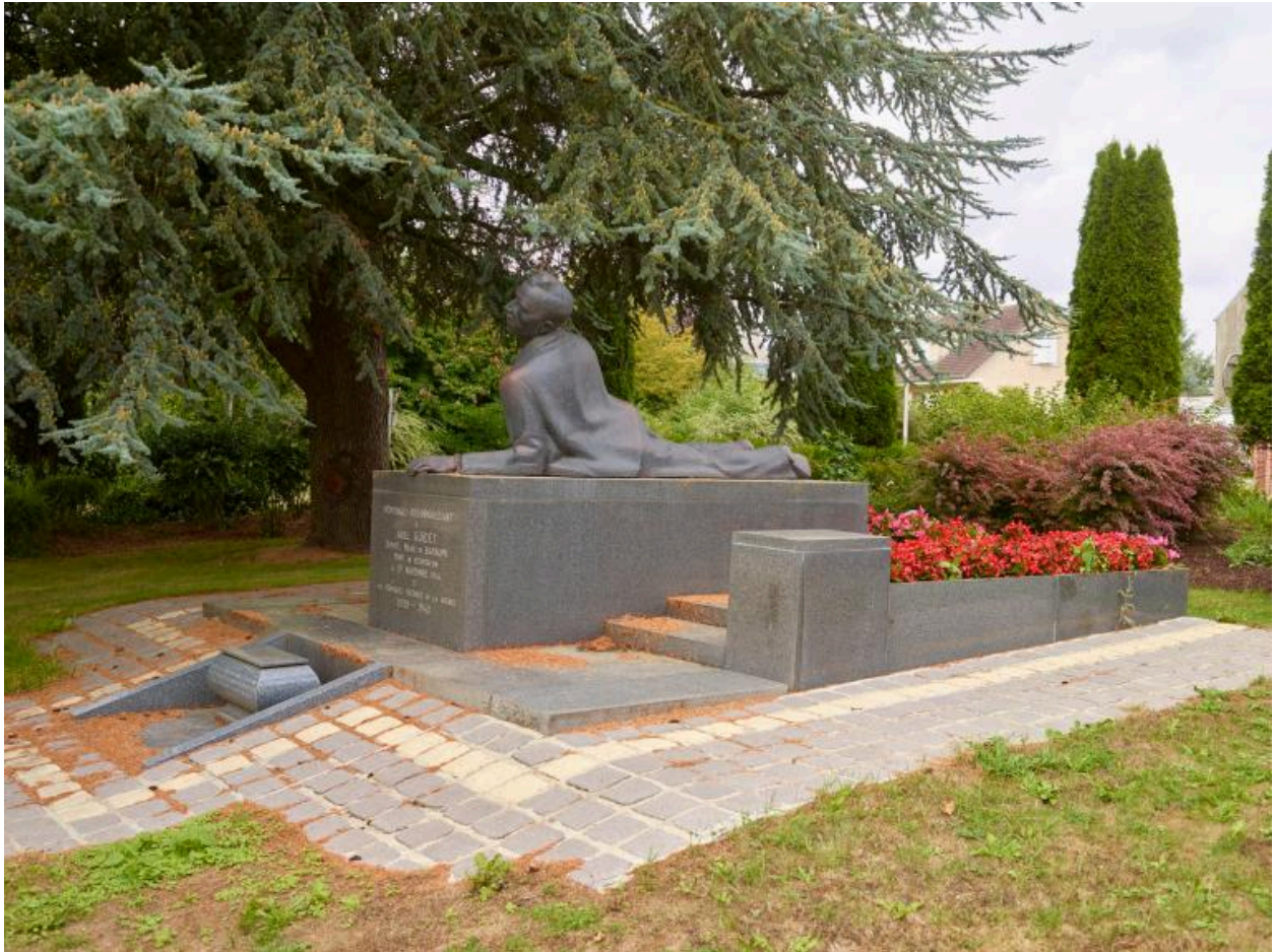
Vue générale, face arrière.