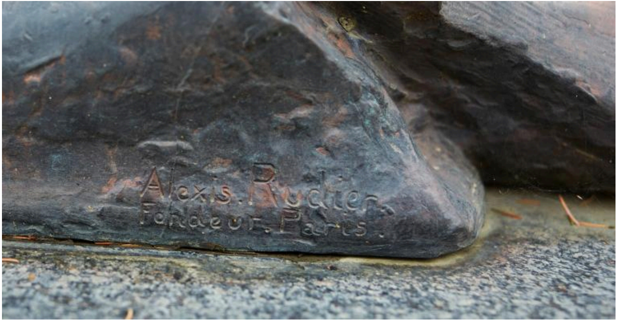
Vue de détail sur la signature du fondeur.