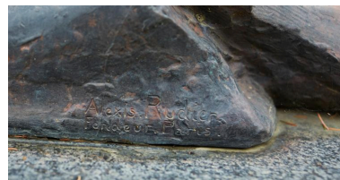
Vue de détail sur la signature du fondeur.