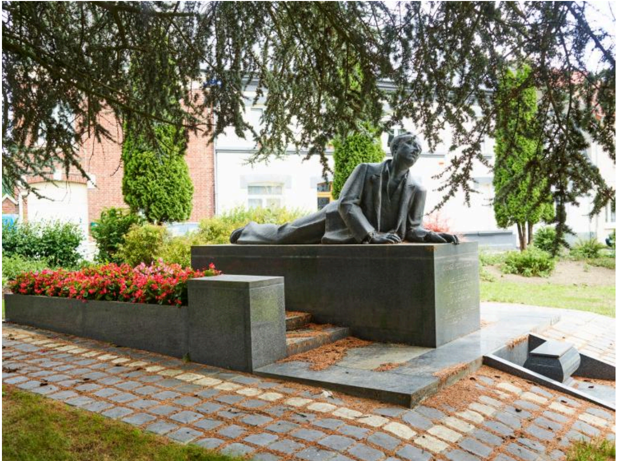
Vue générale, face avant.