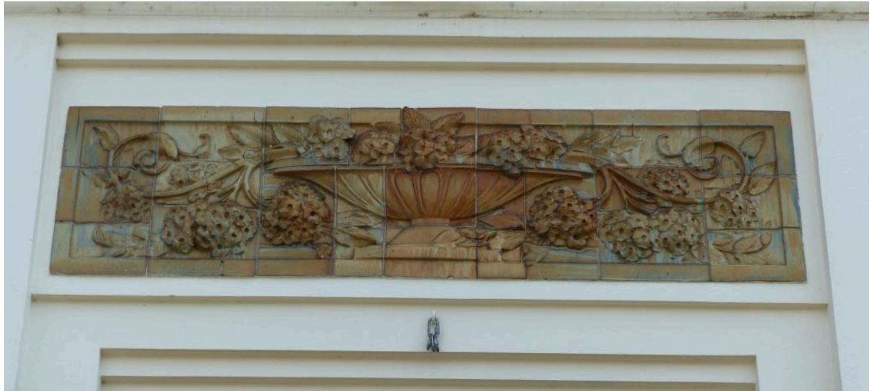
Vue de détail sur le décor de grès cérame.