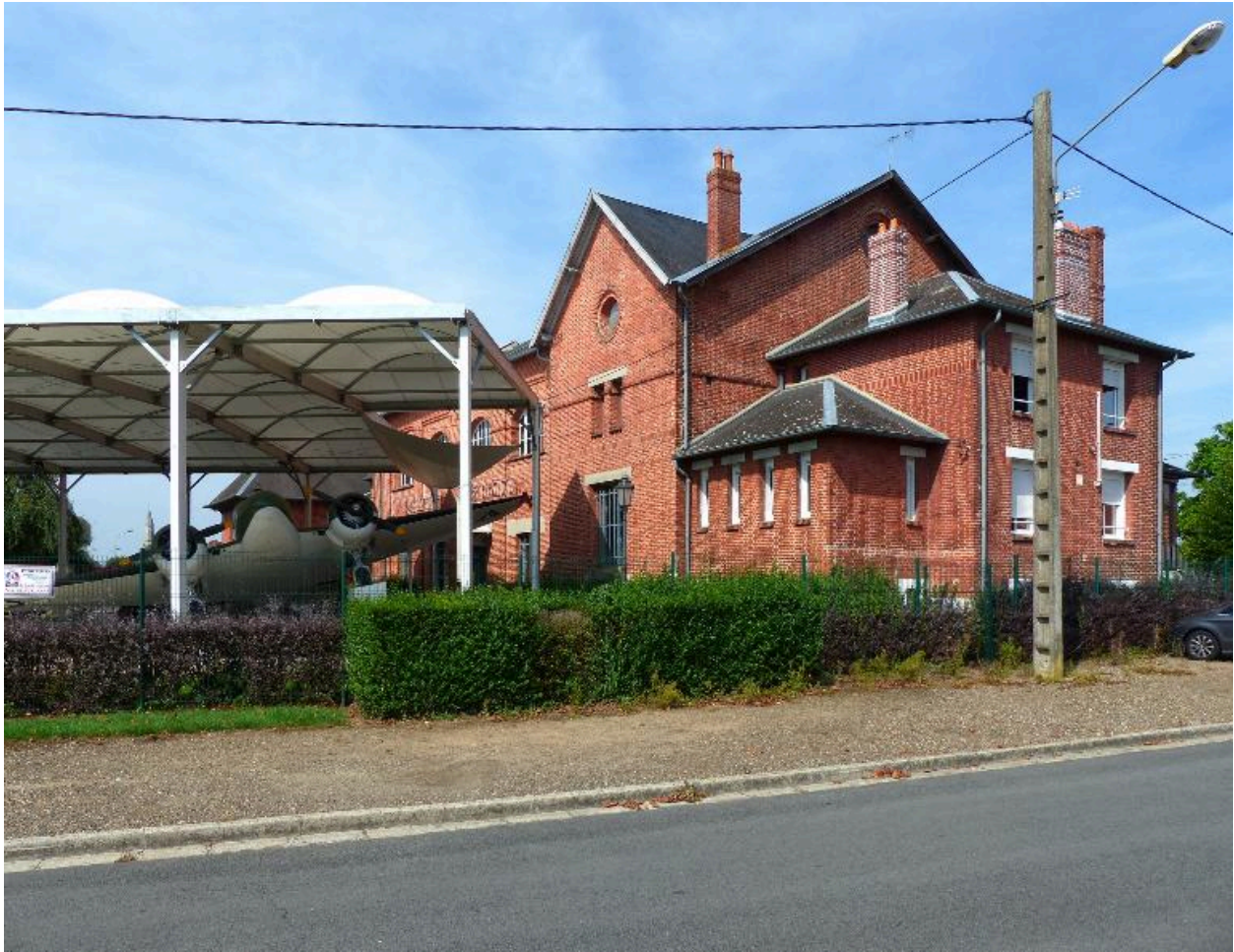
Vue depuis la rue Gouillard-Marcel.