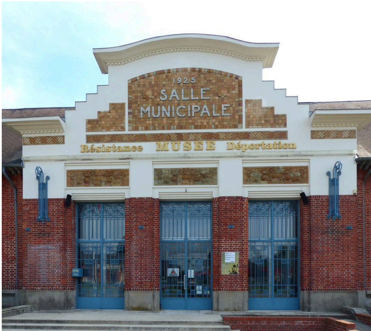
Vue de détail de la façade antérieure avec une inscription et une date portées.