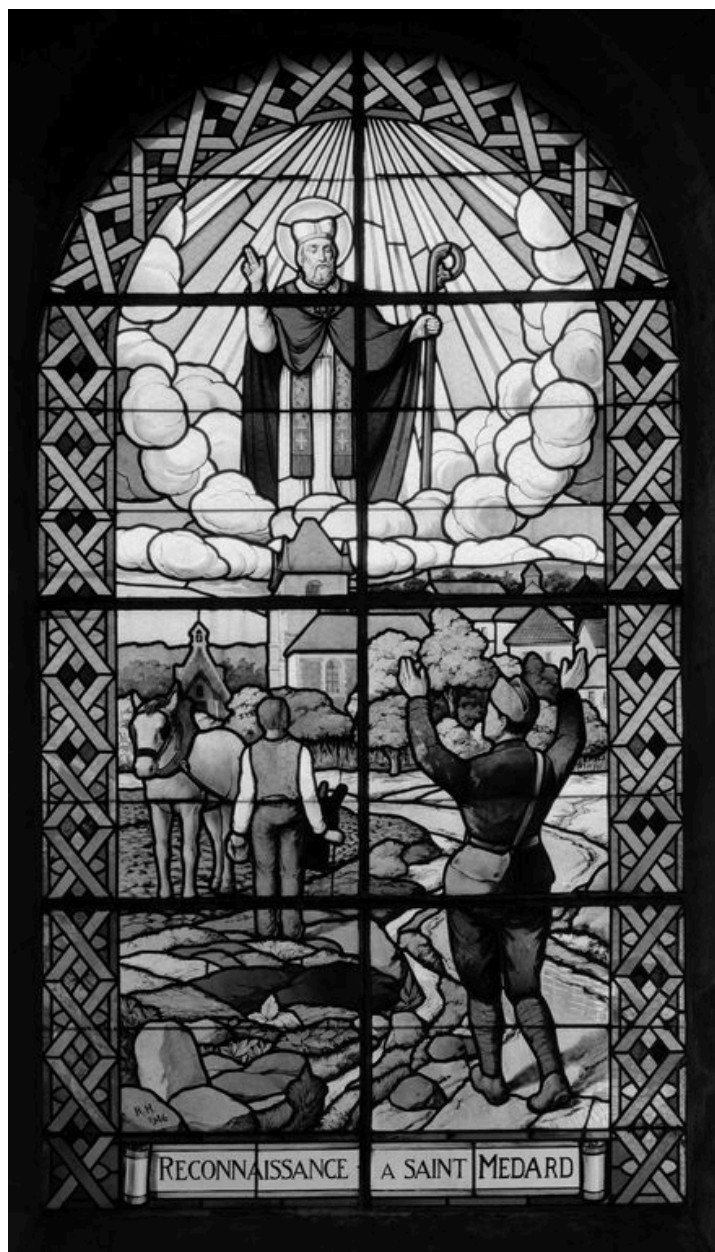
Verrière (baie 13) : Reconnaissance à saint Médard, attribuée à René Houille, 1946.