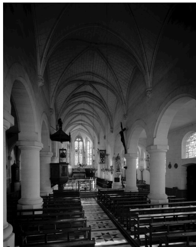
Vue intérieure vers le chœur. IVR22_19846001322V