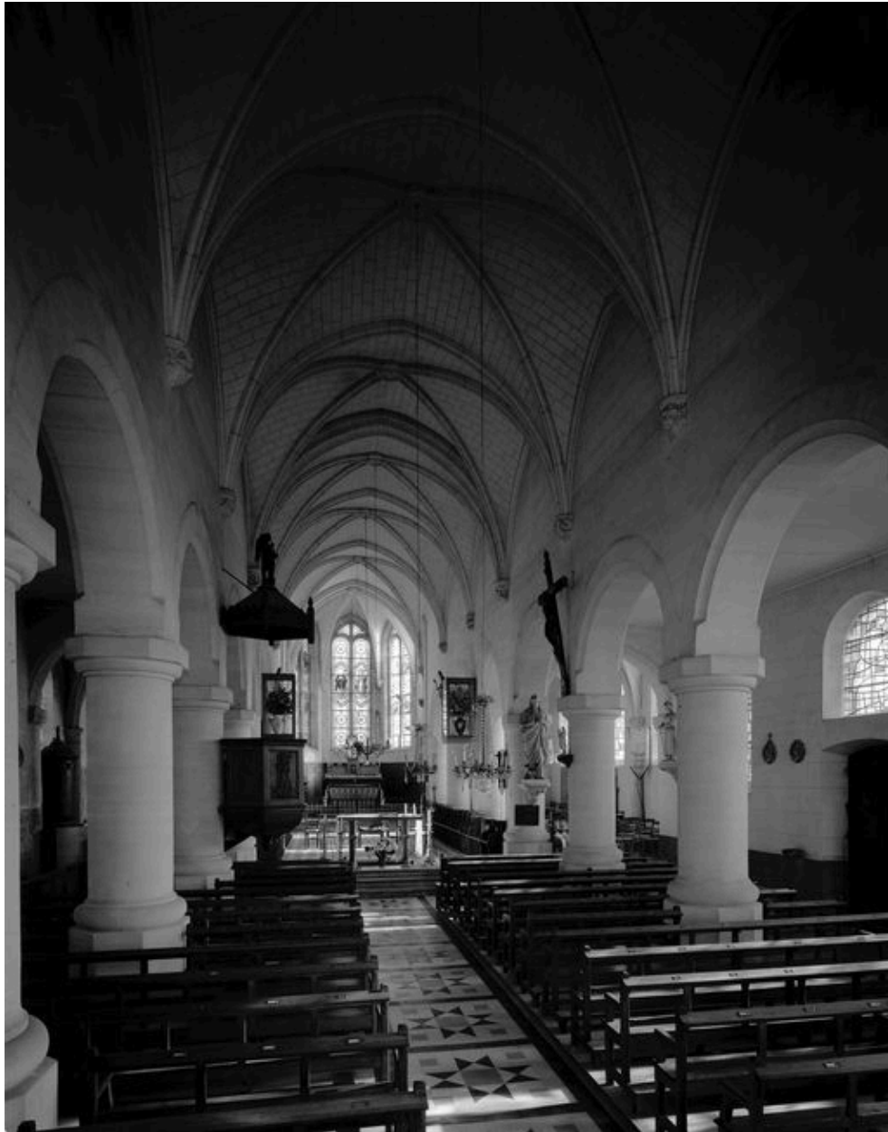
Vue intérieure vers le choeur.