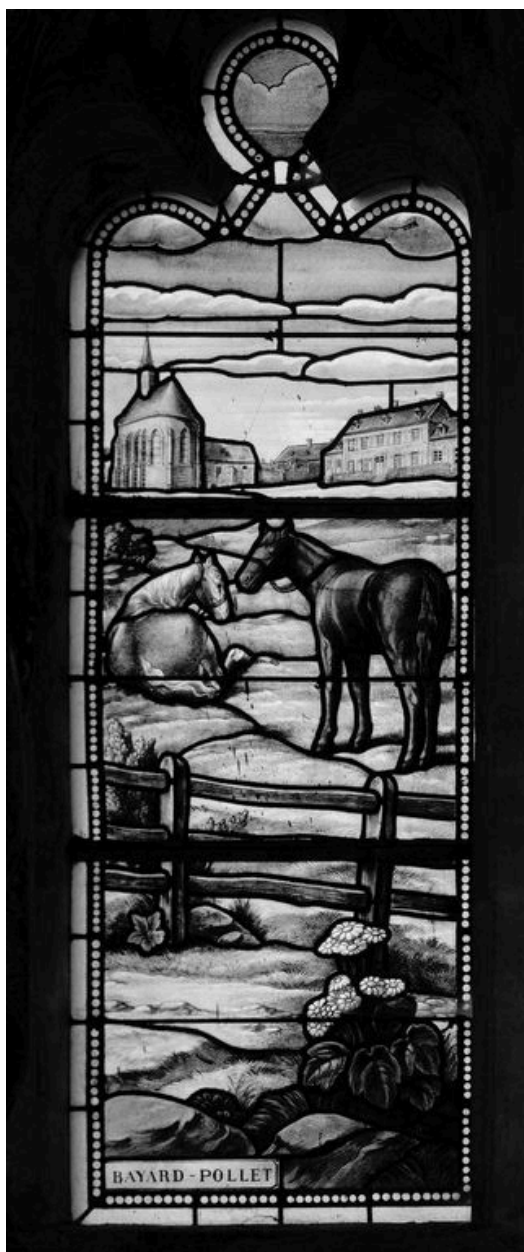
Détail de la verrière (baie 5) : saint Médard à Salency, offerte par la famille Bayard-Pollet, attribuée à Collinet, vers 1925.