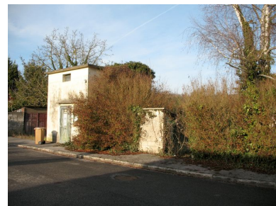
Le transformateur électrique le long de la rue Parot.