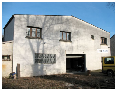
Le bâtiment principal construit pour la blanchisserie en 1959. IVR22_20096005027NUCA

IVR22_20096005254NUCA