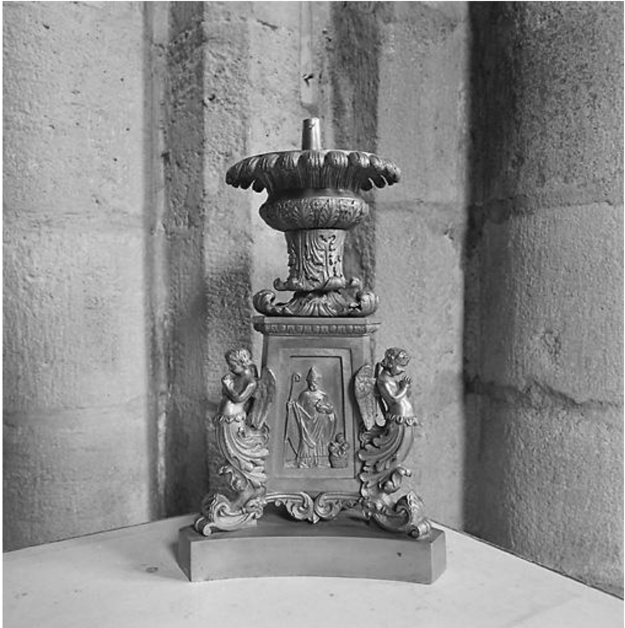
Vue générale d'un élément.