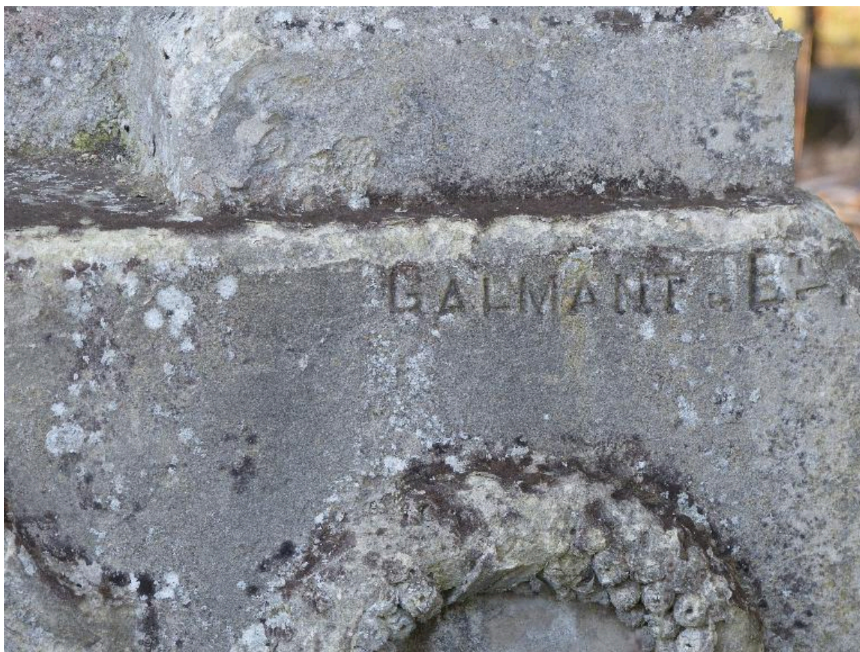
Vue de détail sur la signature de Jean-Baptiste Galmant.