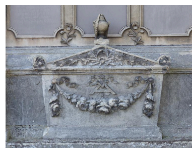
Vue de détail sur le cataphalque en trompe-l'oeil.