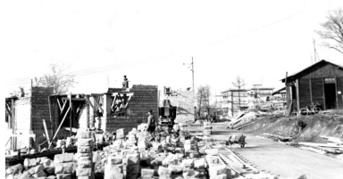
Construction des logements pour les employés du Cerchar, vers 1950 (archives d'entreprise).

Phot. Clarisse Lorieux IVR22_20106003044NUCAB