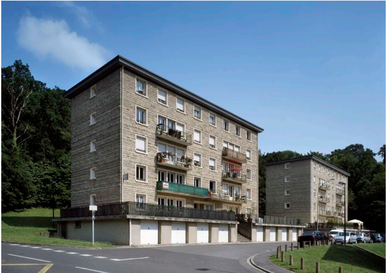
Vue générale des immeubles construits pour les employés du Cerchar.