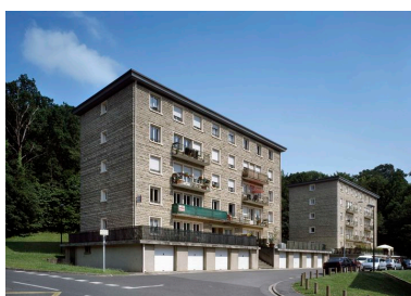
Vue générale des immeubles construits pour les employés du Cerchar.

IVR22_20106003044NUCAB