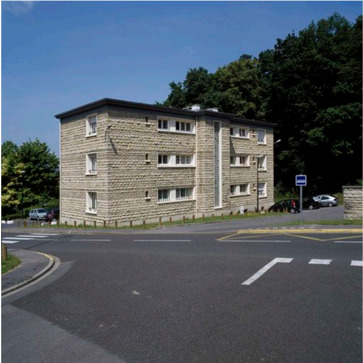
Elévation postérieure d'un immeuble de logements pour employés.