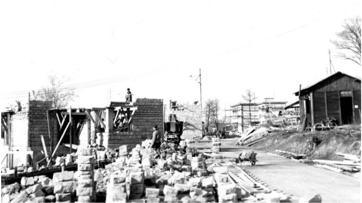
Construction des logements pour les employés du Cerchar, vers 1950 (archives d'entreprise).