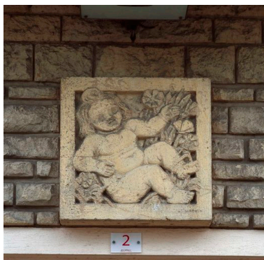
Bas-relief du bébé situé au-dessus de l'entrée d'un des immeubles.

Gaston Watkin (sculpteur). IVR22_20106000463XA