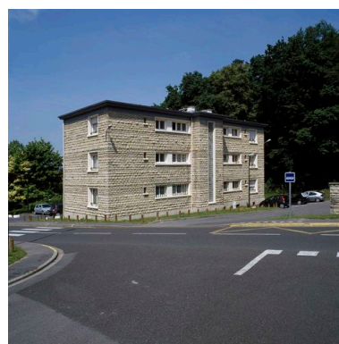
Elévation postérieure d'un immeuble de logements pour employés.

IVR22_20106000461VA