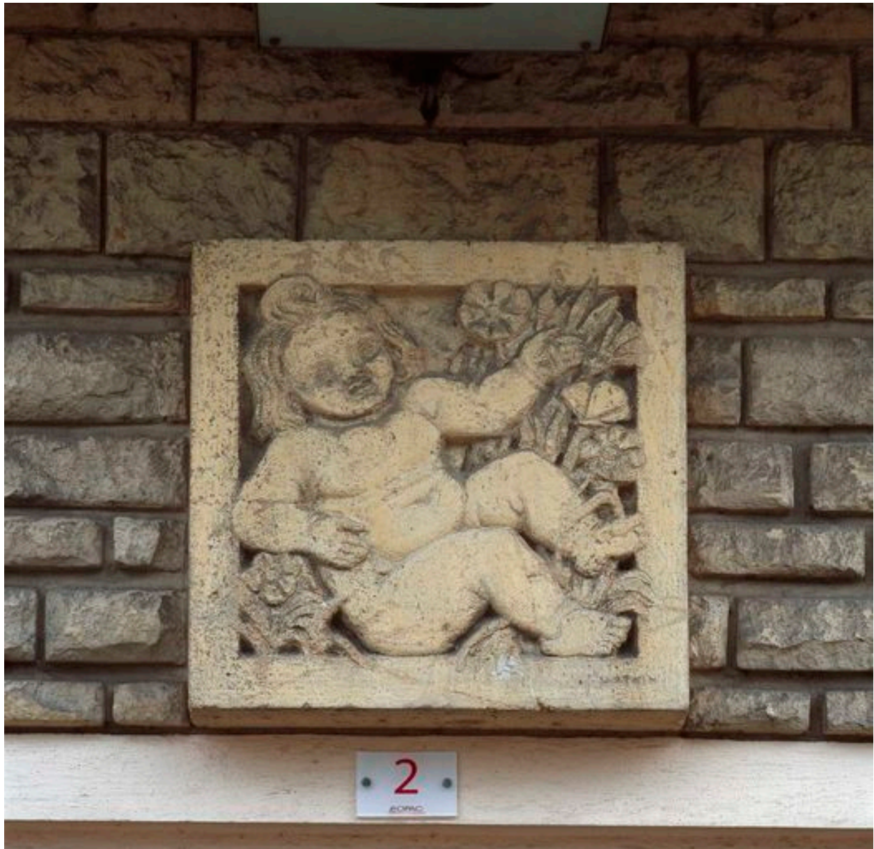
Bas-relief du bébé situé au-dessus de l'entrée d'un des immeubles. Gaston Watkin (sculpteur).