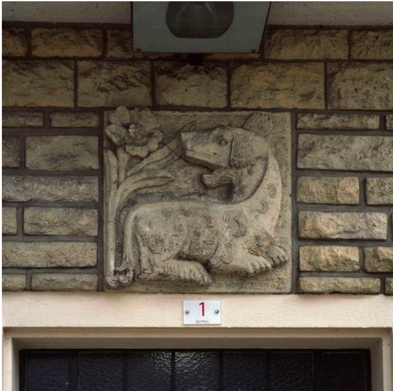
Bas-relief du chien situé au-dessus de l'entrée d'un des immeubles. Gaston Watkin (sculpteur).