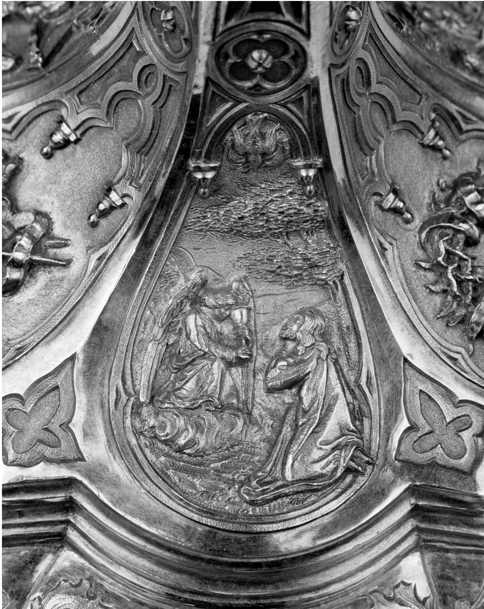
Pied, Agonie du Christ.