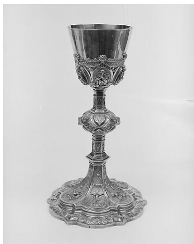
Vue générale. IVR31_19876200553X