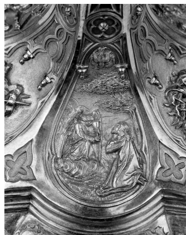
Pied, Agonie du Christ.