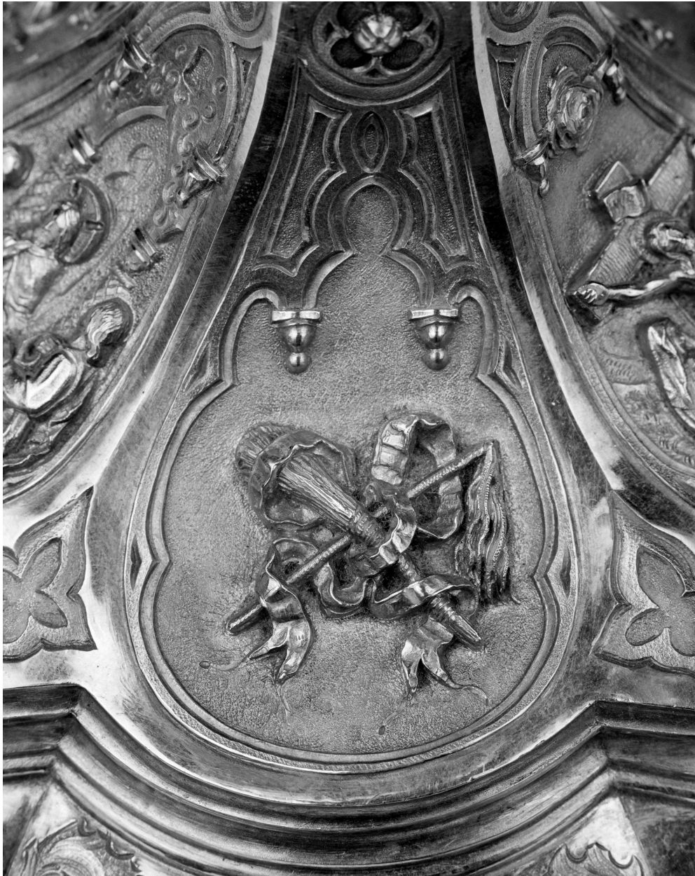
Pied, instruments de la Passion, fouet, verge.