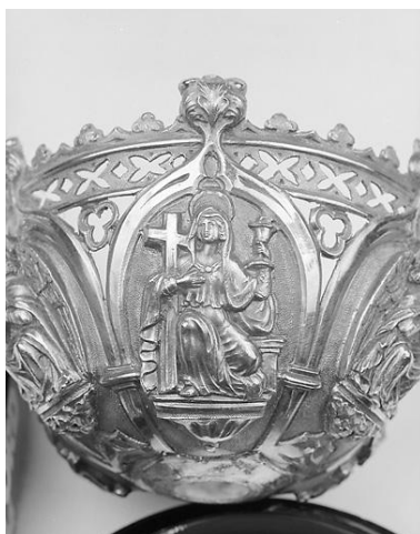
Fausse coupe, Foi. IVR31_19876200545X