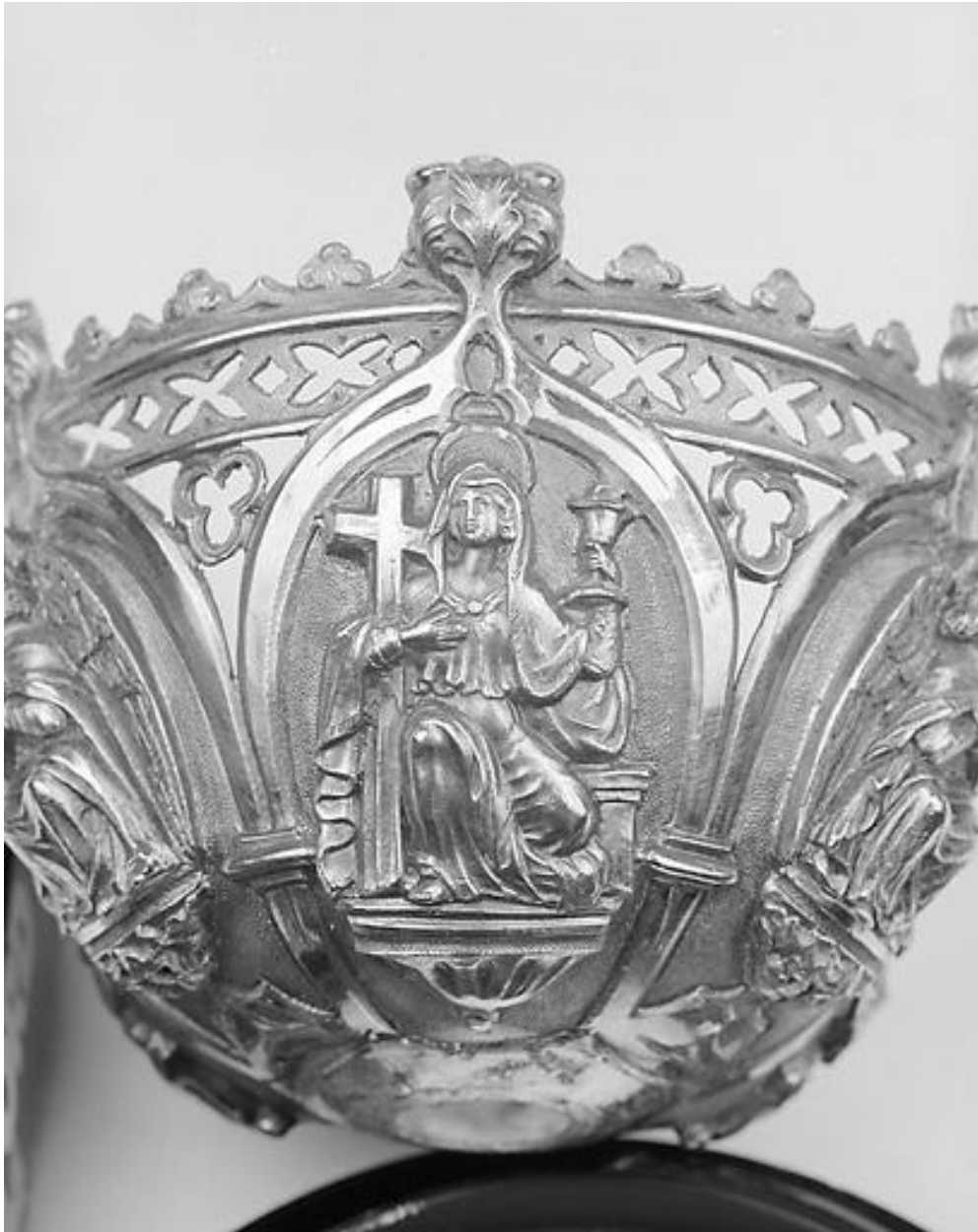
Fausse coupe, Foi.