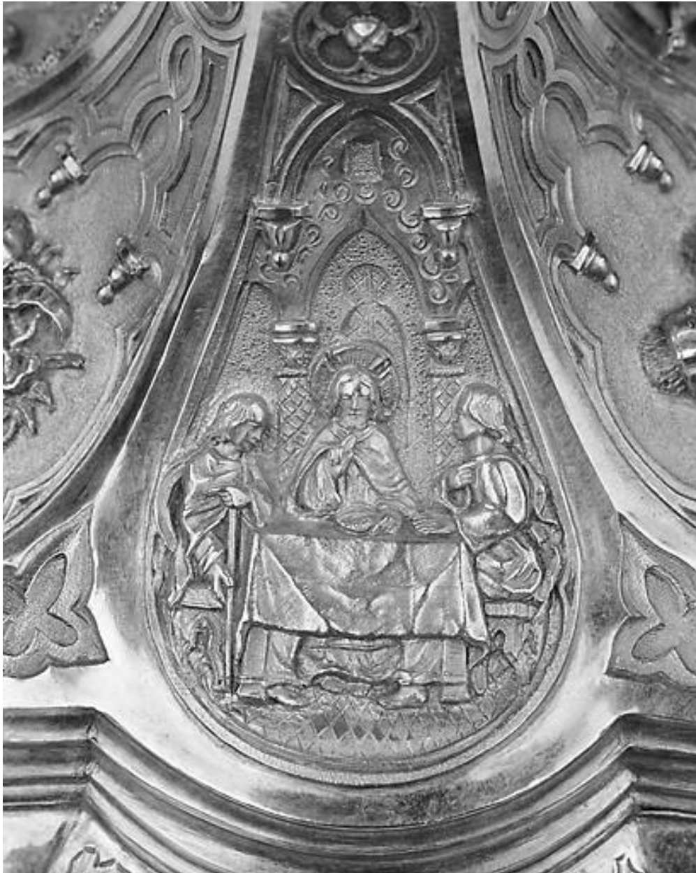
Pied, Pèlerins d'Emmaüs, repas.