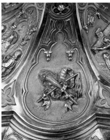
Pied, instruments de la Passion, fouet, verge.