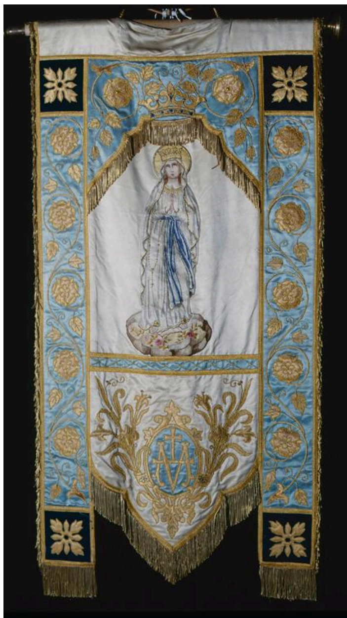
Vue d'une bannière de procession de Notre Dame de Grâces.