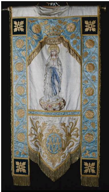
Vue d'une bannière de procession de Notre Dame de Grâces.

IVR22_19910201877XA