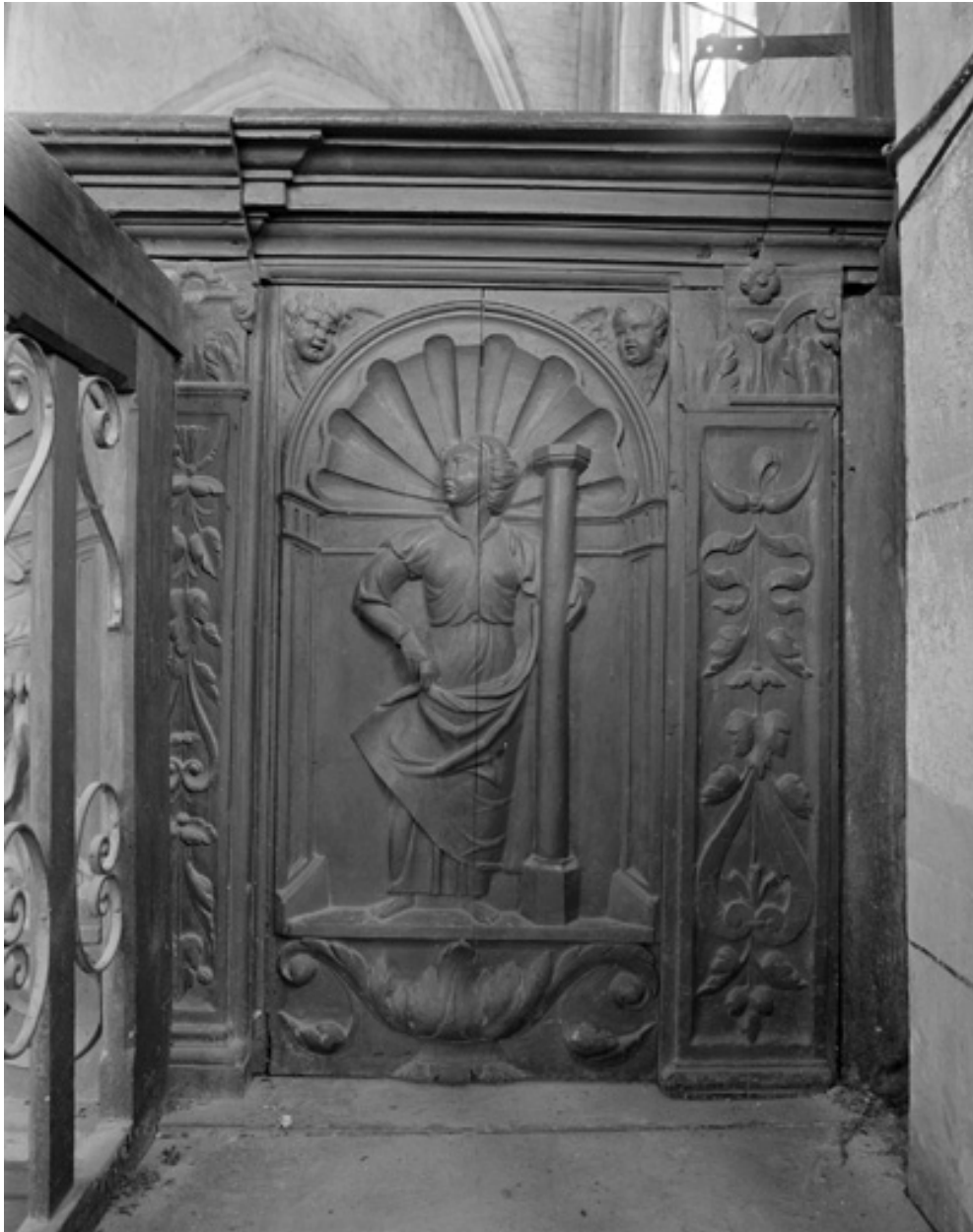
La Force, sculpture du dernier panneau du côté droit, chêne, 16e siècle.