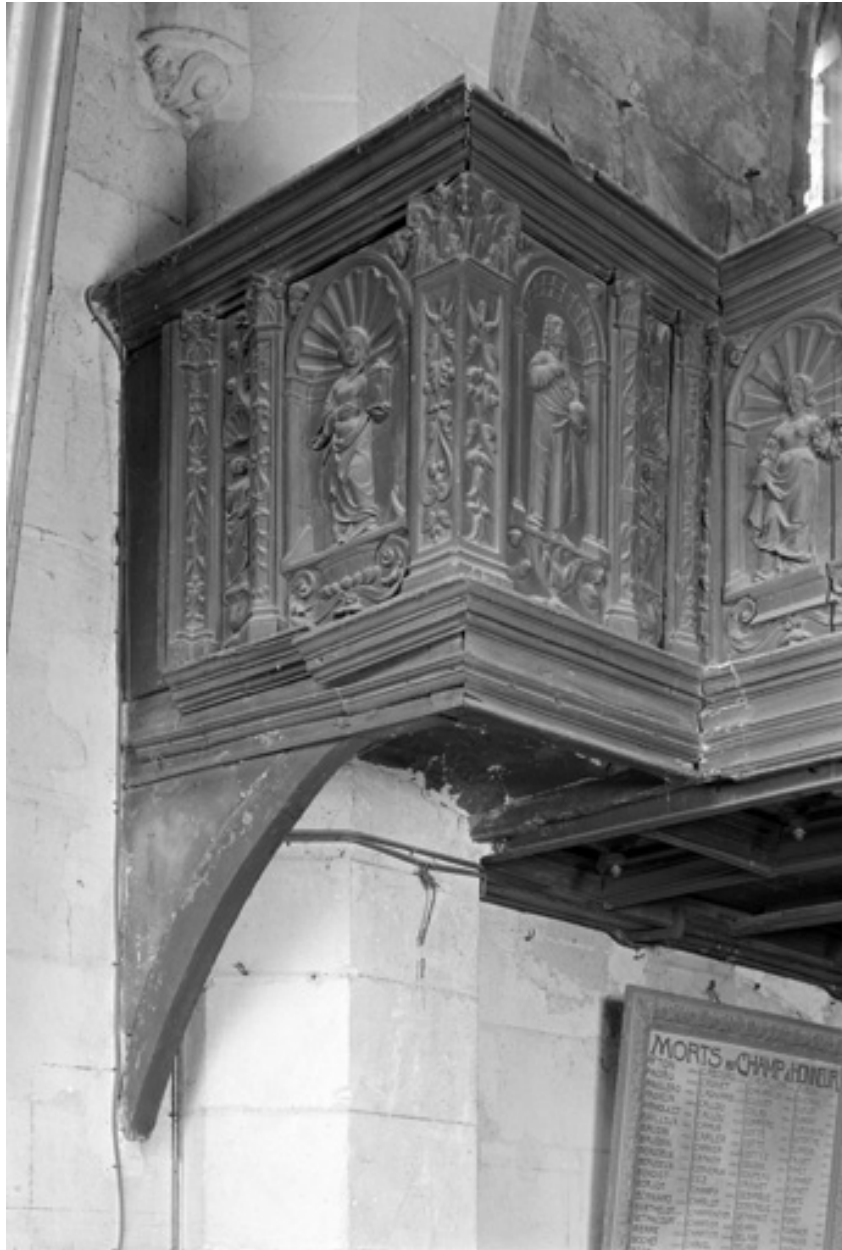
Angle gauche du garde-corps, chêne, 16e siècle.