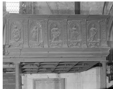
Panneau de droite de la partie centrale, chêne, 16e siècle.