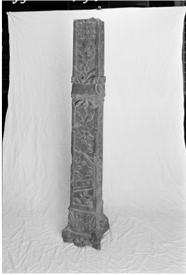
Un des piliers déposés à la bibliothèque municipale. IVR22_19930201930X

Plafond à caissons de la tribune d'orgue, refait au 19e siècle. IVR22_19940201006X