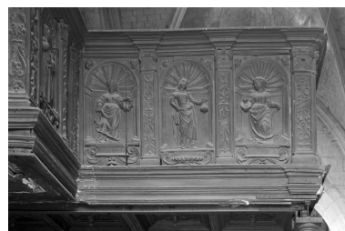
Angle du panneau de droite, chêne, 16e siècle. IVR22_19940200943X