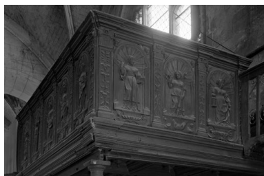
Angle du panneau de droite, chêne, 16e siècle. IVR22_19940200944X