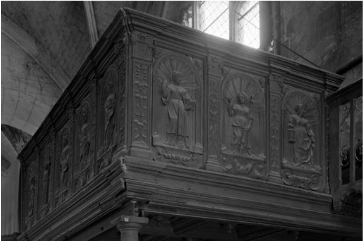
Angle du panneau de droite, chêne, 16e siècle.