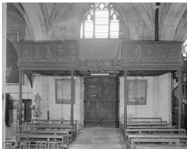
Vue d'ensemble, chêne, 16e siècle. IVR22_19940200975V

IVR22_19930202771XB