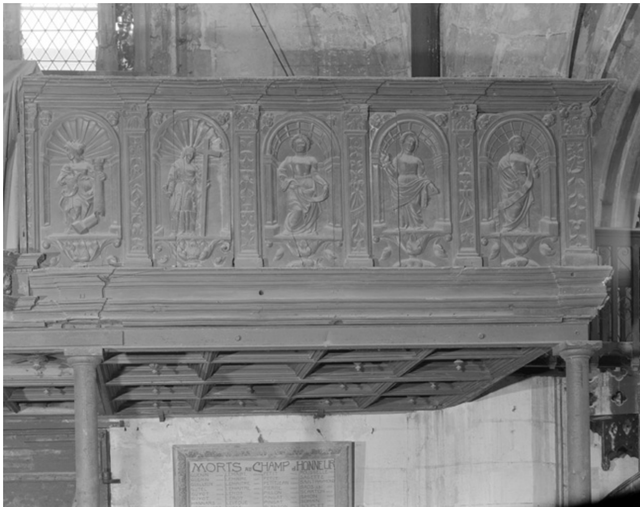
Panneau de droite de la partie centrale, chêne, 16e siècle.