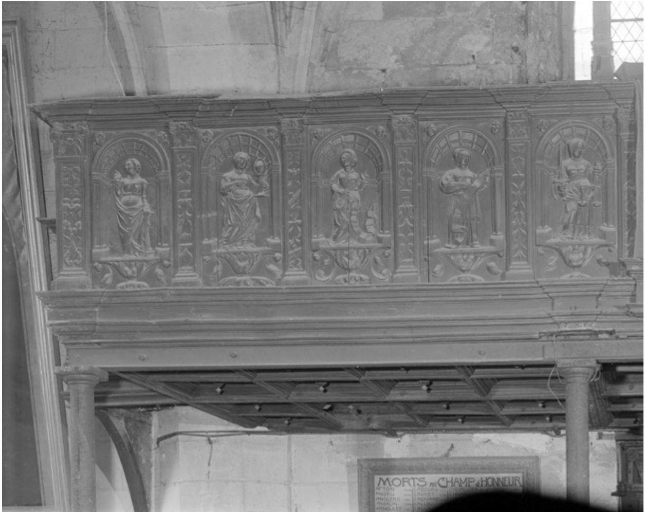
Panneau de gauche de la partie centrale, chêne, 16e siècle.