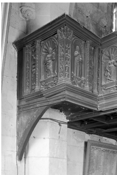
Angle gauche du garde-corps, chêne, 16e siècle.