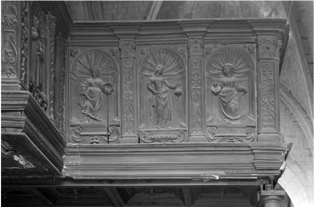
Angle du panneau de droite, chêne, 16e siècle.