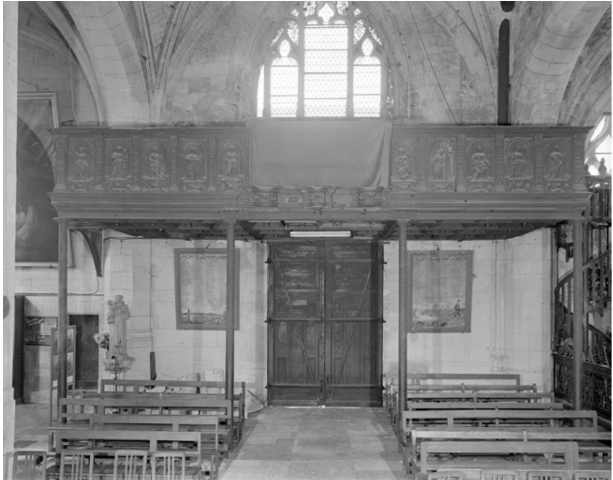
Vue d'ensemble, chêne, 16e siècle.