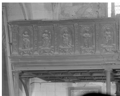
Panneau de gauche de la partie centrale, chêne, 16e siècle. IVR22_19940200977V