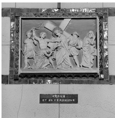
Station VI, Jésus essuyé par Sainte Véronique. IVR31_19956200100X