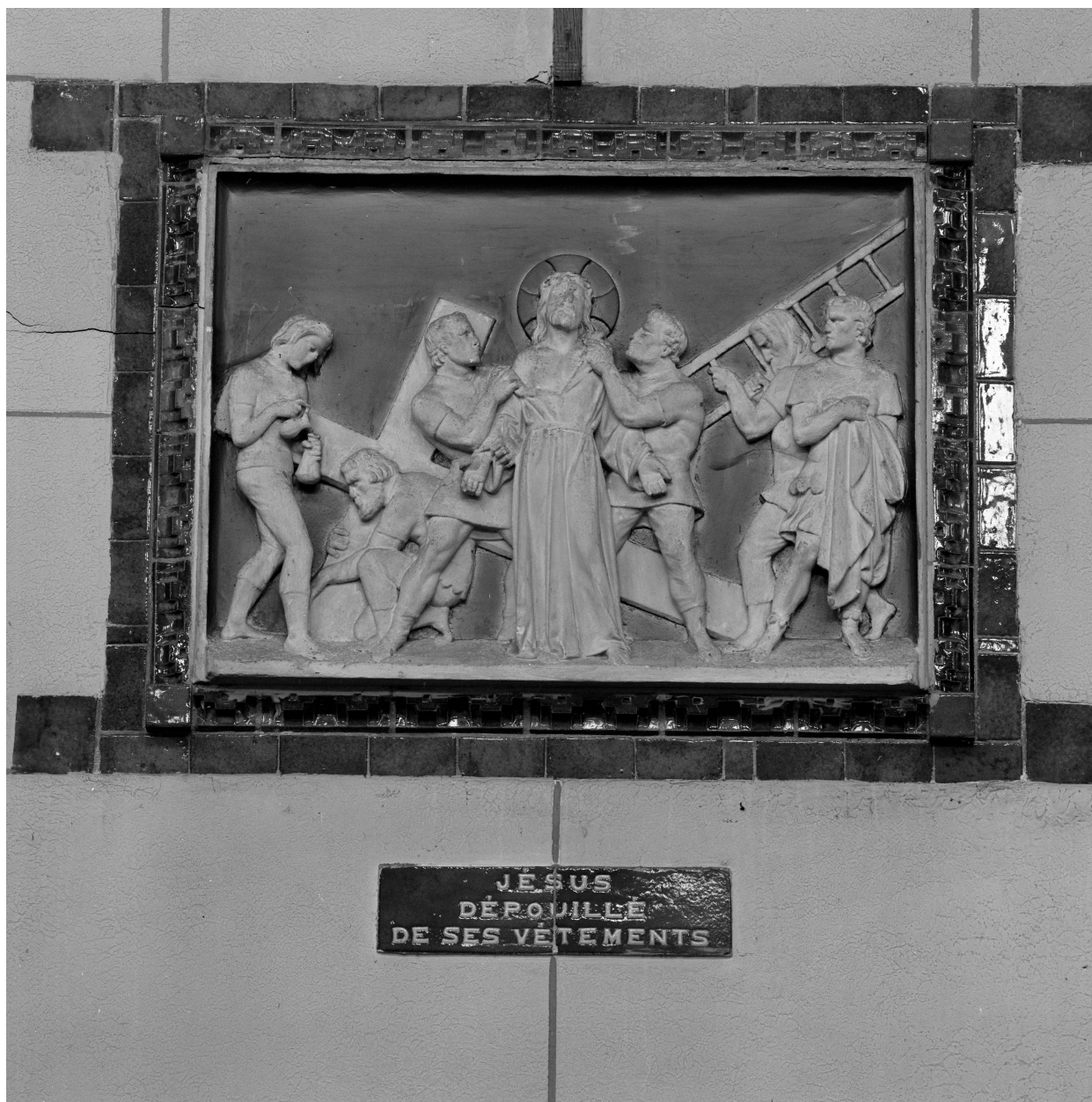
Station X, Jésus dépouillé de ses vêtements.