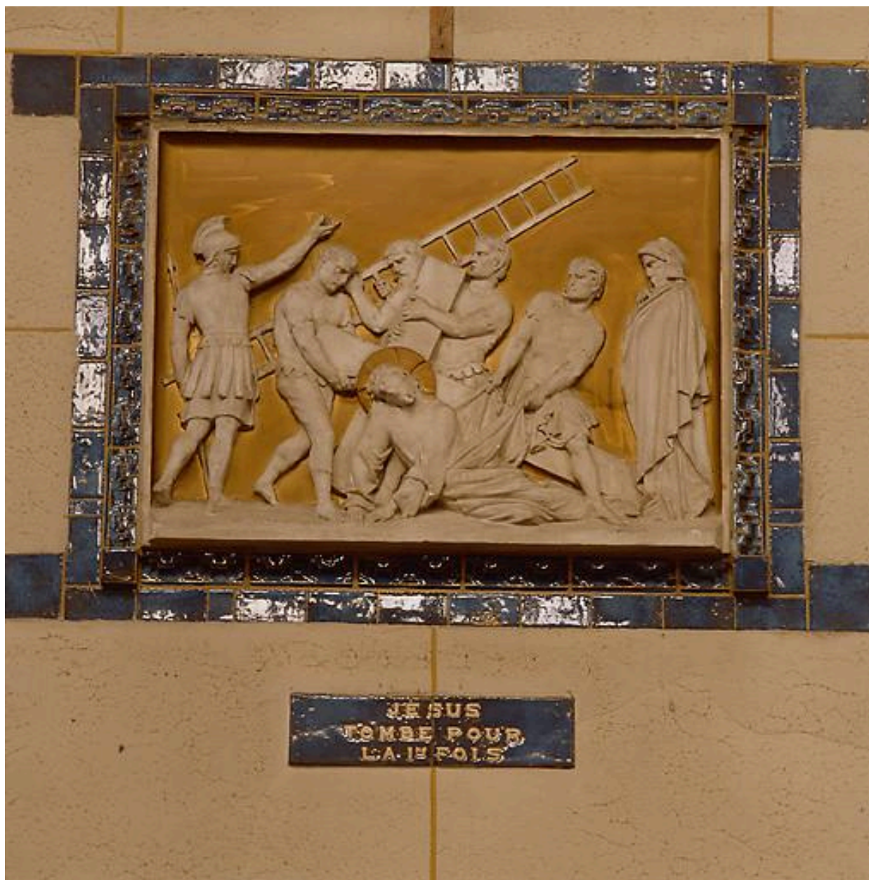
Station III, Jésus tombe pour la première fois.