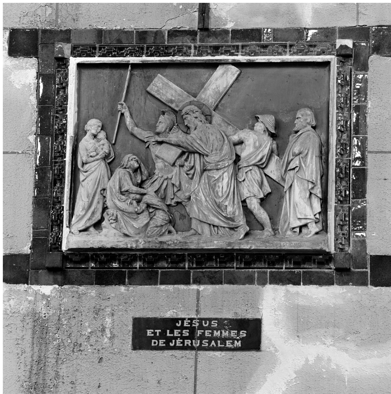
Station VIII, Jésus et les femmes de Jérusalem.