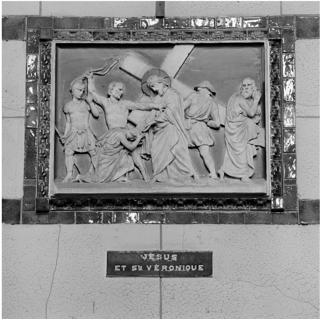
Station VI, Jésus essuyé par Sainte Véronique.