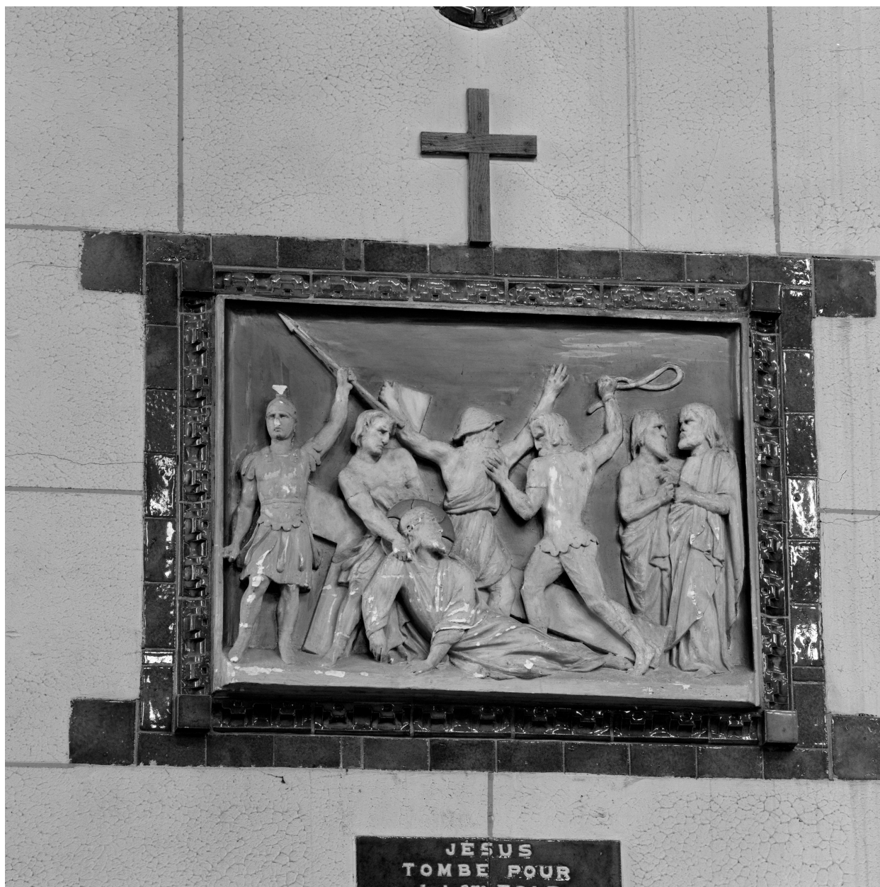
Station VII, Jésus tombe pour la 2e fois.