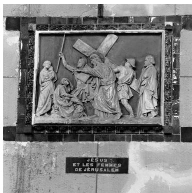
Station VIII, Jésus et les femmes de Jérusalem.