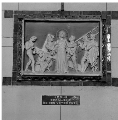
Station X, Jésus dépouillé de ses vêtements.