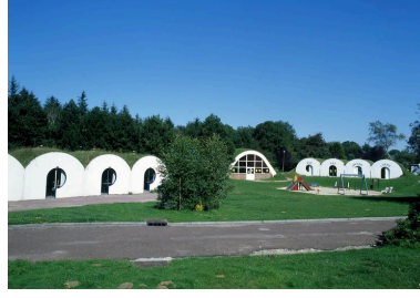
Camping municipal de Mers-les-Bains.

IVR22_20038001137XAB