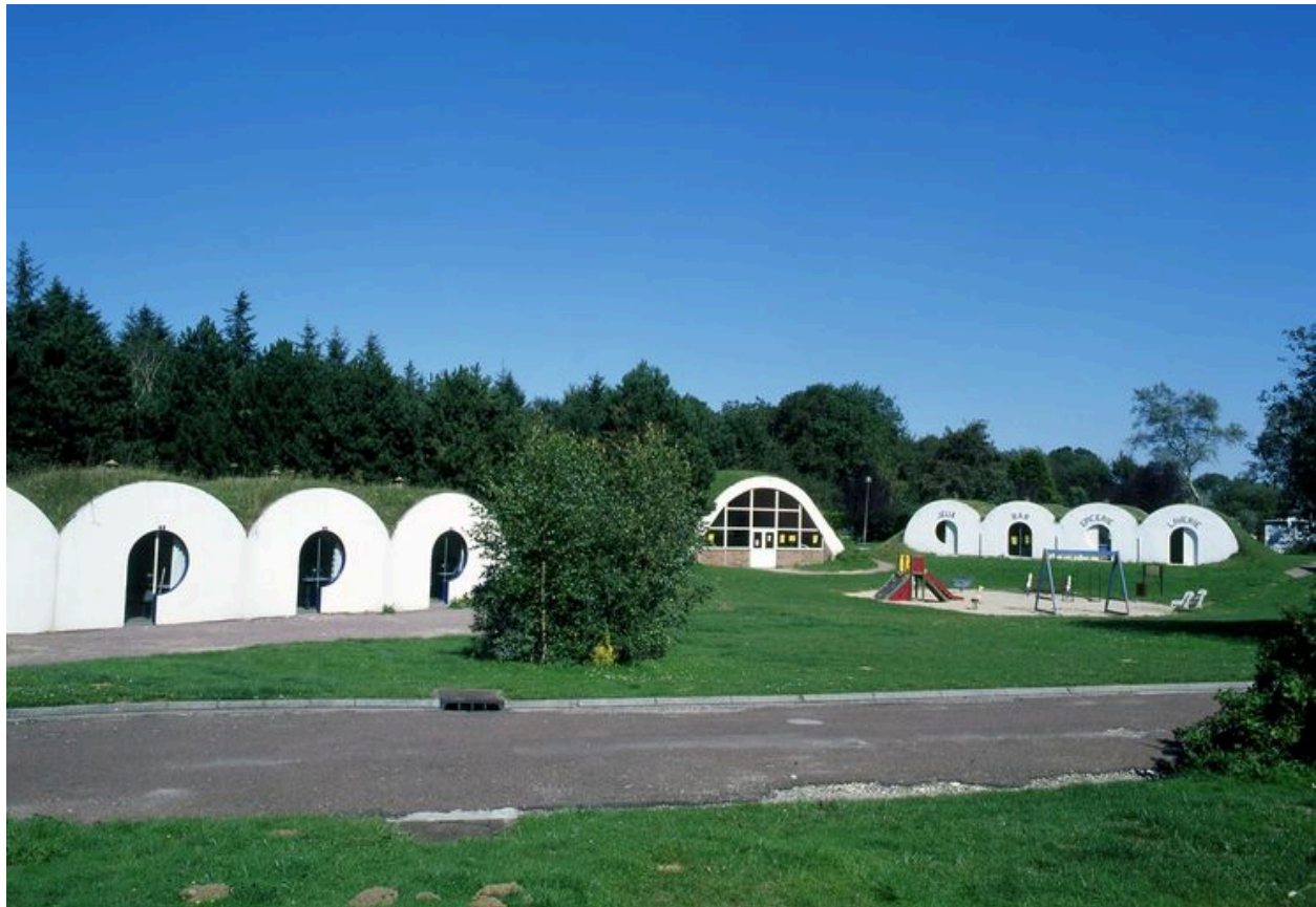
Camping municipal de Mers-les-Bains.