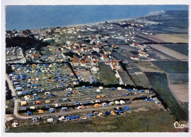
Camping au Crotoy, 2e moitié 20e siècle.

Phot. Monnehay-Vulliet Marie-Laure IVR22_20038001137XAB