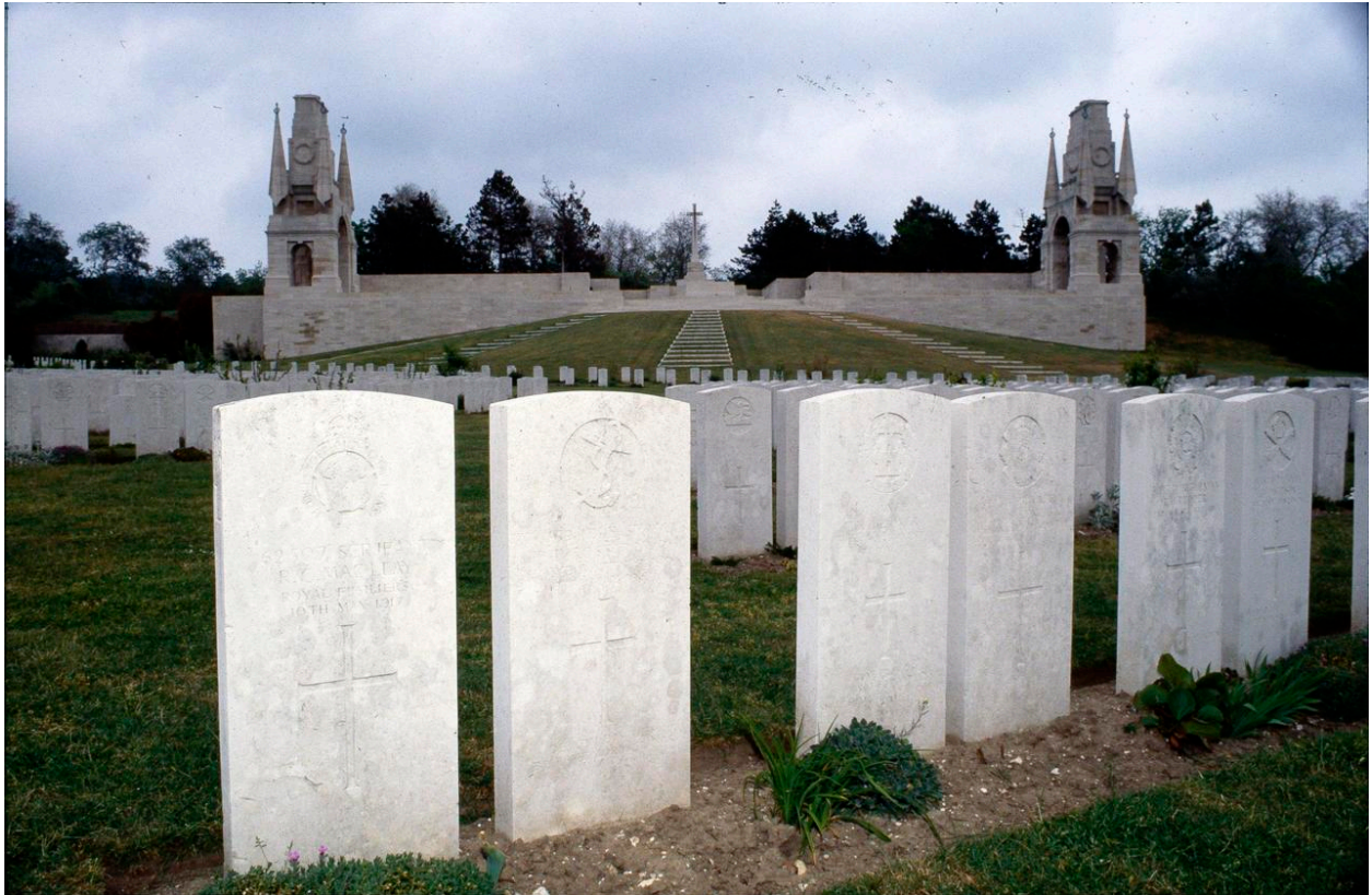
Vue générale de la terrasse faisant face à la nécropole.