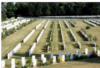
Vue partielle. IVR31_19826201500ZA