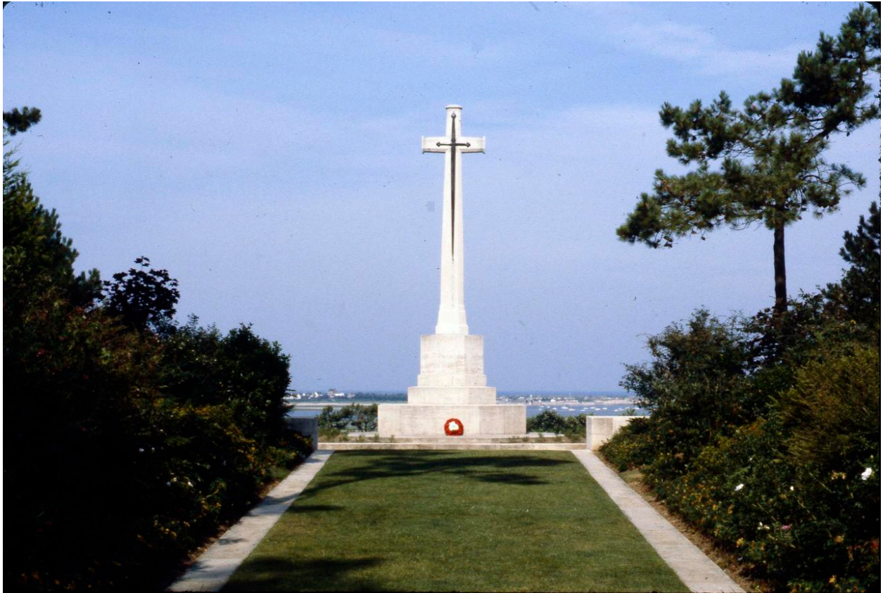
Croix du Sacrifice.