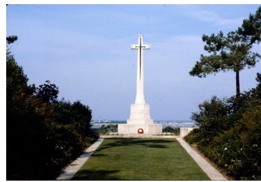
Croix du Sacrifice. IVR31_19826201499ZA