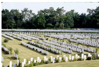
Vue partielle.