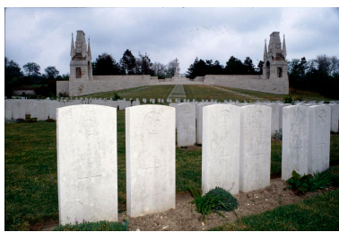
Vue générale de la terrasse faisant face à la nécropole. IVR31_19906200100ZA