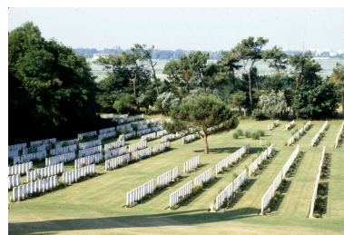
Vue partielle.