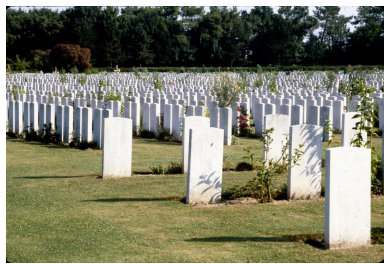
Vue partielle.