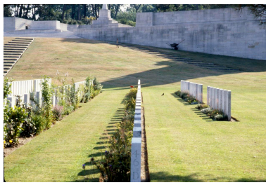
Vue partielle. IVR31_19826201498ZA