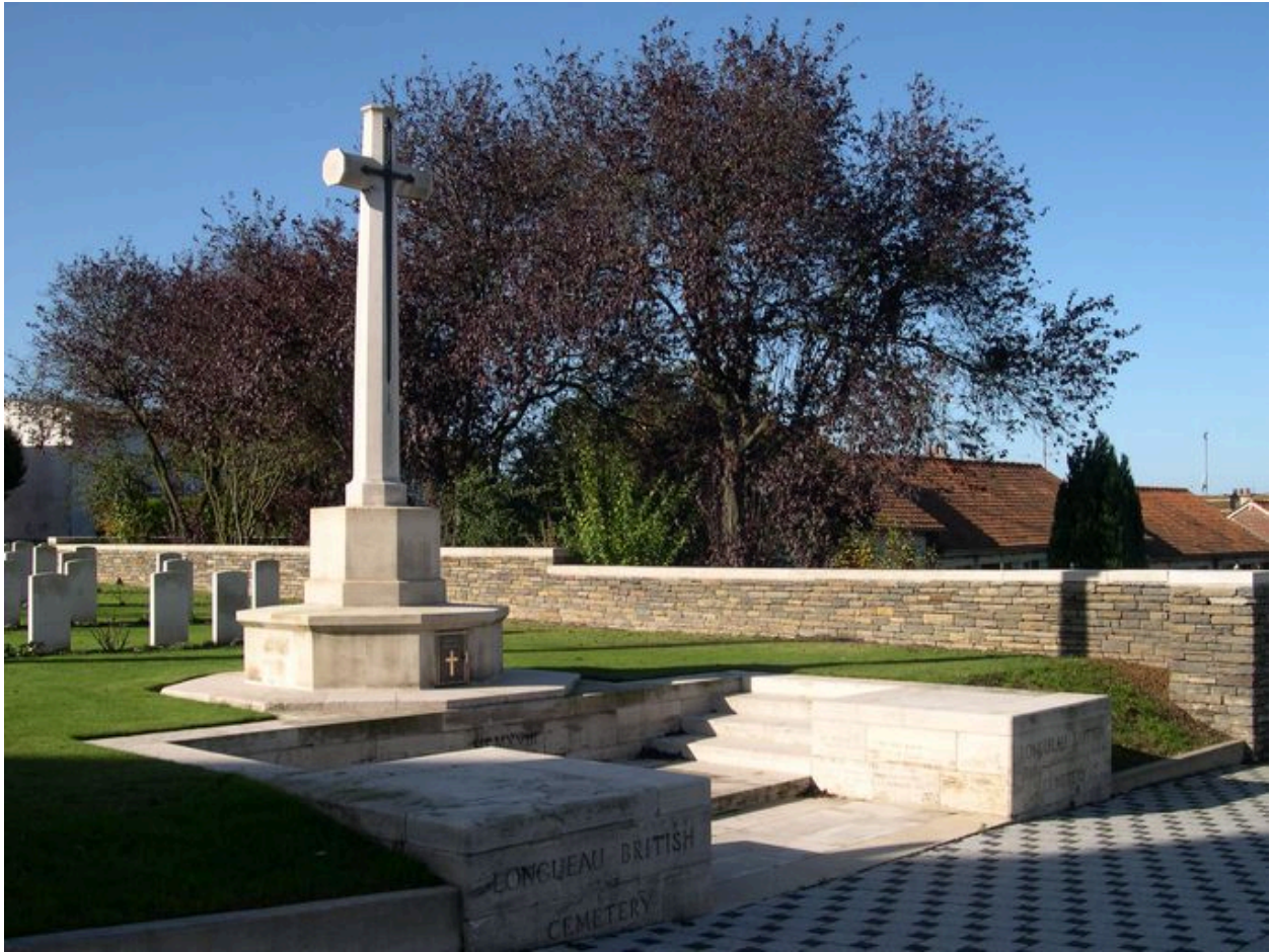
La croix du Sacrifice et l'emmarchement au nord du cimetière.