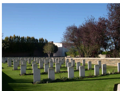
Vue des stèles, depuis le nord-est. IVR22_20048010456NUCA