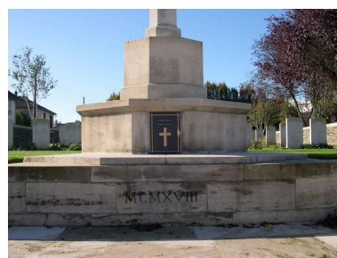
Vue de détail sur la base de la croix du Sacrifice.