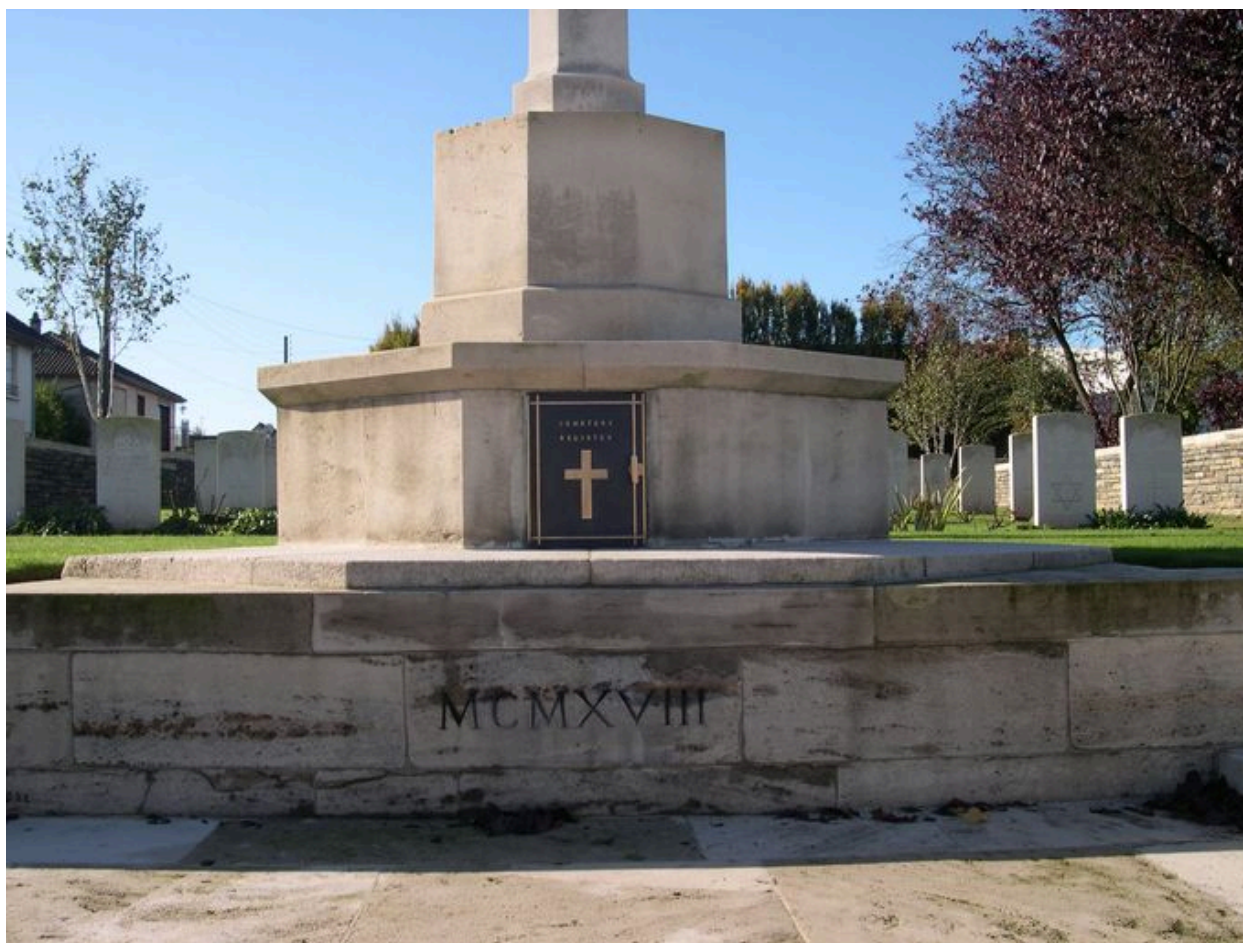
Vue de détail sur la base de la croix du Sacrifice.