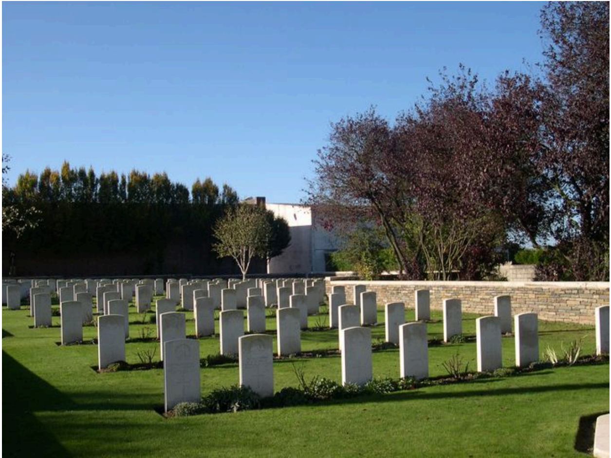
Vue des stèles, depuis le nord-est.