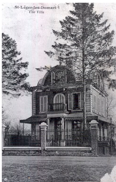
Vue d'ensemble, vers 1910 (coll. part.). IVR22_20088015053NUCA