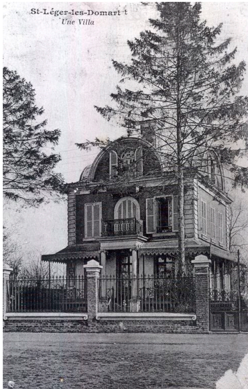
Vue d'ensemble, vers 1910.