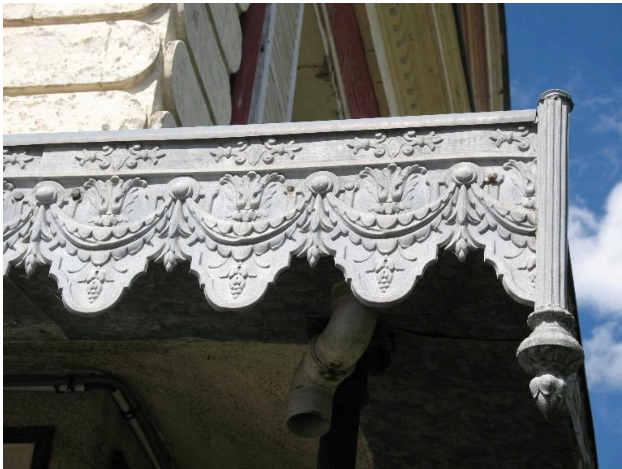
Détail du décor de la coursive.