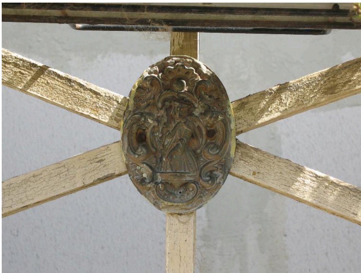
Médallions du garde-corps de la coursive.