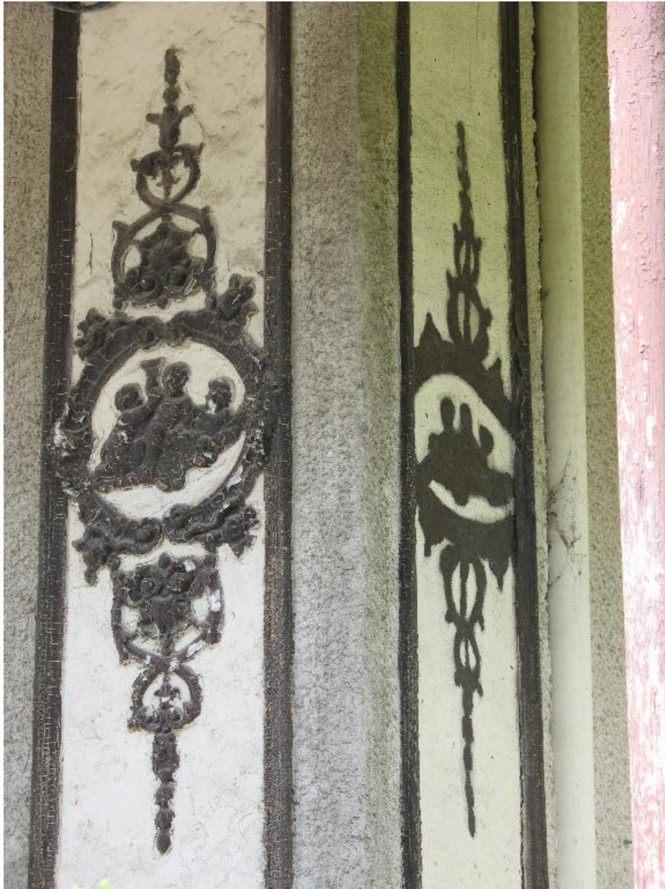
Décor des pilastres de la façade.