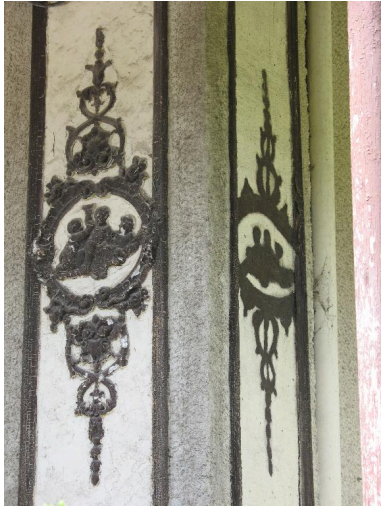
Décor des pilastres de la façade.