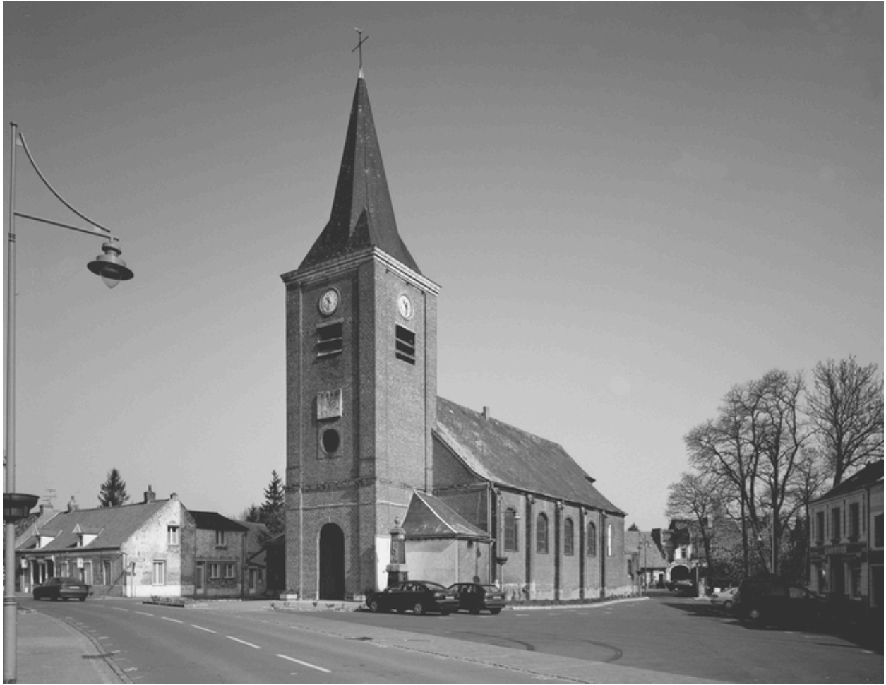
Vue générale extérieure, depuis la rue.