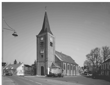
Vue générale extérieure, depuis la rue. IVR31_20045900160V