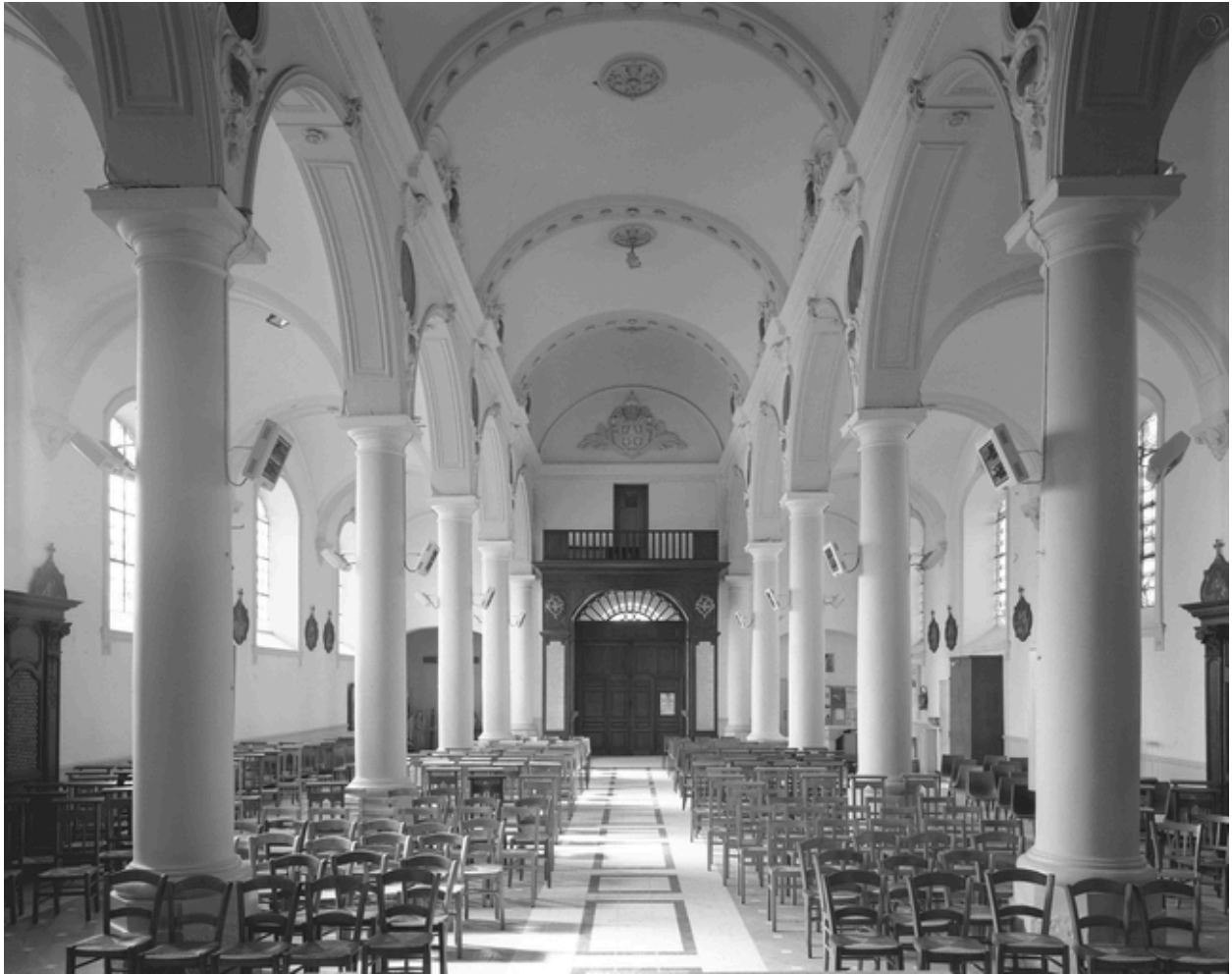
Vue générale intérieure, vers l'entrée.