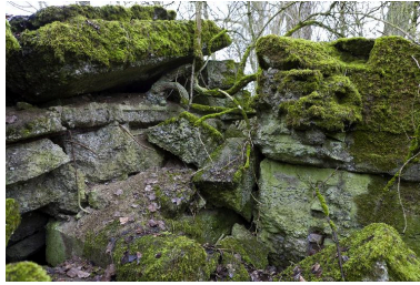
Elévation nord-est IVR31_20145904420NUCA