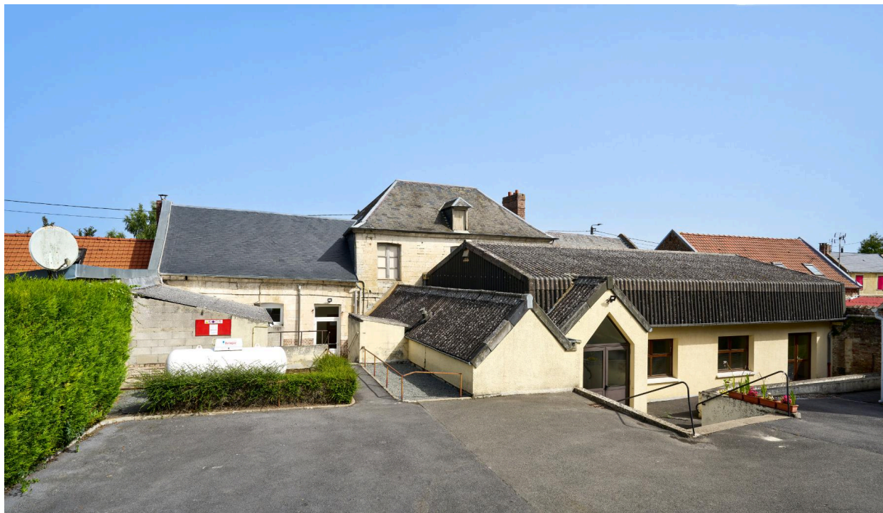
Vue sud de l'ancien presbytère et de la salle des fêtes.