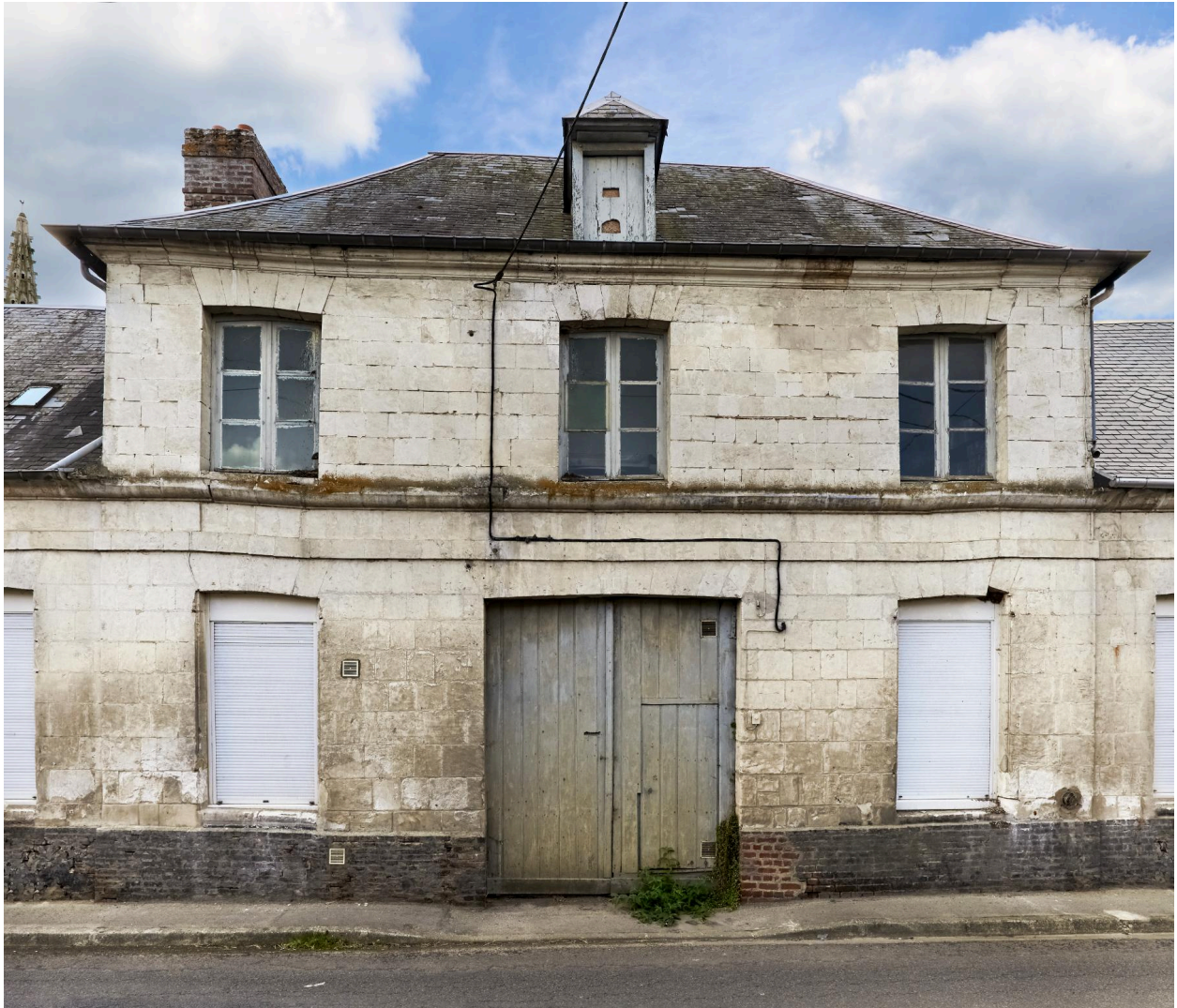
Vue nord du corps central de l'ancien presbytère.