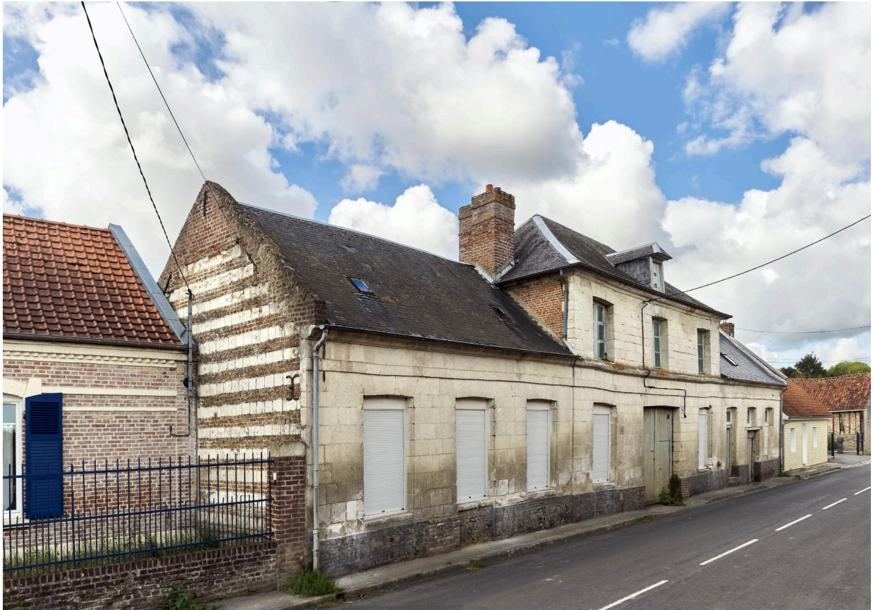
Vue d'ensemble de l'ancien presbytère prise depuis le nord-est.