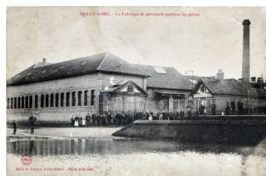
La fabrique de serrurerie pendant les grèves, carte postale