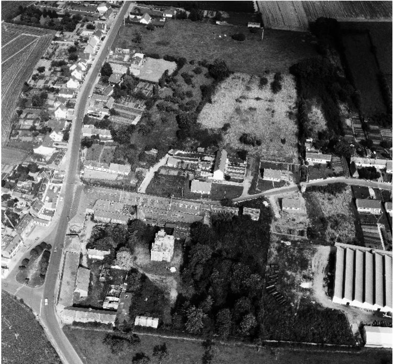
Vue aérienne, flanc ouest.