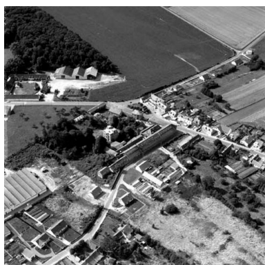
Vue aérienne, flanc sud-est. IVR22_19888001471P