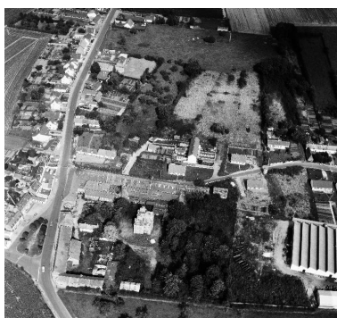
Vue aérienne, flanc ouest. IVR22_19888001472P