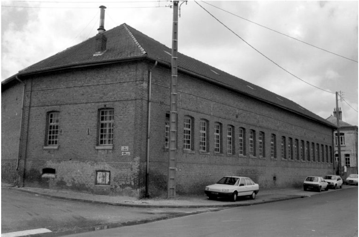
Élévation antérieure (flanc nord) des ateliers de fabrication.