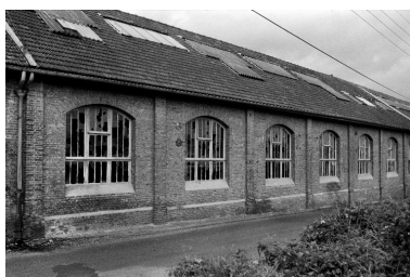
Atelier de fabrication, vue partielle, flanc est. IVR22_19888001107Z