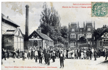
Rentrée des ouvriers à l'usine, carte postale