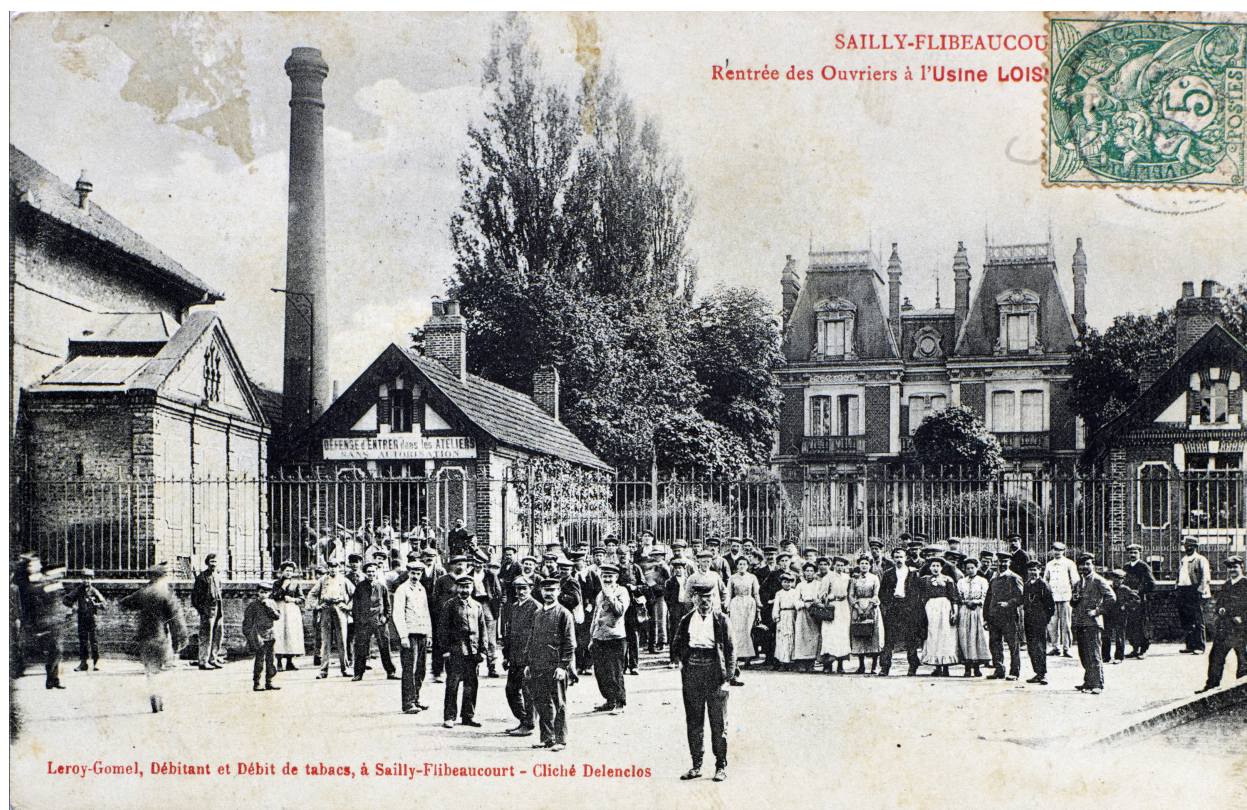
Rentrée des ouvriers à l'usine, carte postale.