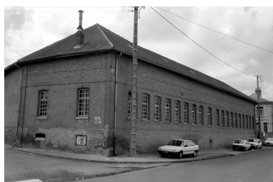
Élévation antérieure (flanc nord) des ateliers de fabrication. IVR22_19888001110Z