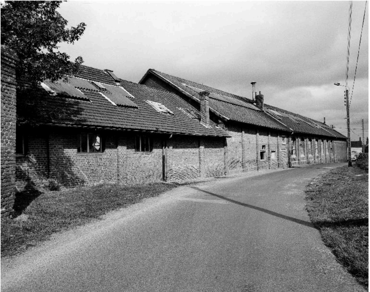
Atelier de fabrication est, vue d'ensemble.