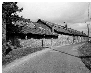
Atelier de fabrication est, vue d'ensemble. IVR22_19888000959X