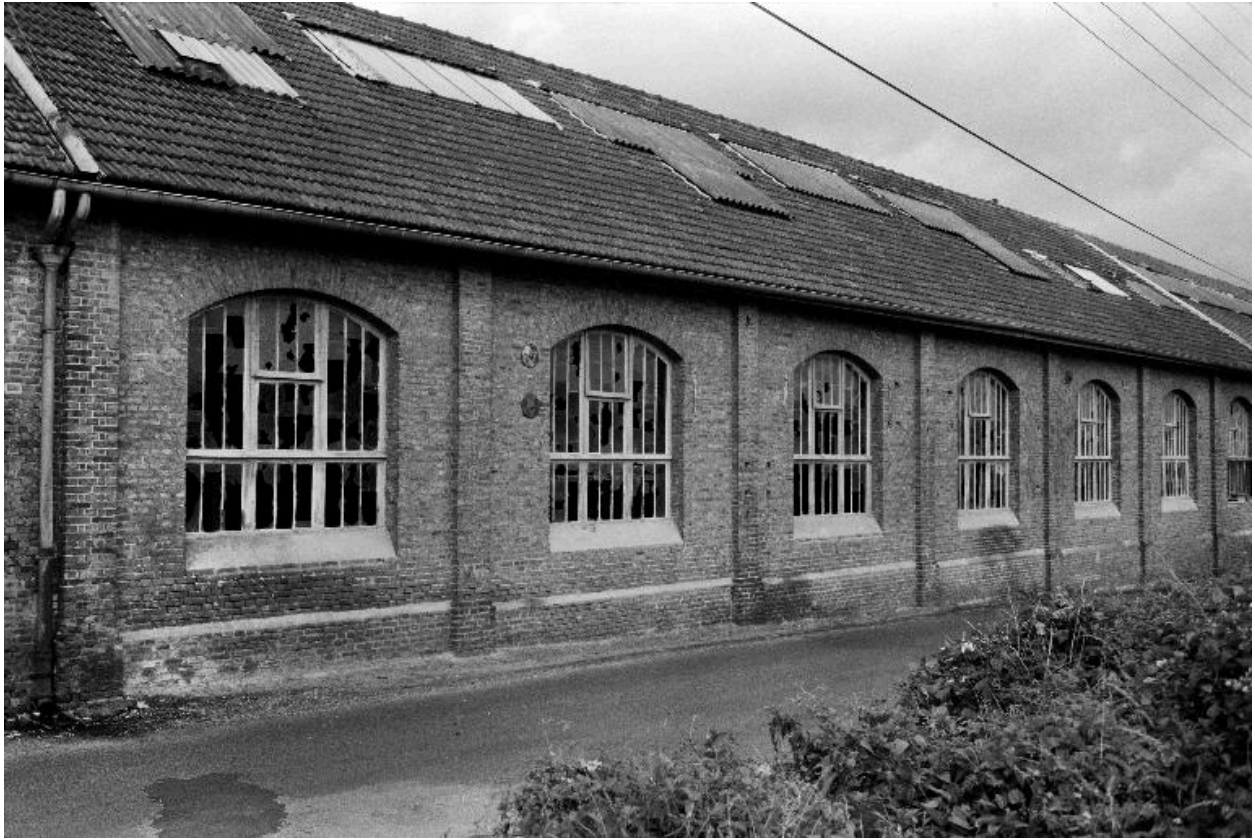
Atelier de fabrication, vue partielle, flanc est.