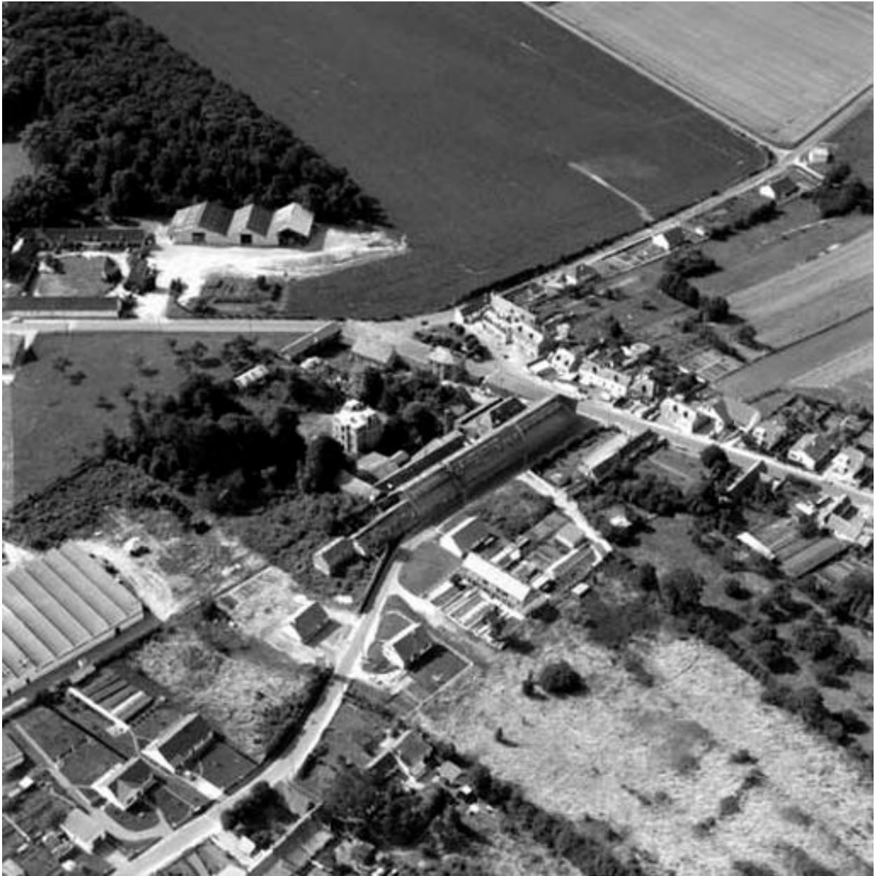
Vue aérienne, flanc sud-est.