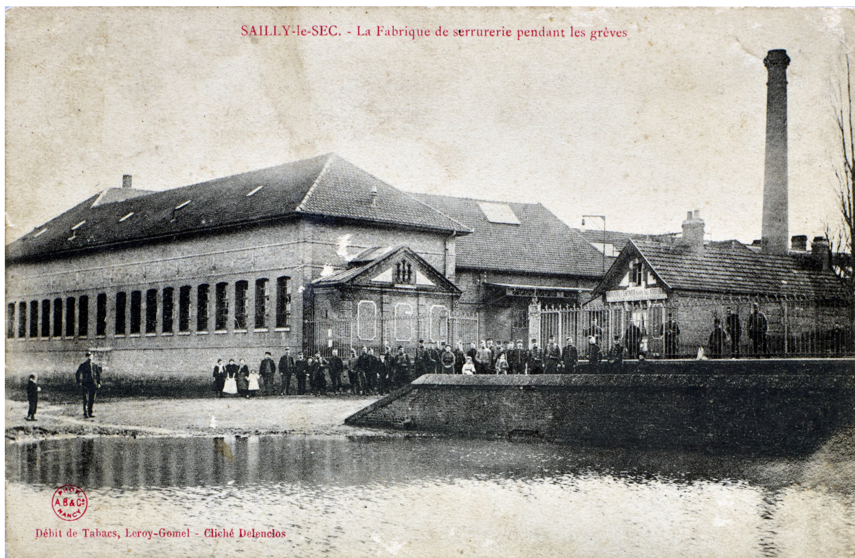
La fabrique de serrurerie pendant les grèves, carte postale.