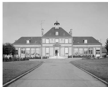
Elévation antérieure. IVR22_19846001324V