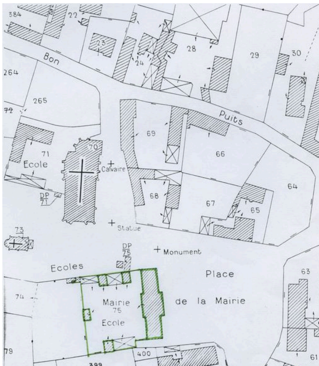
Plan de situation. Extrait du plan cadastral de 1982, section AD 75.