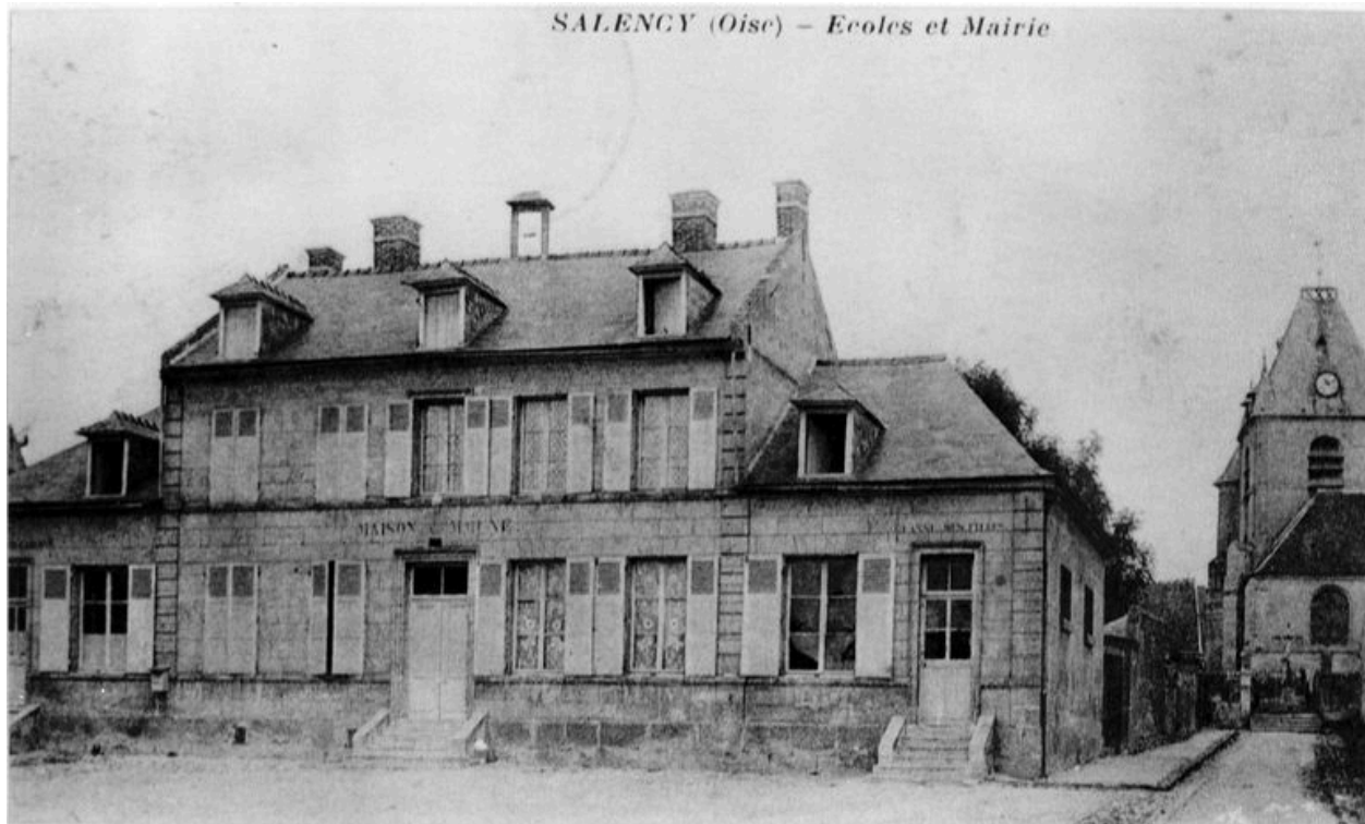
L'ancienne mairie.