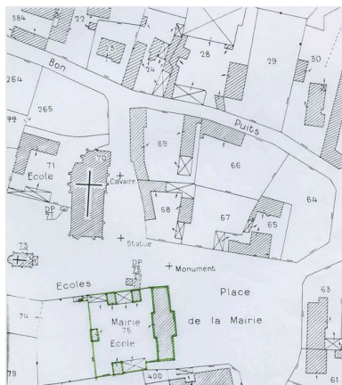
Plan de situation. Extrait du plan cadastral de 1982, section AD 75.