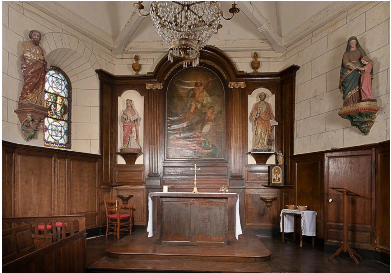
Vue générale du chœur.