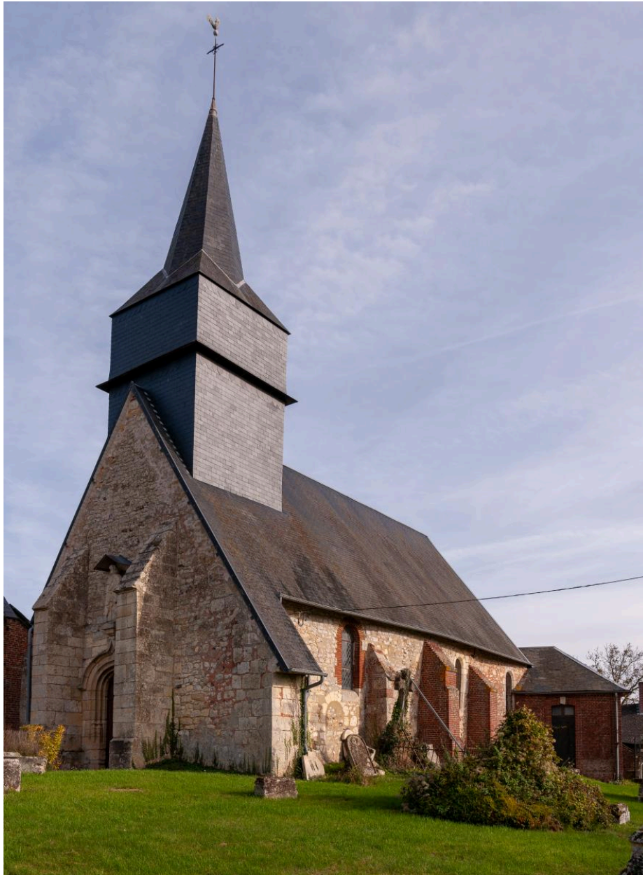
Vue de l'église depuis le nord-ouest.