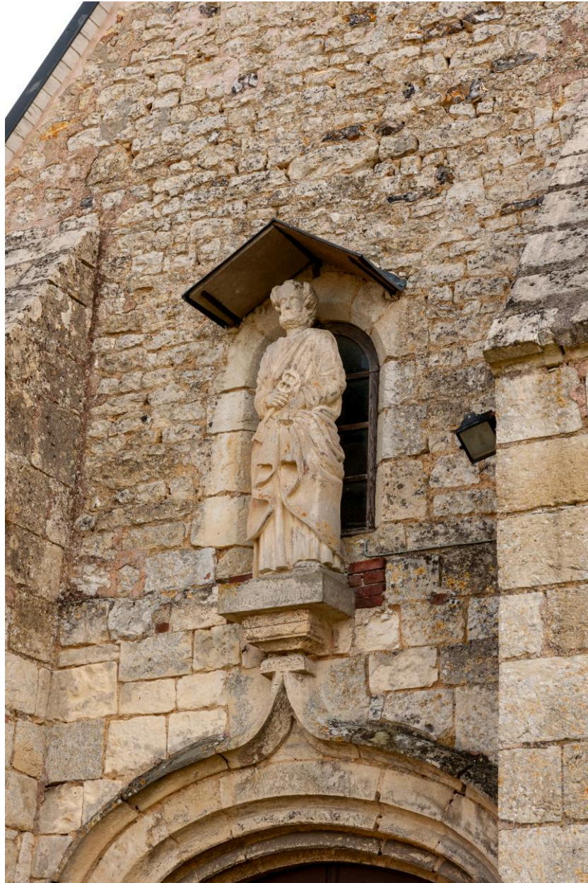
Statue de saint Pierre au-dessus du portail principal.