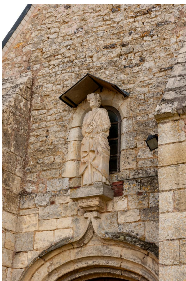
Statue de saint Pierre au- dessus du portail principal.