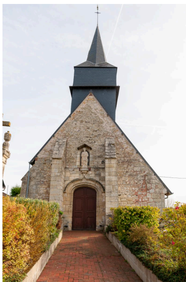
Façade de l'église, vue depuis le nord-ouest.