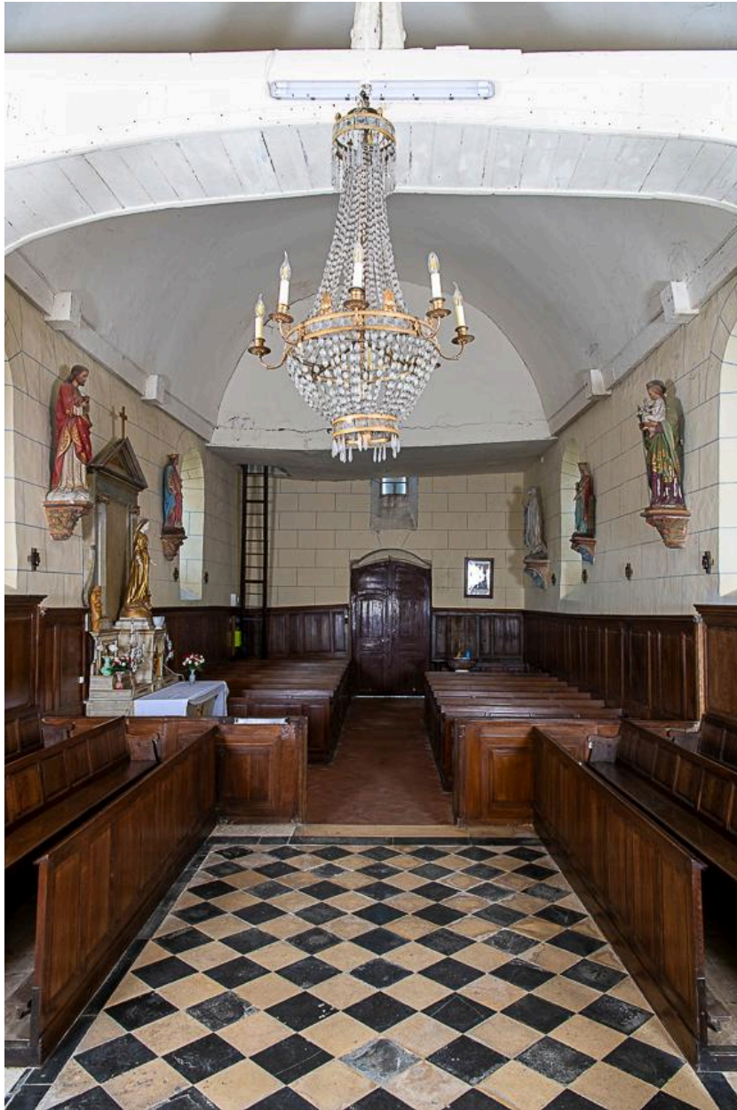
Vue vers la nef.