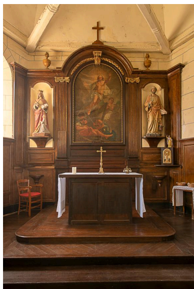
Vue de l'ensemble du maître-autel.