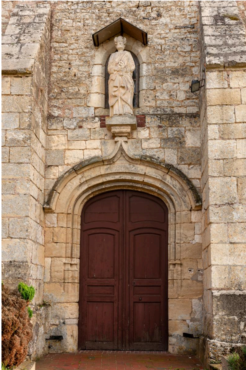
Portail d'entrée surmonté de la statue de saint Pierre.