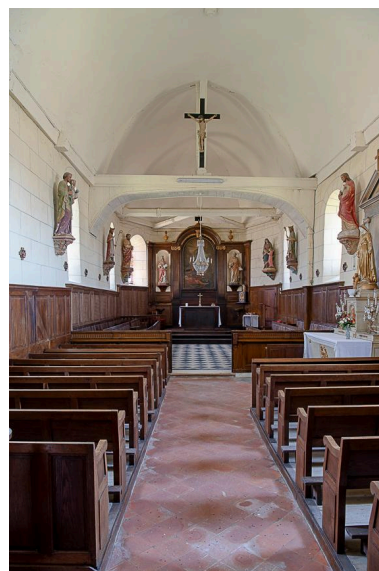
Vue vers le chœur.