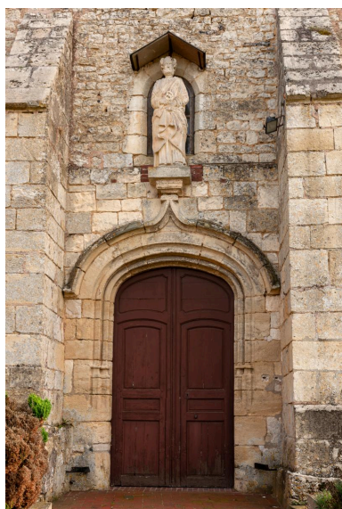
Portail d'entrée surmonté de la statue de saint Pierre.