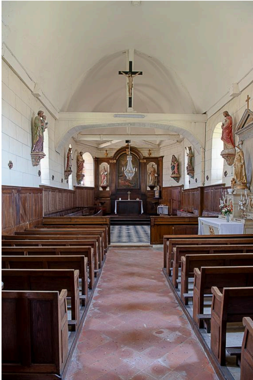
Vue vers le chœur.