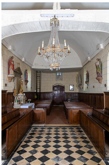
Vue vers la nef. IVR32_20226000225NUCA