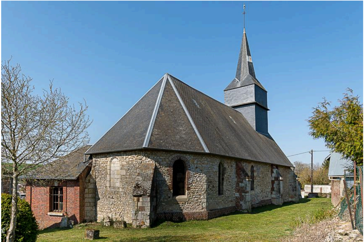
Vue générale depuis le sud-est.