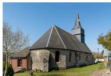
Vue générale depuis le sud-est.