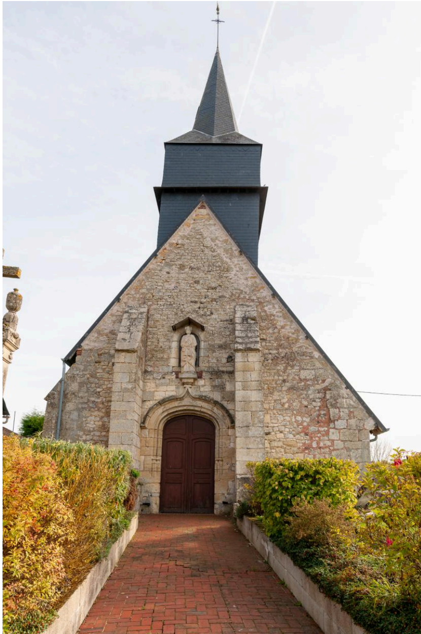
Façade de l'église, vue depuis le nord-ouest.