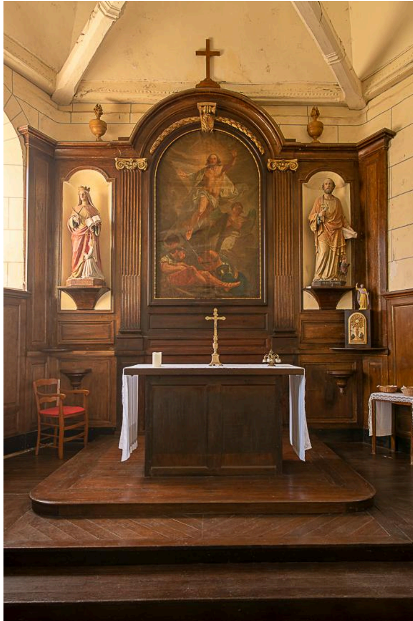
Vue de l'ensemble du maître-autel.