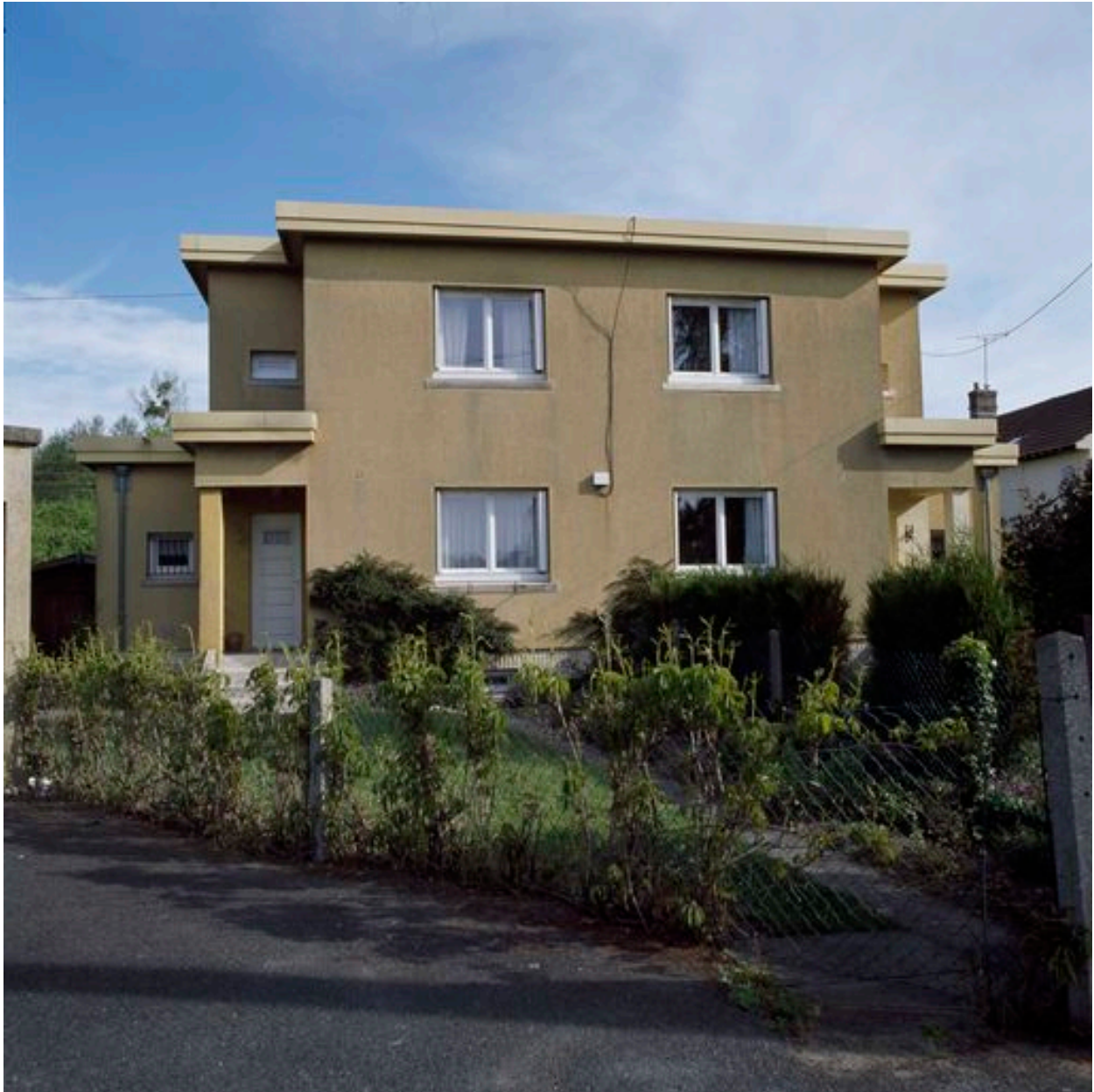
Maison à deux unités d'habitation.