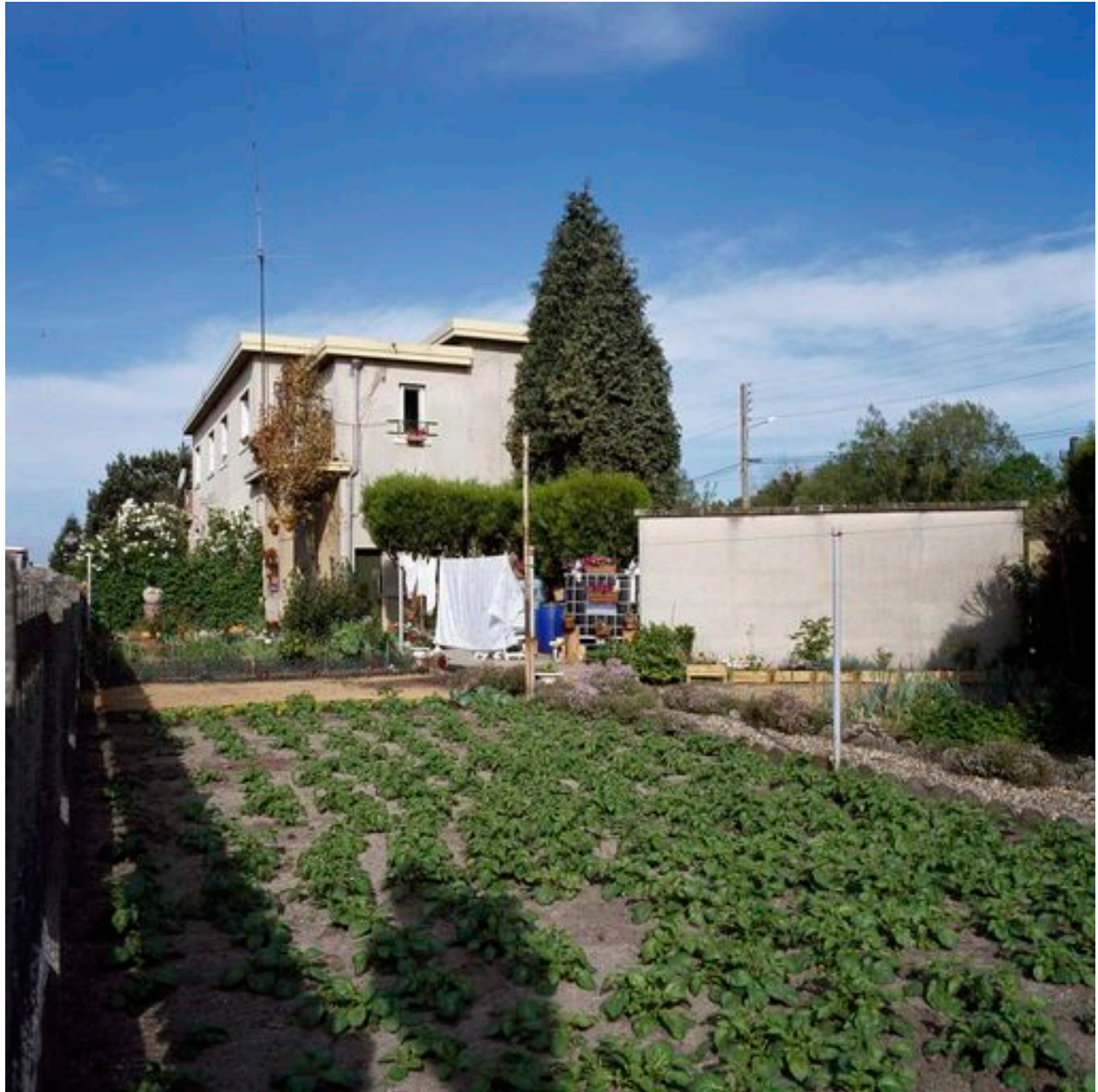
Jardin entourant les maisons de la cité-jardin.