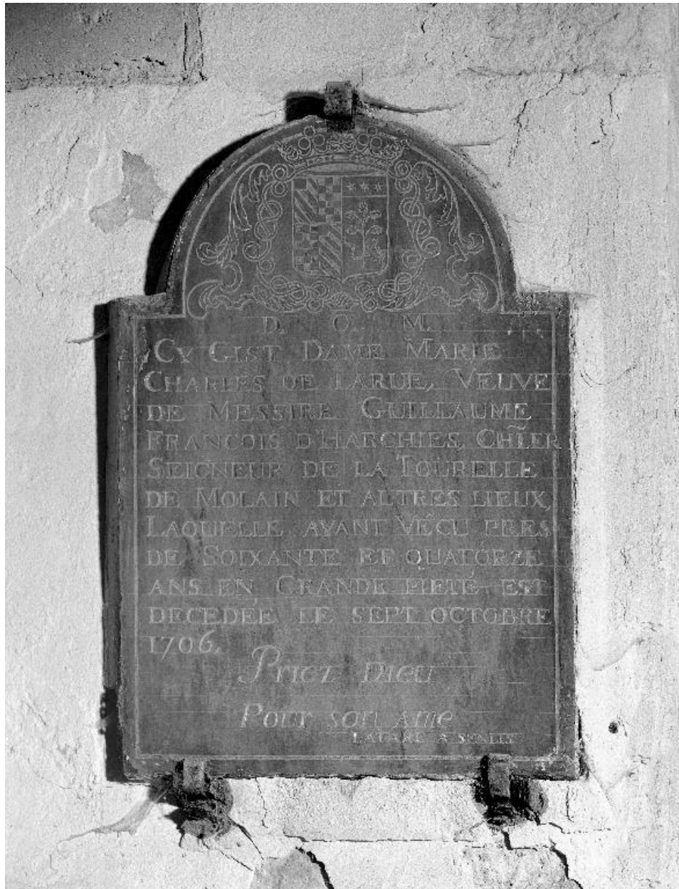
Vue générale de la plaque funéraire.