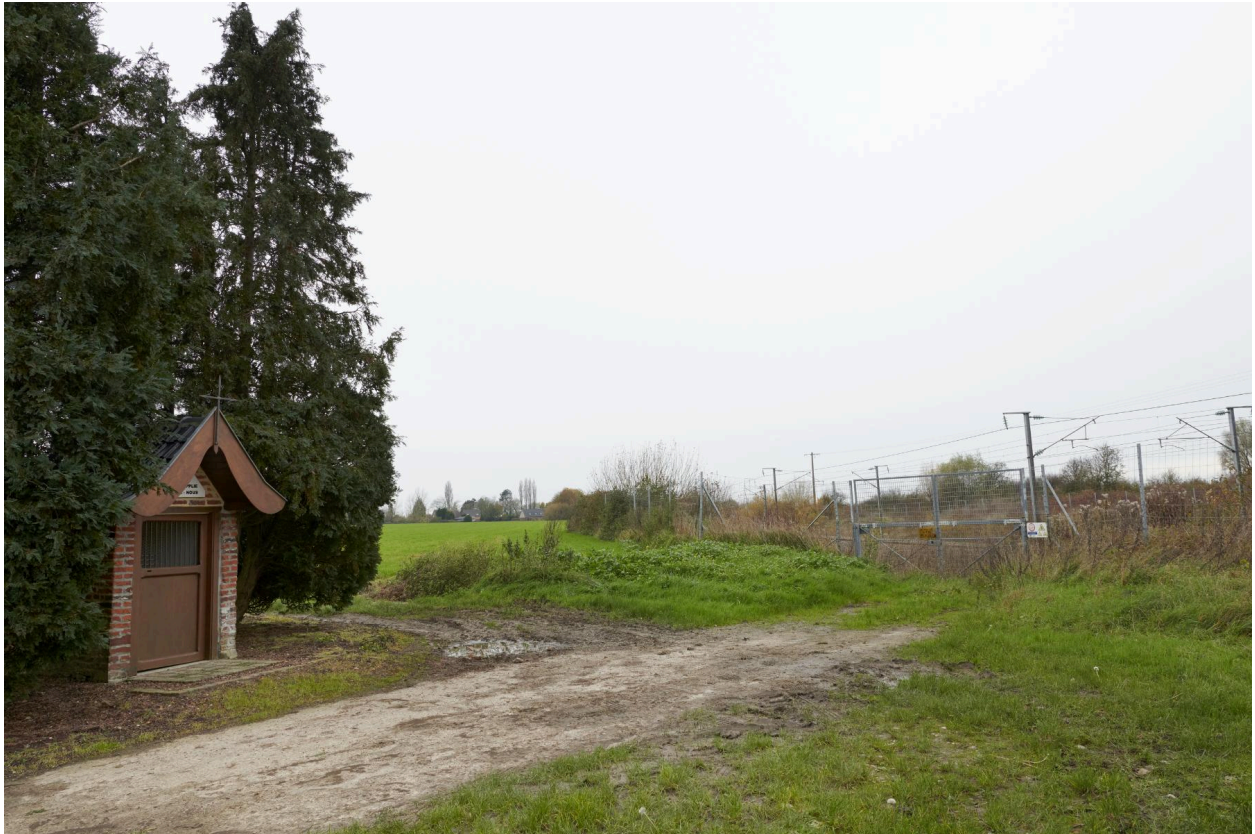
La chapelle dans son environnement direct, en bordure de voies ferrées.