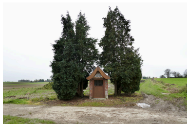
La chapelle dans son contexte. IVR32_20245902617NUCA