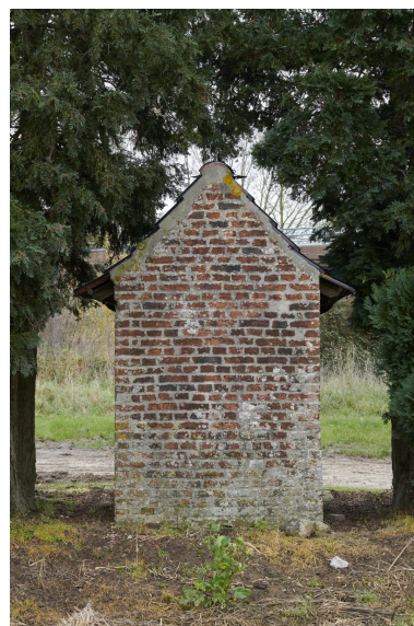
Détail de l'arrière de la chapelle. IVR32_20245902622NUCA