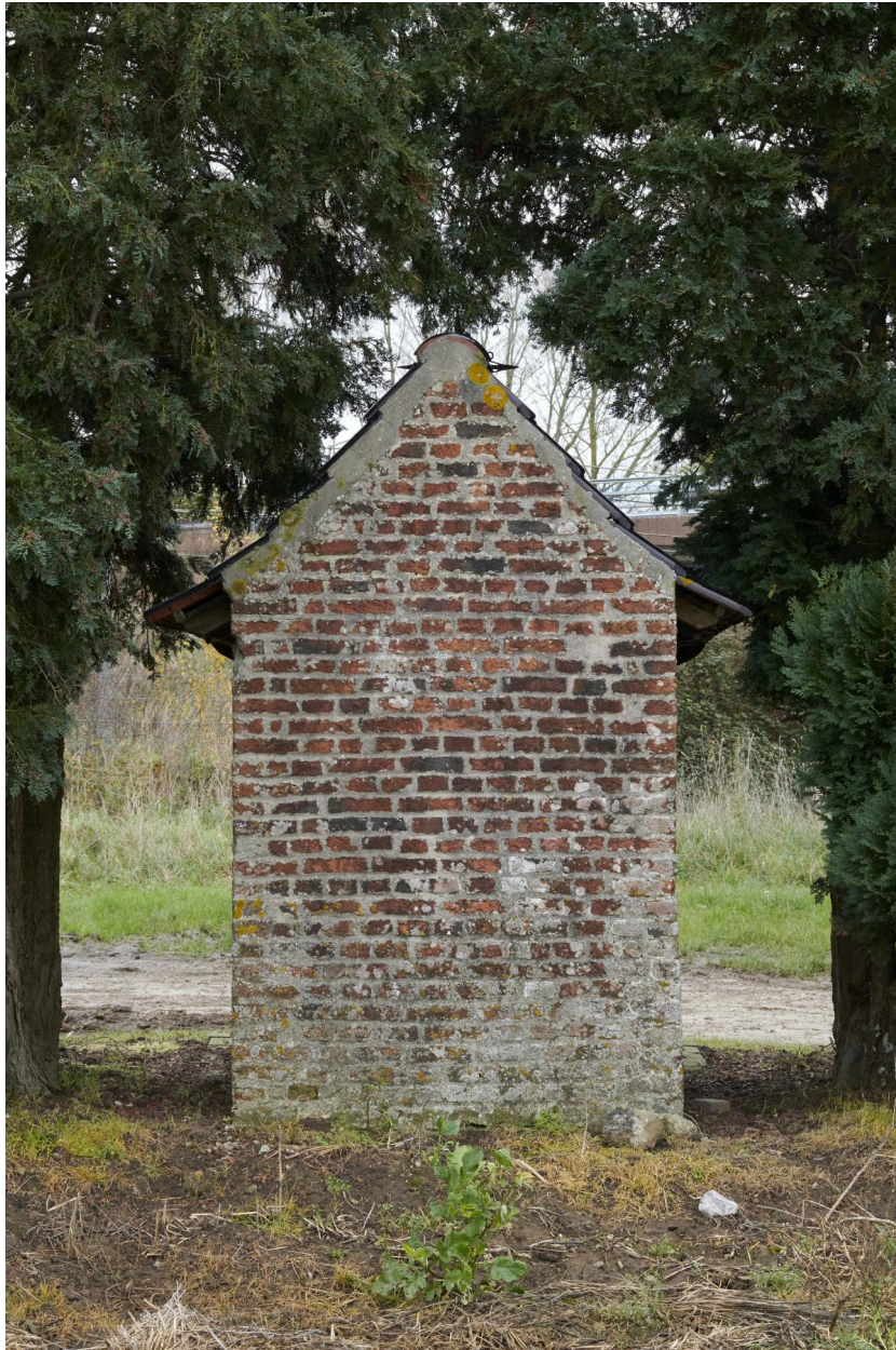
Détail de l'arrière de la chapelle.