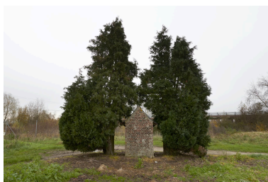
Vue arrière. IVR32_20245902621NUCA