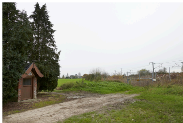
La chapelle dans son environnement direct, en bordure de voies ferrées.