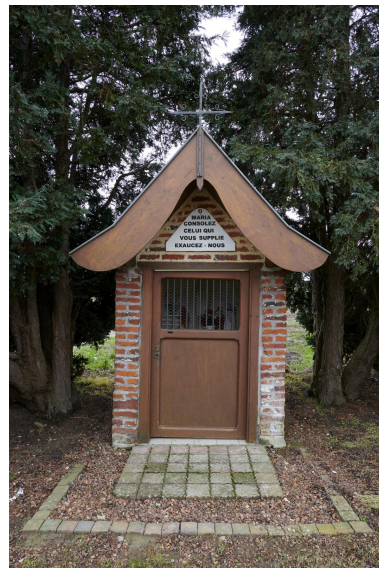
Façade principale. IVR32_20245902619NUCA