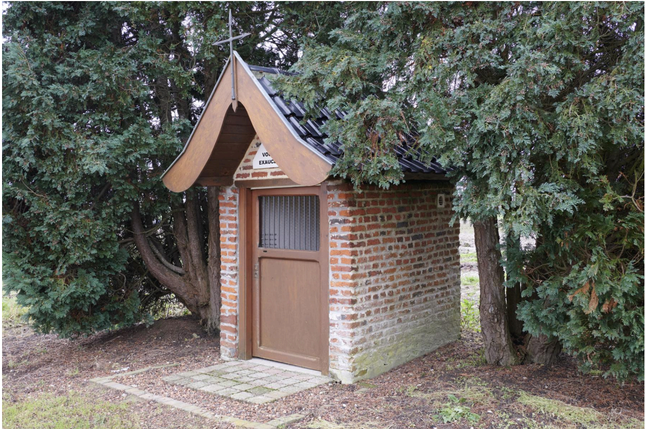
Détail façade et côté droit.