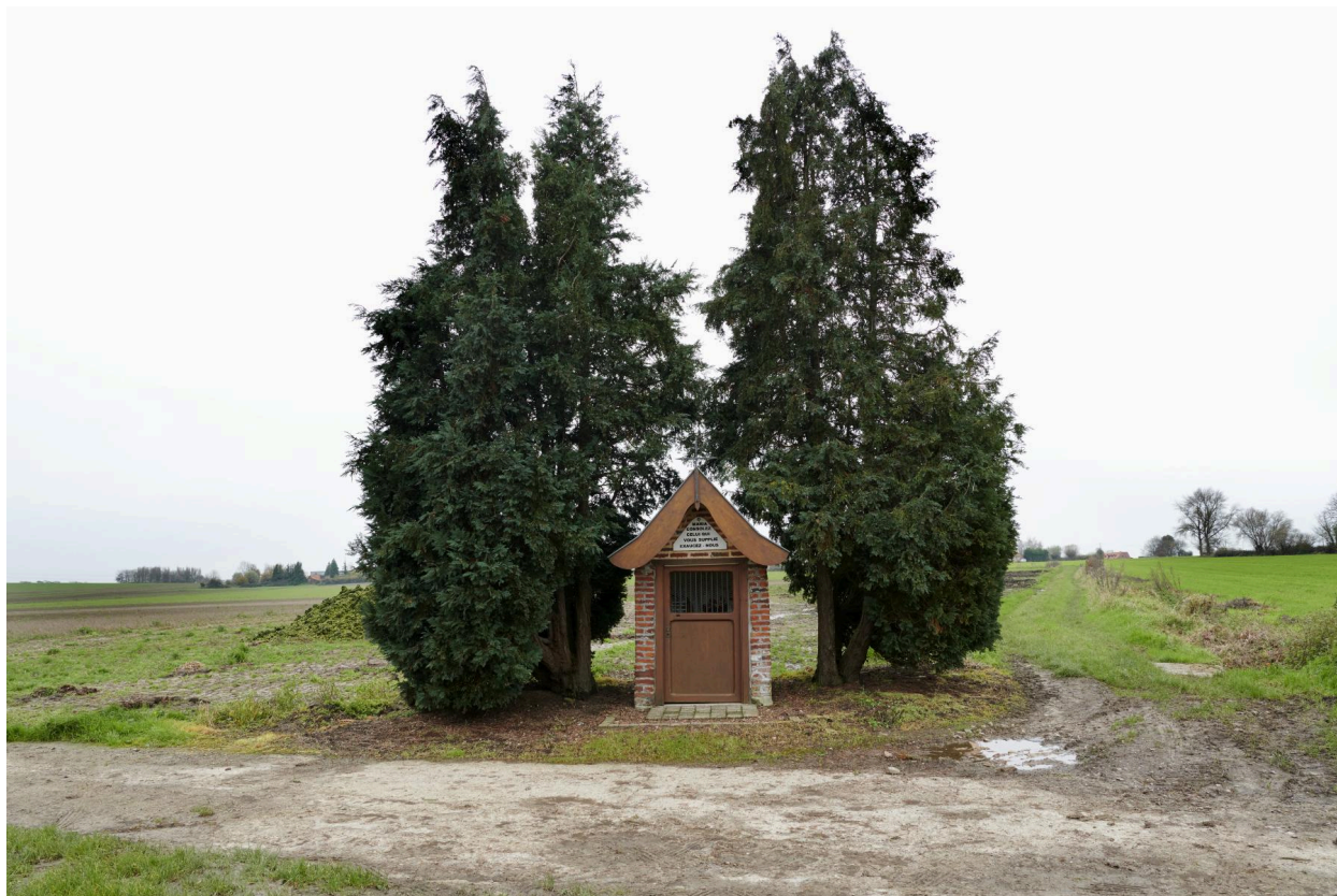
La chapelle dans son contexte.