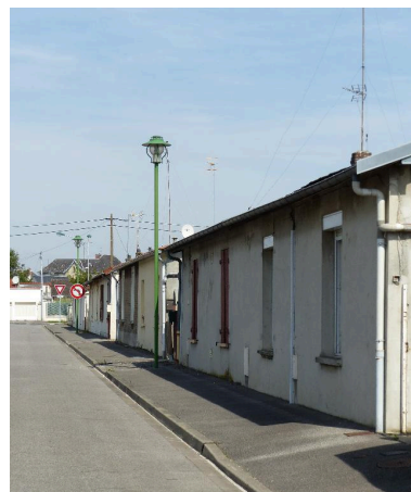
Maisons, rue d'Angleterre.