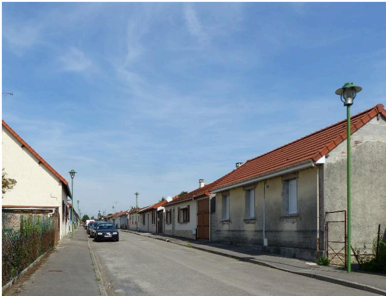
Rue de Belgique, vue depuis le sud.