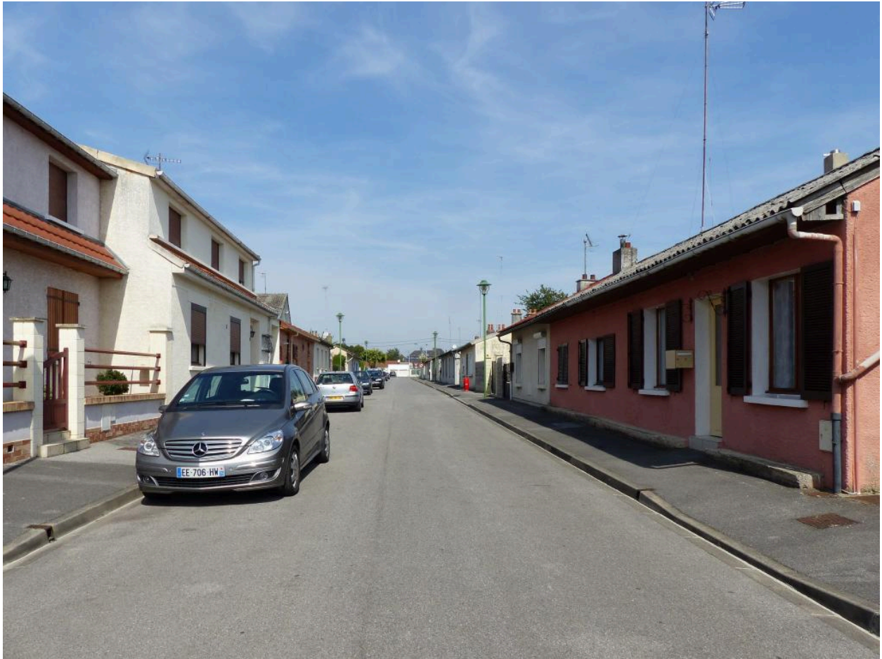
La rue d'Angleterre, vue depuis le sud.