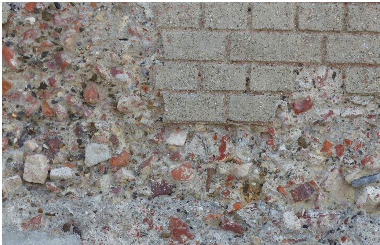
Maison, rue d'Angleterre. Détail de la mise en oeuvre.