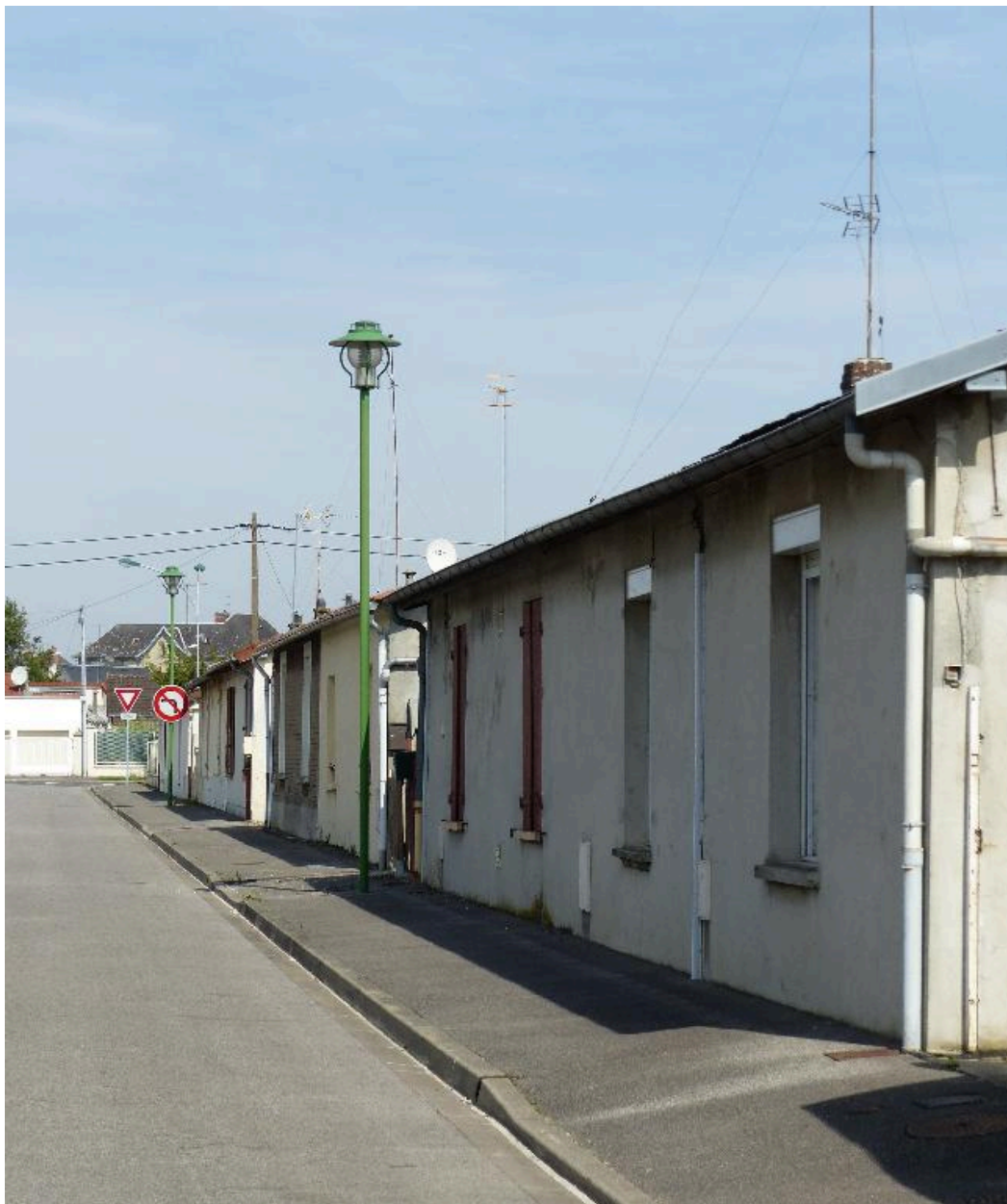
Maisons, rue d'Angleterre.