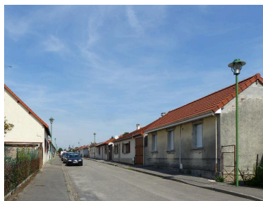
Rue de Belgique, vue depuis le sud.