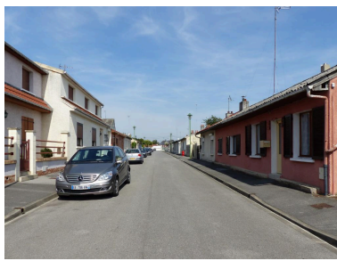
La rue d'Angleterre, vue depuis le sud.