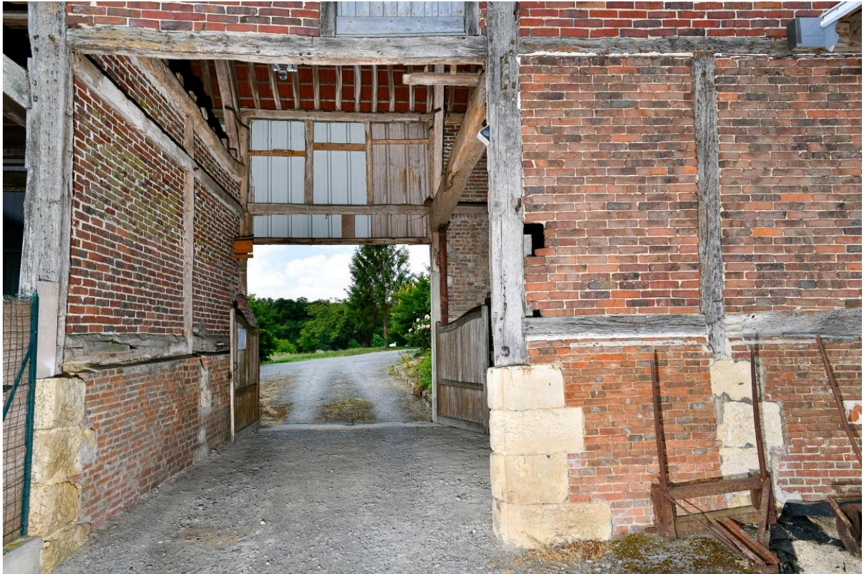
Vue de l'entrée charretière depuis la cour.