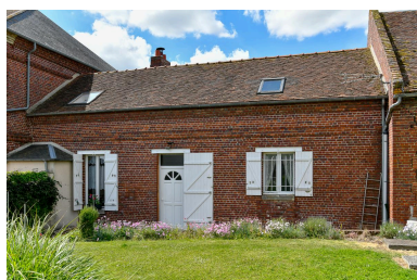
Logis des domestiques de ferme, vue depuis le nord. IVR32_20226000464NUCA