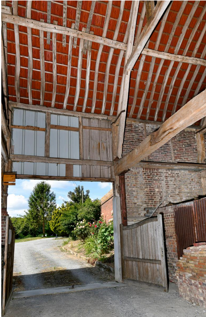
Intérieur du passage charretier, vue vers l'extérieur.