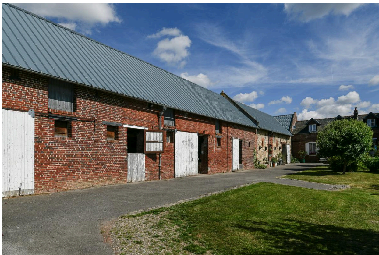
Vue générale des anciennes étables et anciennes écuries depuis le sud-est.