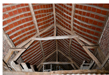
Charpente du passage charretier. IVR32_20226000459NUCA