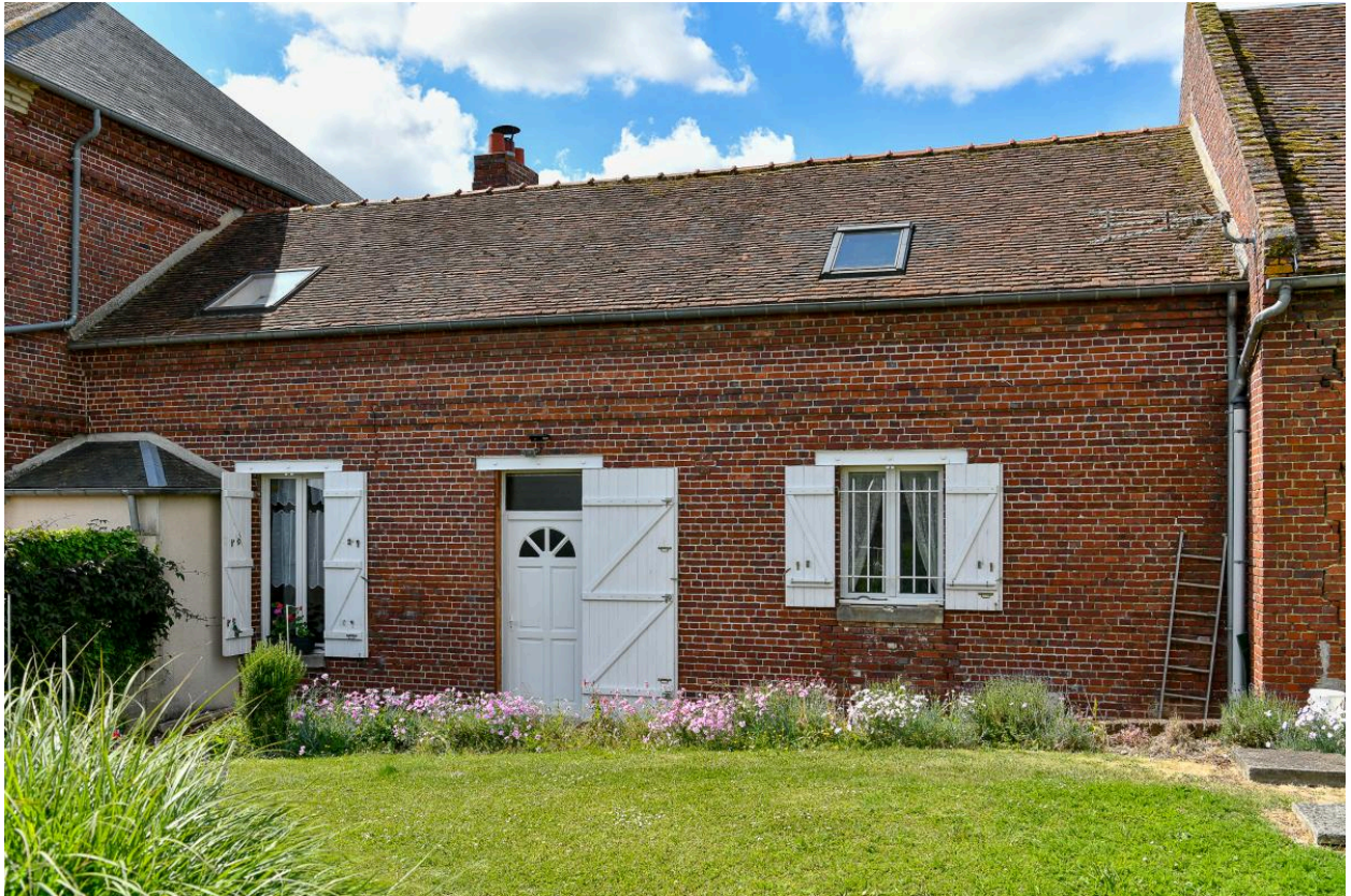
Logis des domestiques de ferme, vue depuis le nord.