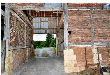
Vue de l'entrée charretière depuis la cour.