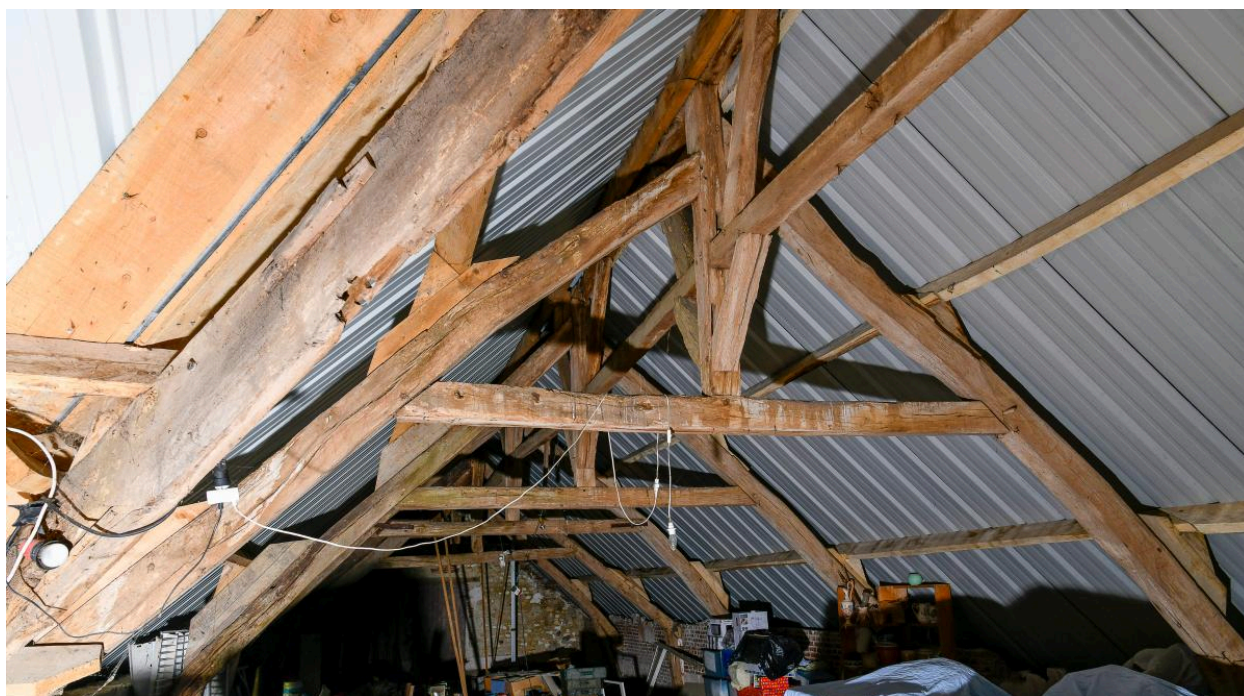
Charpente de l'ancienne écurie.