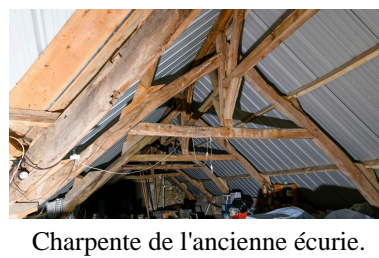
Charpente de l'ancienne écurie.