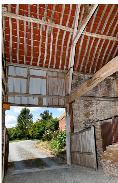
Intérieur du passage charretier, vue vers l'extérieur.