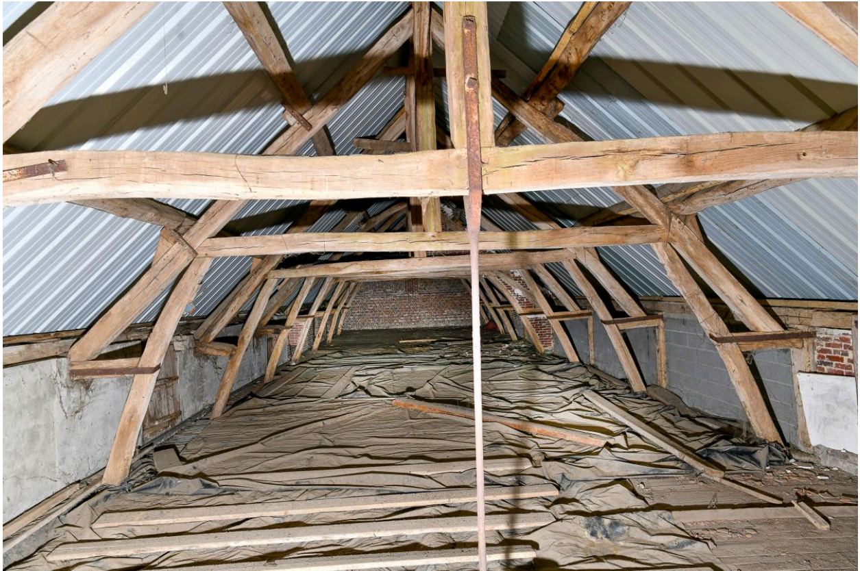
Charpente de l'étable à vaches.