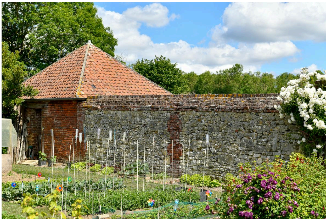
Mur de clôture et fruitier, vue depuis le sud-est.