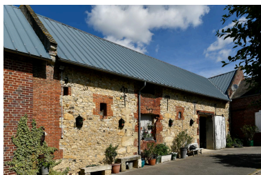
Vue des anciennes écuries depuis le sud-est.