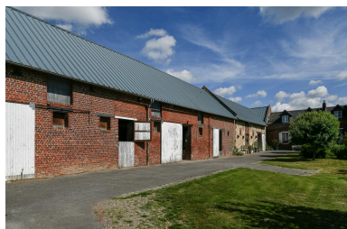
Vue générale des anciennes étables et anciennes écuries depuis le sud-est. IVR32_20226000456NUCA