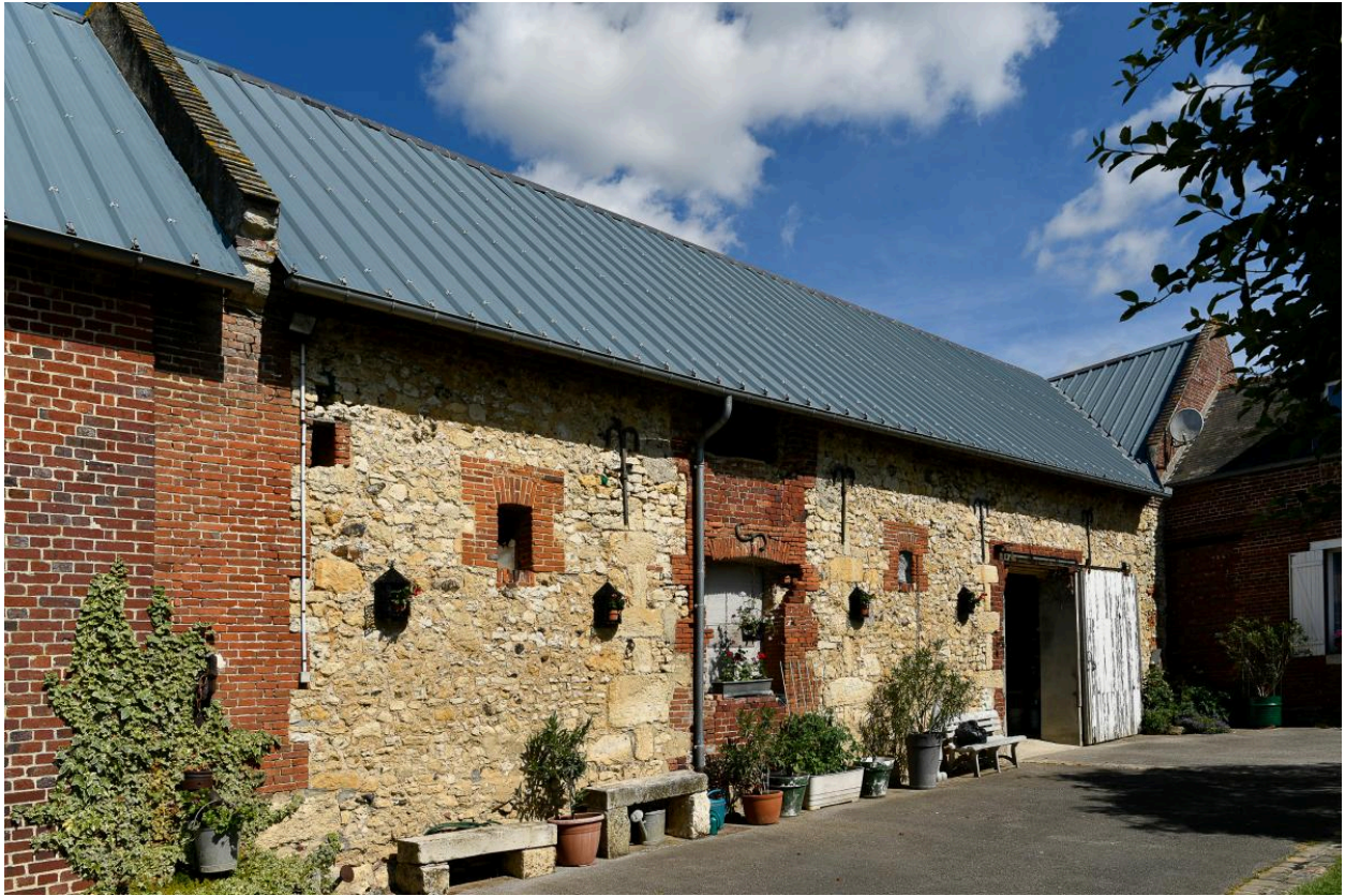
Vue des anciennes écuries depuis le sud-est.