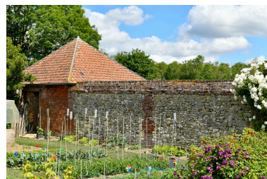
Mur de clôture et fruitier, vue depuis le sud-est. IVR32_20226000465NUCA