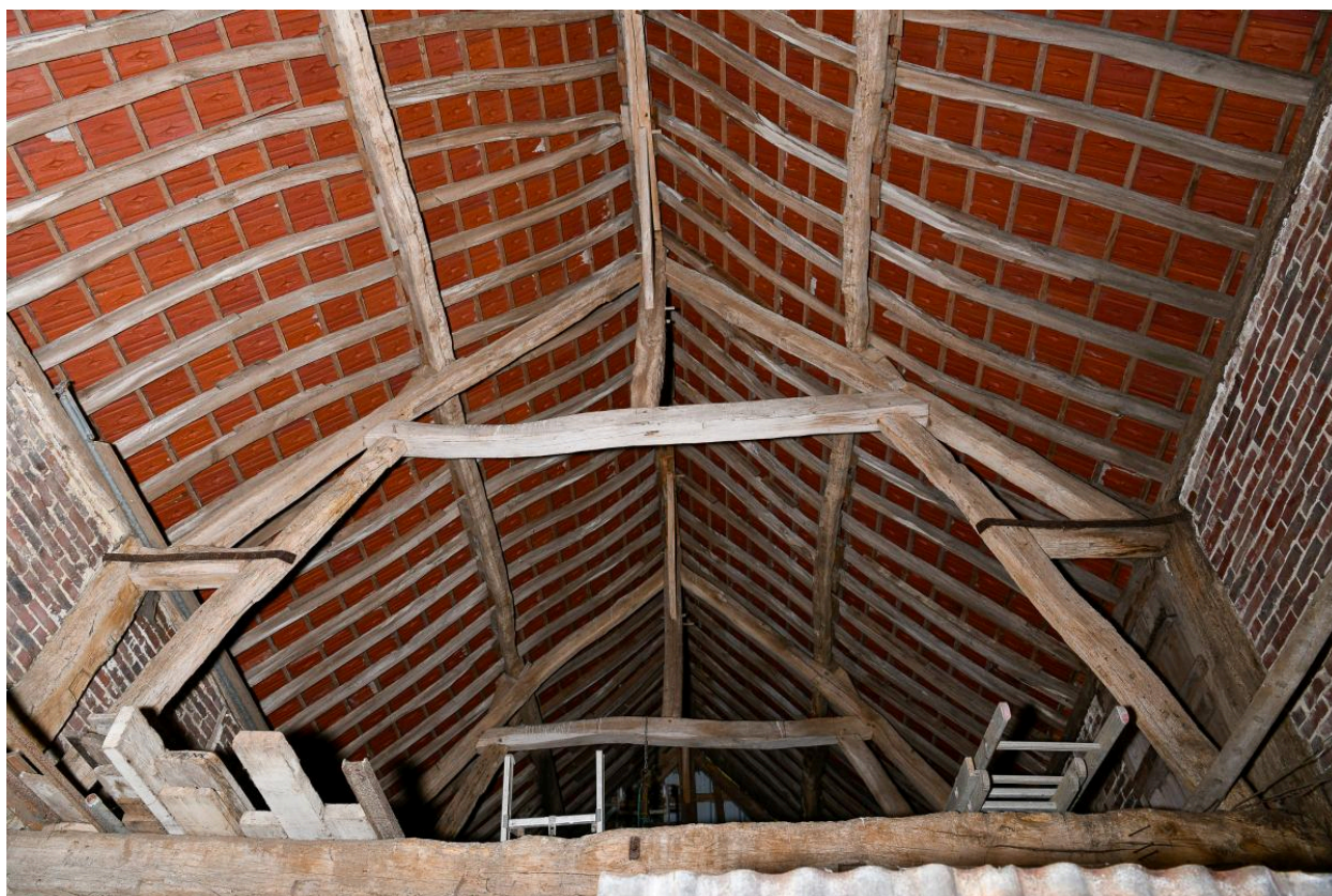
Charpente du passage charretier.