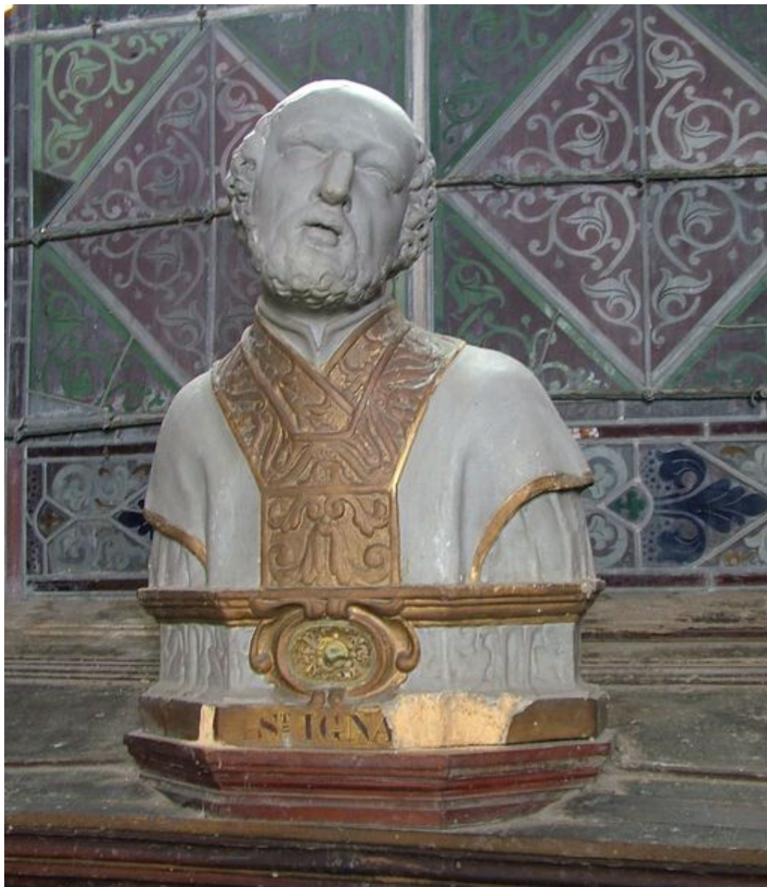
Buste reliquaire de saint Ignace de Loyola.