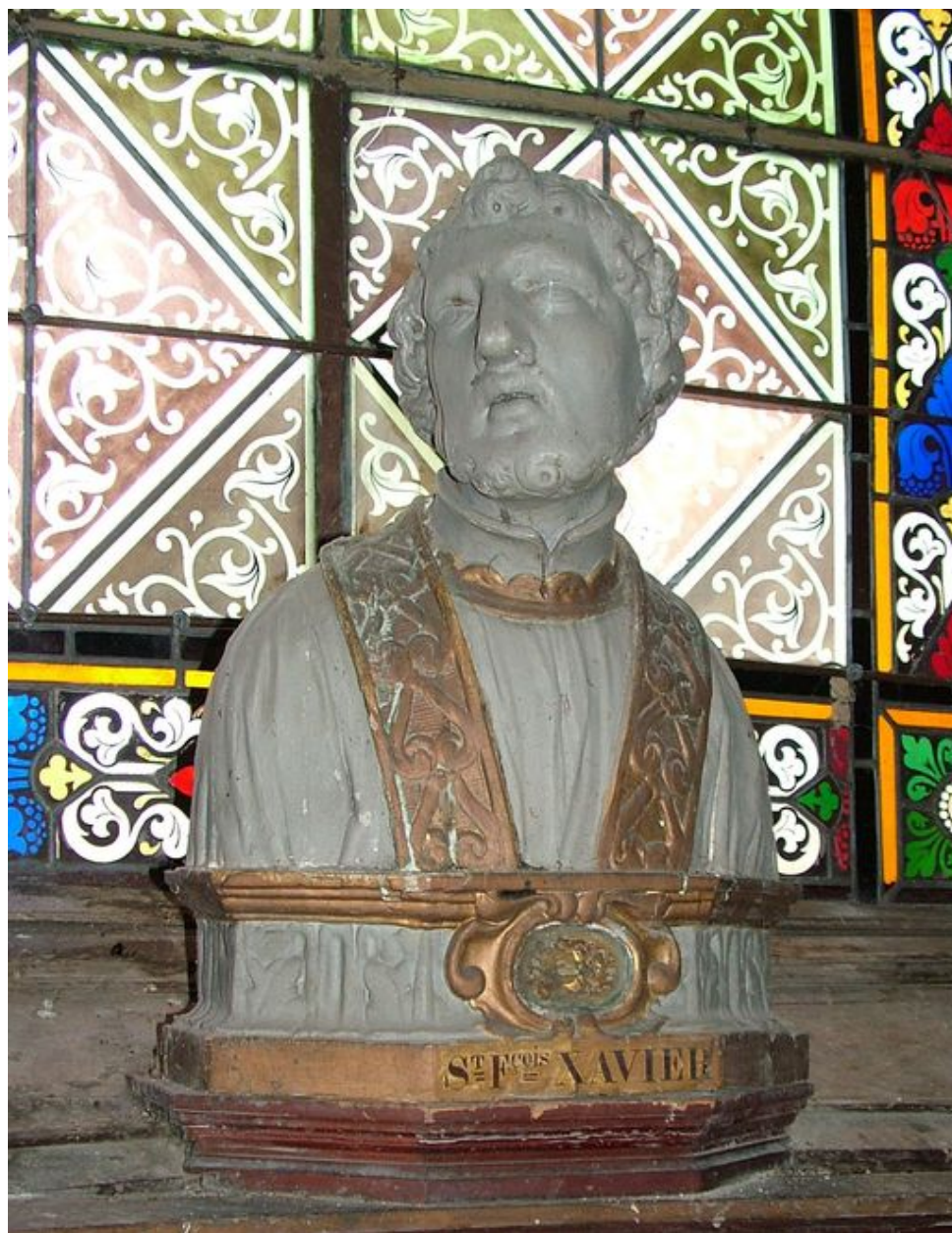
Buste-reliquaire de saint François Xavier.