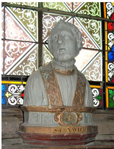
Buste-reliquaire de saint François Xavier.