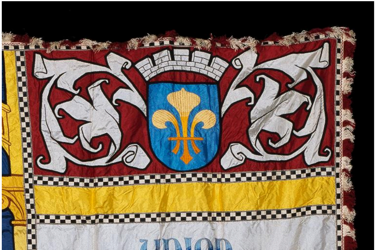
Détail du décor : les armoiries de la ville de Soissons.