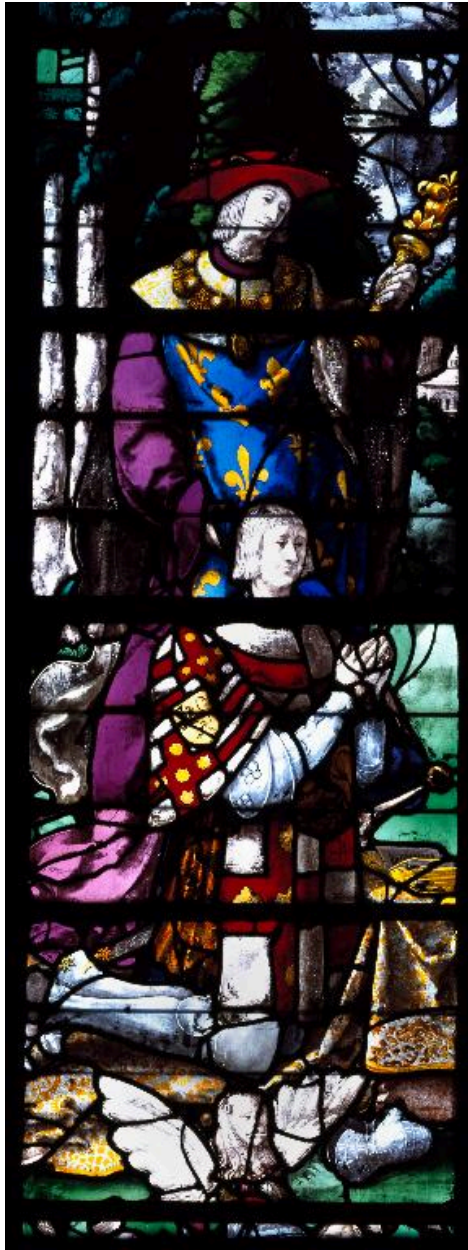
Vue du registre inférieur de la lancette gauche : Louis de Roncherolles présenté par saint Louis.