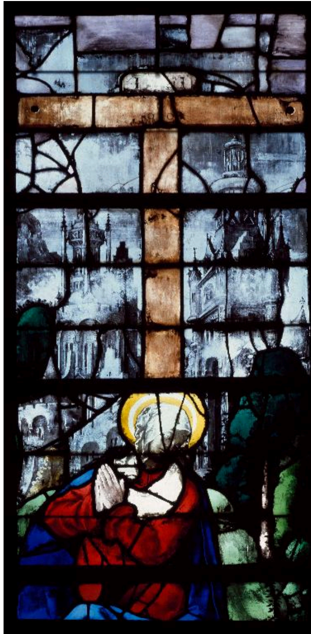
Vue de détail, registre inférieur de la lancette centrale : la Vierge de Pitié.