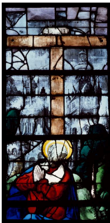
Vue de détail, registre inférieur de la lancette centrale : la Vierge de Pitié. IVR22_19976000462XA