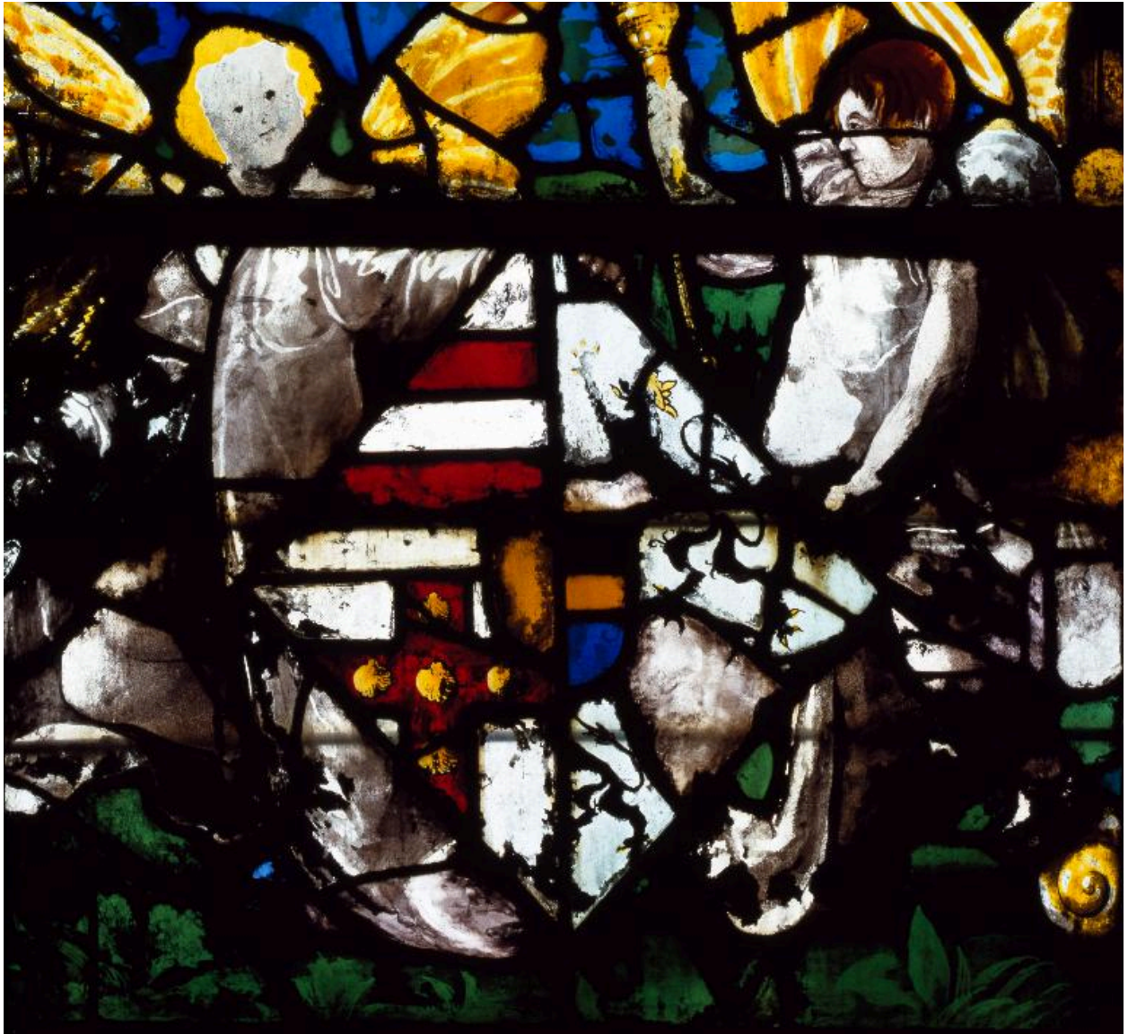
Vue de détail, registre inférieur de la lancette droite : armoiries.