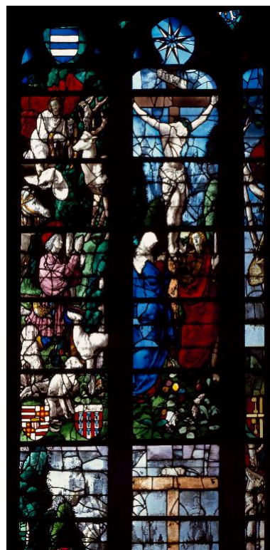
Vue du registre supérieur de la lancette gauche et de la lancette centrale : saint Hubert et le Calvaire. IVR22_19976000464XA