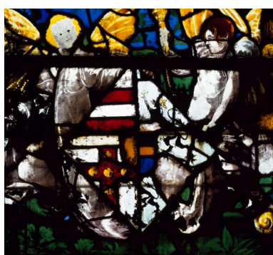
Vue de détail, registre inférieur de la lancette droite : armoiries. IVR22_19976000460XA