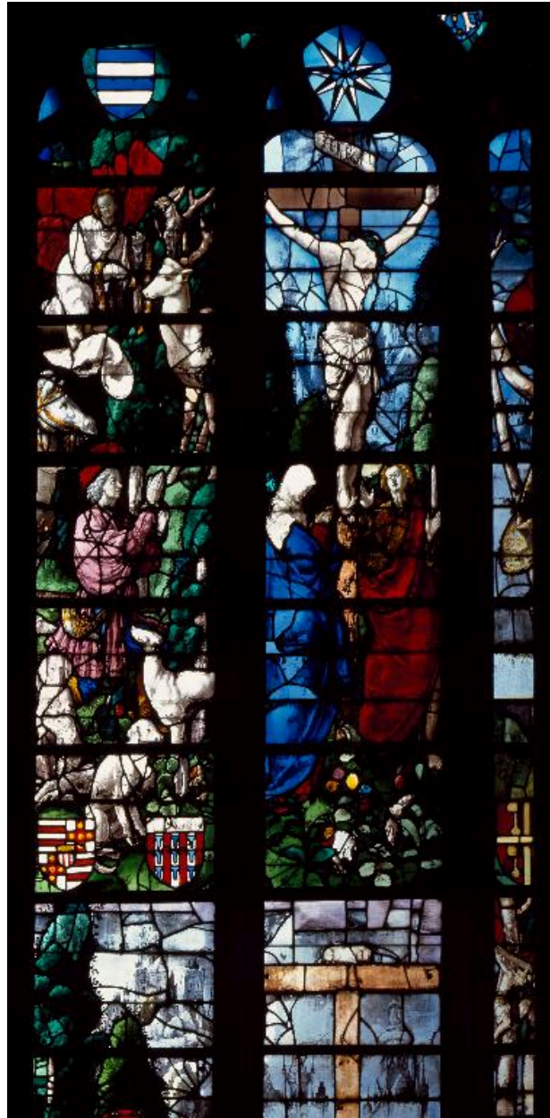
Vue du registre supérieur de la lancette gauche et de la lancette centrale : saint Hubert et le Calvaire.