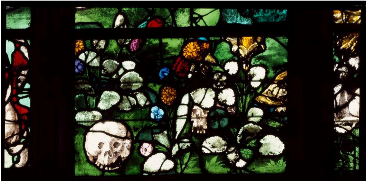
Vue de détail de la lancette centrale : deux crânes parmi les fleurs.