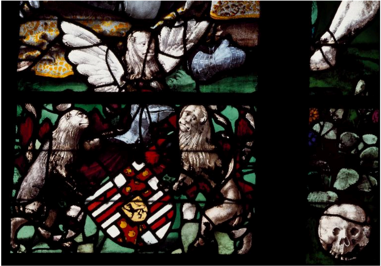
Détail des armoiries de Louis de Roncherolles.