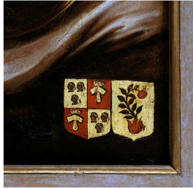
Détail des armoiries dans l'angle inférieur droit du tableau. IVR22_19966003847XA