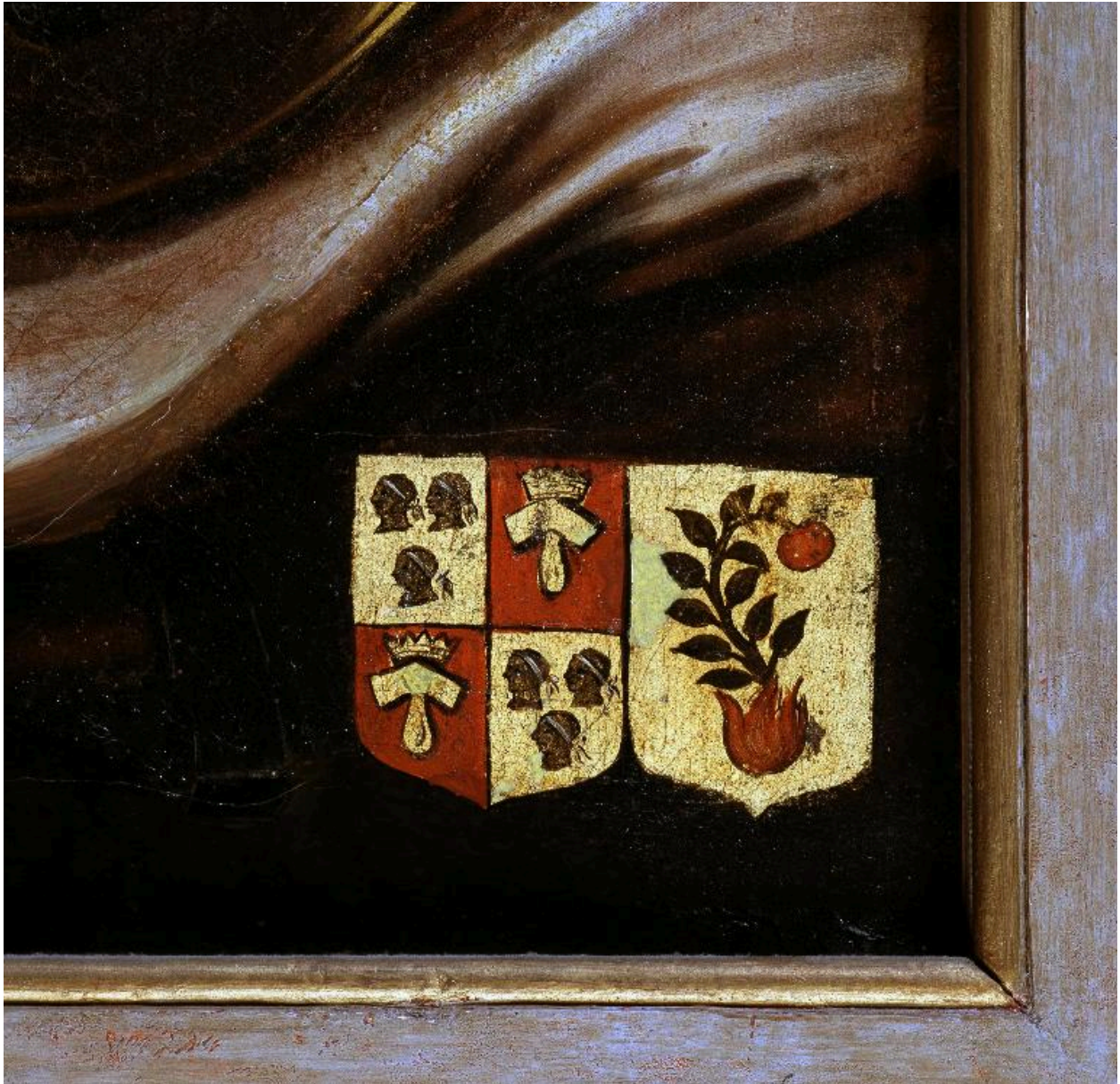
Détail des armoiries dans l'angle inférieur droit du tableau.