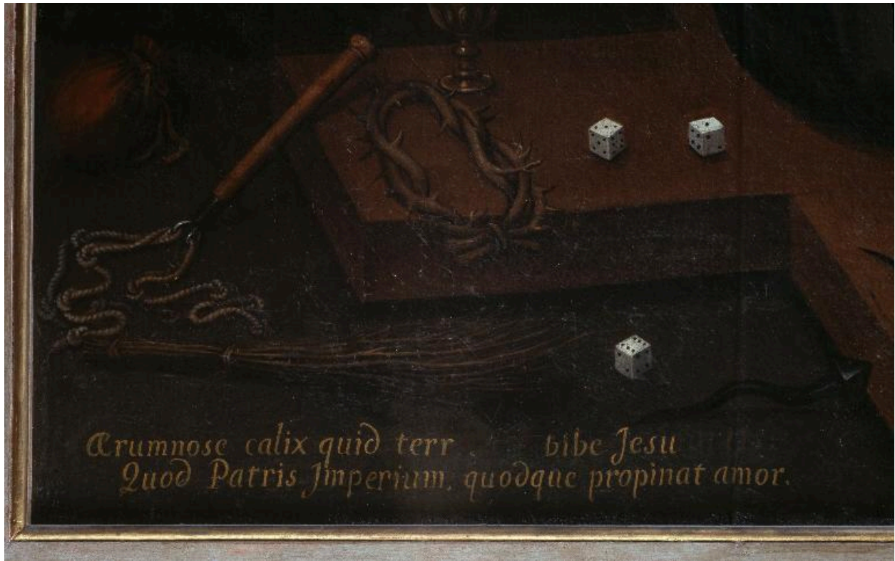
Détail de l'inscription au bas du tableau.