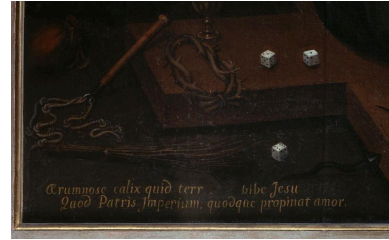
Détail de l'inscription au bas du tableau.