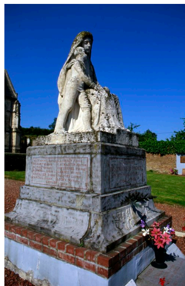
Vue de trois-quarts.

IVR22_19948000522ZA