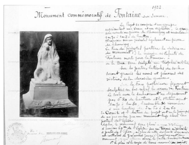
Mémoire explicatif d'Albert Roze, 1922 (AD Somme).

IVR22_20118005013NUCA