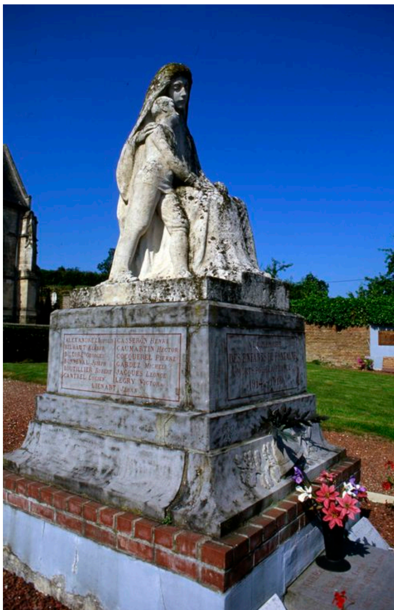
Vue de trois-quarts.