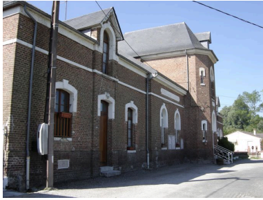
Vue sur l'aile sud. IVR22_20058001580NUCA

Vue générale. IVR22_20058001579NUCA