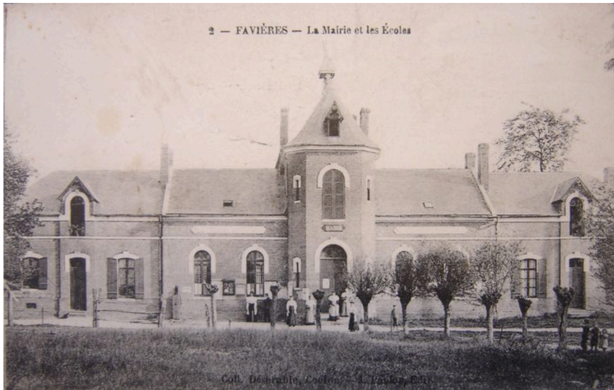
Vue de la mairie école au début du 20e siècle.