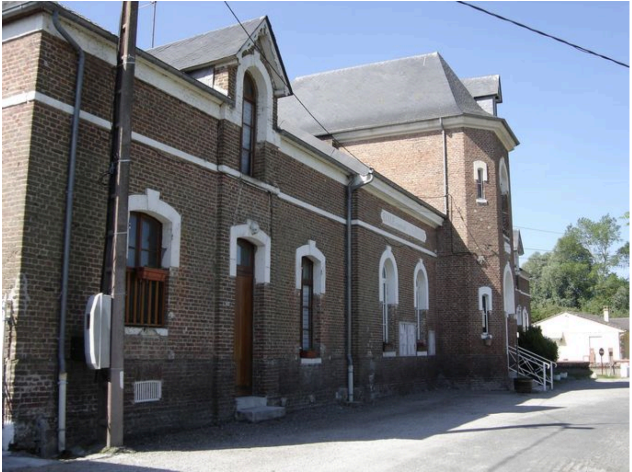
Vue sur l'aile sud.