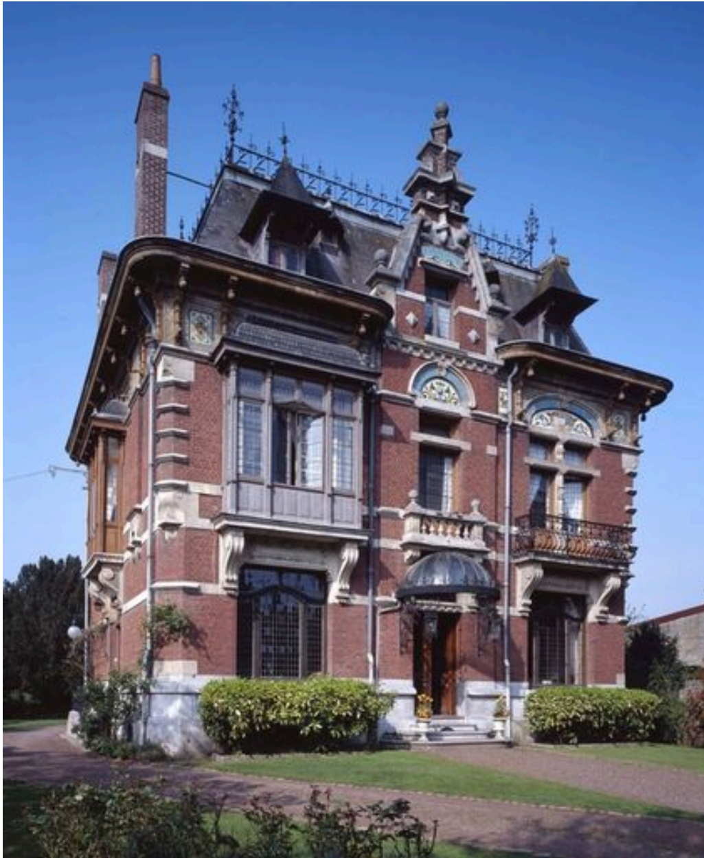
Elévation antérieure de la maison Lespagnol.