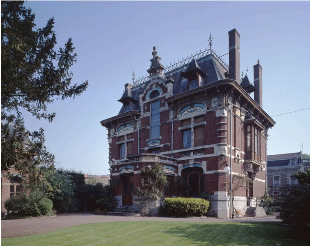
Elévation postérieure de la maison Lespagnol.