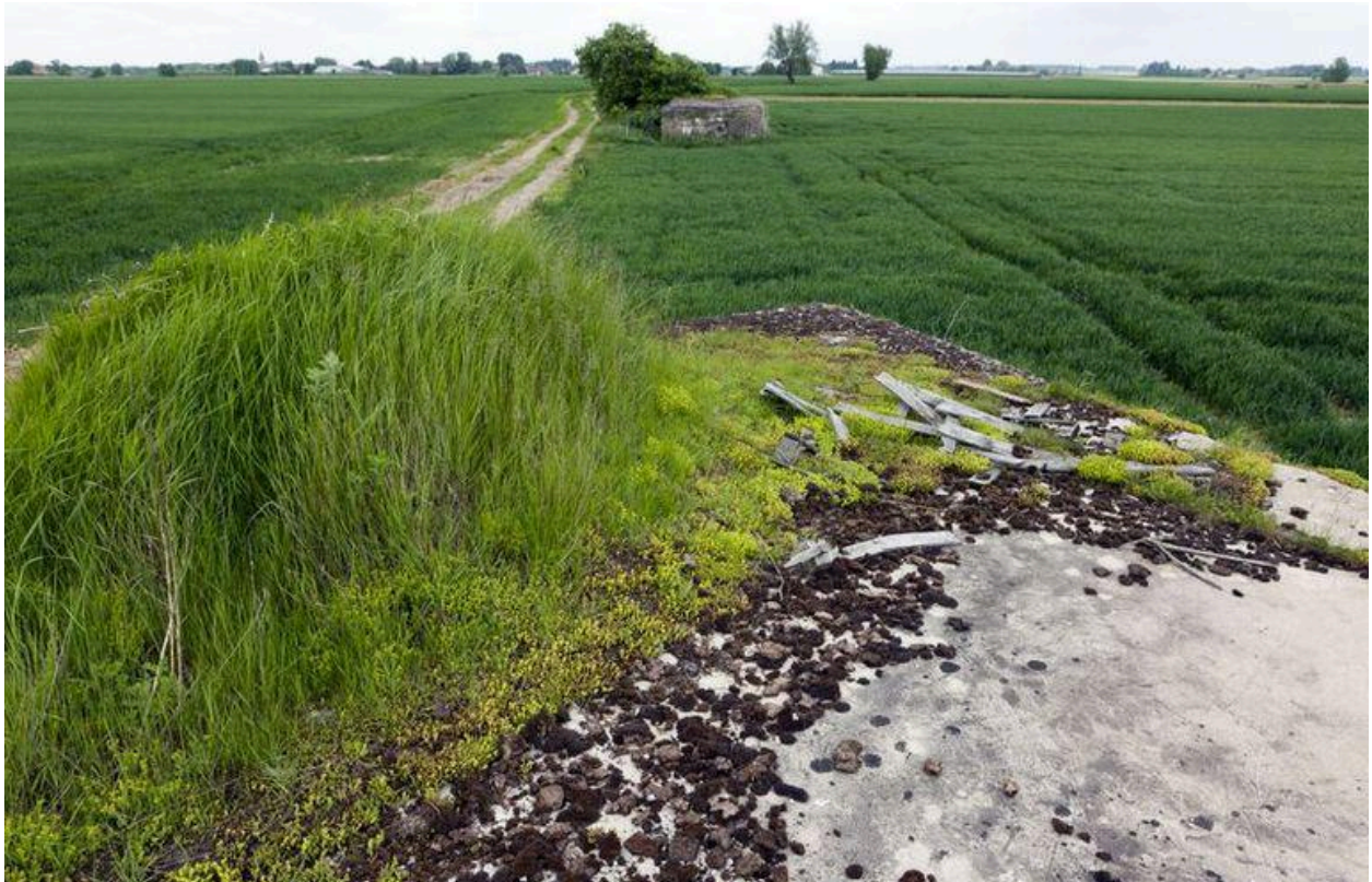
Vue des deux blockhaus d'artillerie en enfilade (IA59004814 au fond)