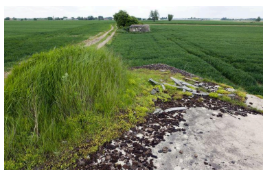
Vue des deux blockhaus d'artillerie en enfilade (IA59004814 au fond) IVR31_20145904340NUCA