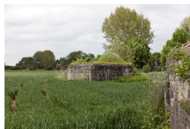
Vue des deux blockhaus d'artillerie (IA59004812 au fond). IVR31_20145904330NUCA