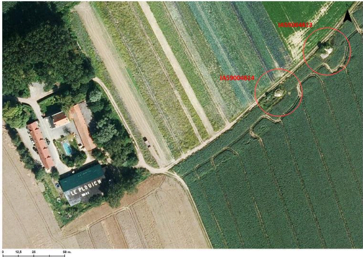
Situation des deux casemates d'artillerie sur une photo aérienne de 2014