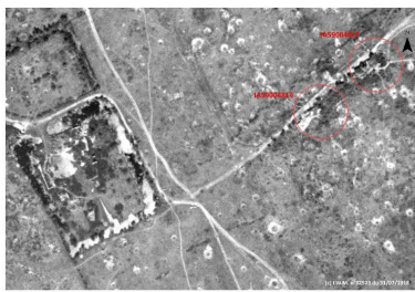
Situation des deux casemates d'artillerie sur une photo britannique du 31/07/1917.