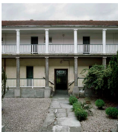
Bâtiment 520 : Elévation intérieure. IVR22_20106000431XA