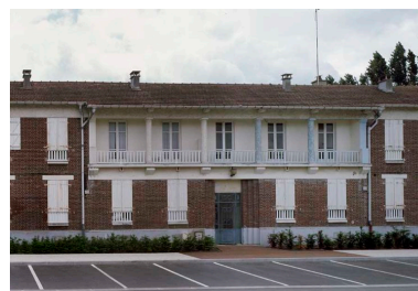
Bâtiment 520 : Entrée des logements et détail de la colonnade. IVR22_20106000429XA