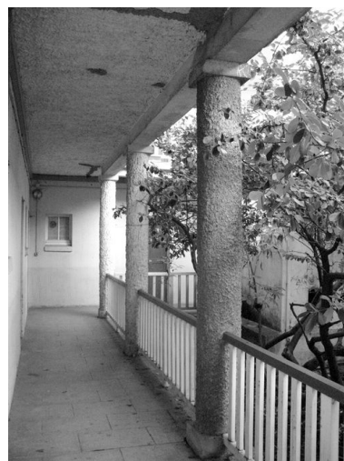
Bâtiment 520 : Détail de la coursive du rez-de-chaussée.