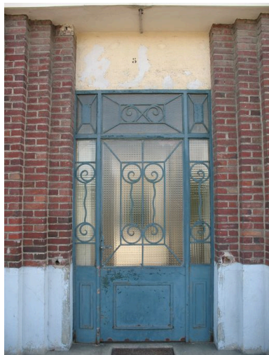
Bâtiment 520 : Porte d'entrée. IVR22_20096005163NUCA