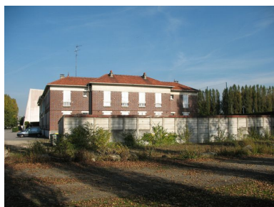
Bâtiment 520 : Logements pour célibataires construits rue Victor-Grignard, début des années 1930.