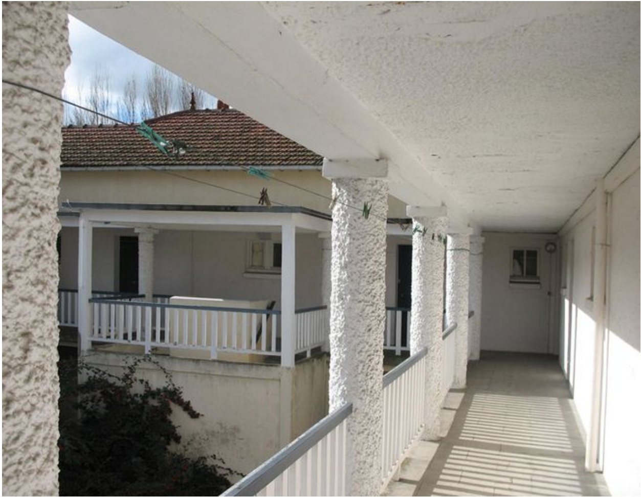
Bâtiment 520 : Premier étage de la coursive.