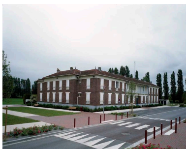
Bâtiment 520 : Vue générale. IVR22_20106000427VA