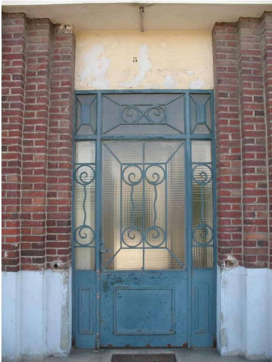
Bâtiment 520 : Porte d'entrée.