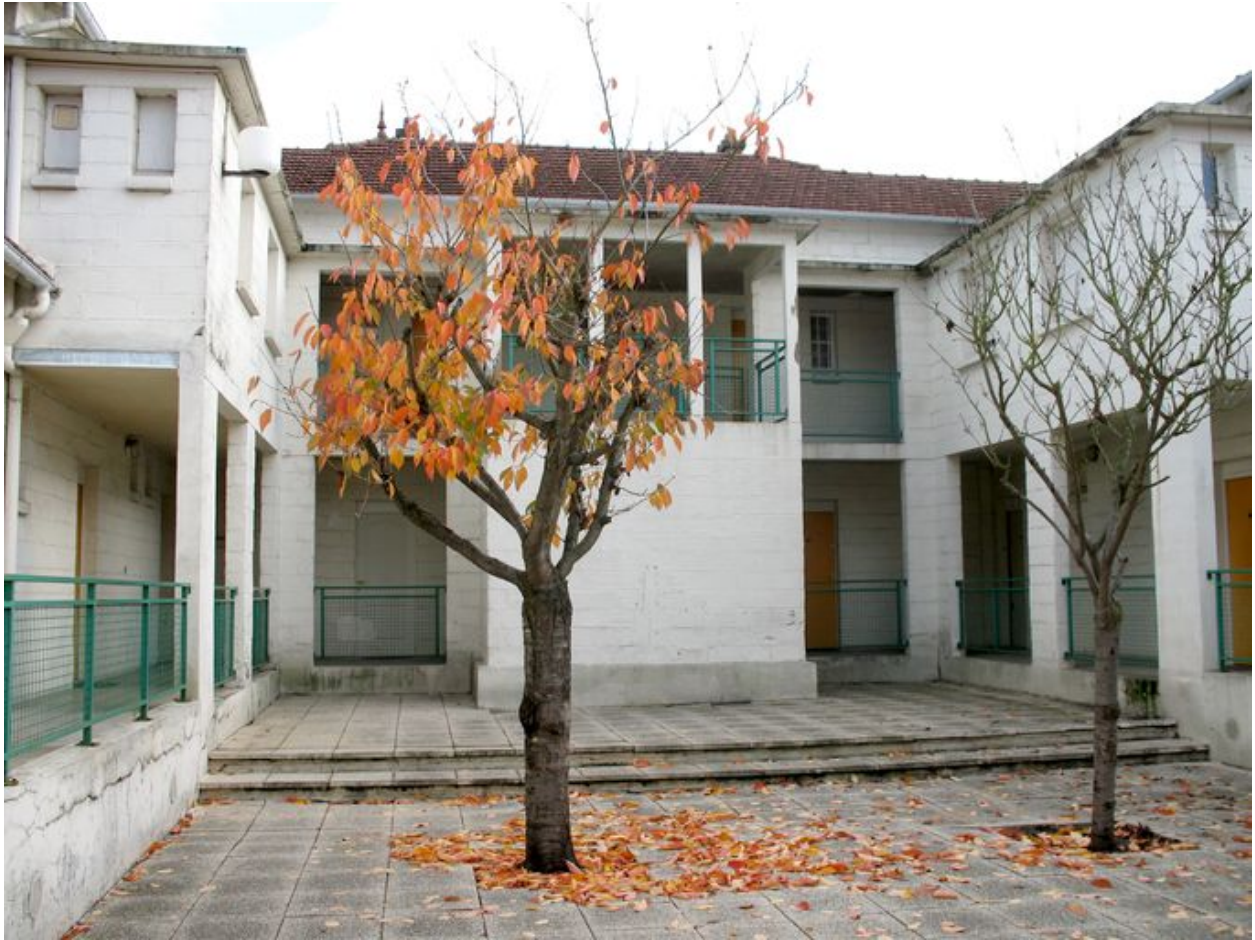
Bâtiment 523 : Cour intérieure.