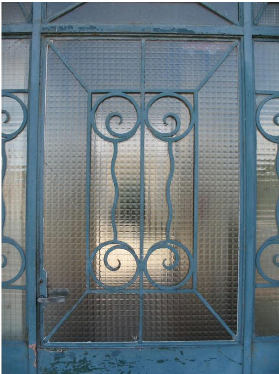
Bâtiment 520 : Détail de la porte d'entrée.