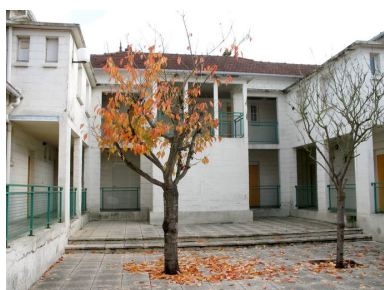
Bâtiment 523 : Cour intérieure. IVR22_20096005203NUCA