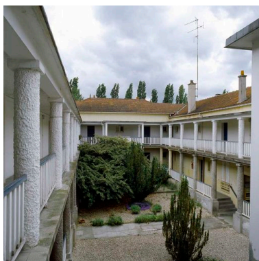
Bâtiment 520 : Vue générale de la cour intérieure. IVR22_20106000434XA