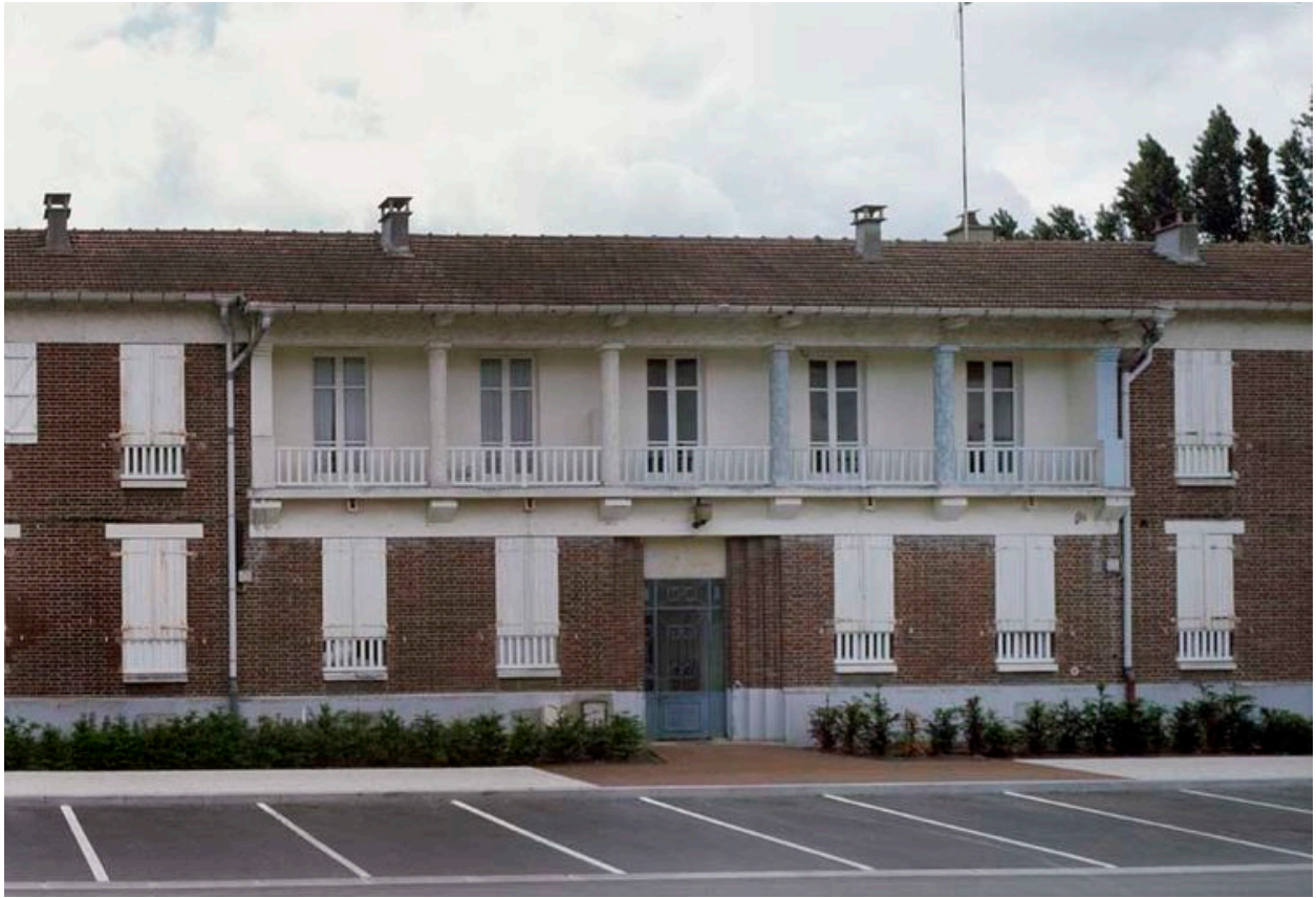
Bâtiment 520 : Entrée des logements et détail de la colonnade.