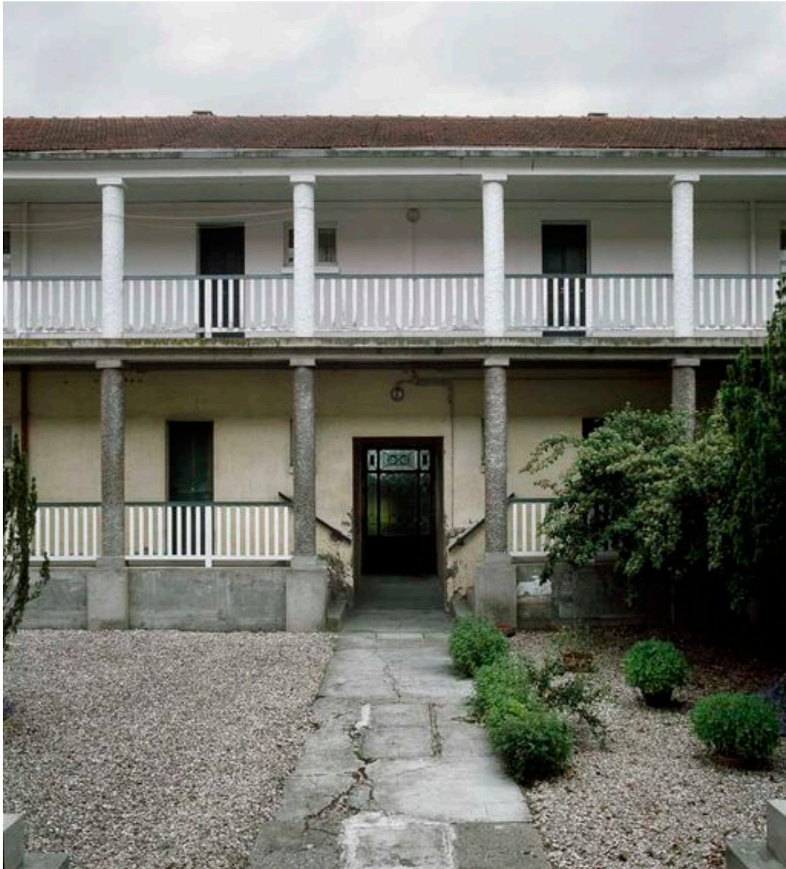
Bâtiment 520 : Elévation intérieure.