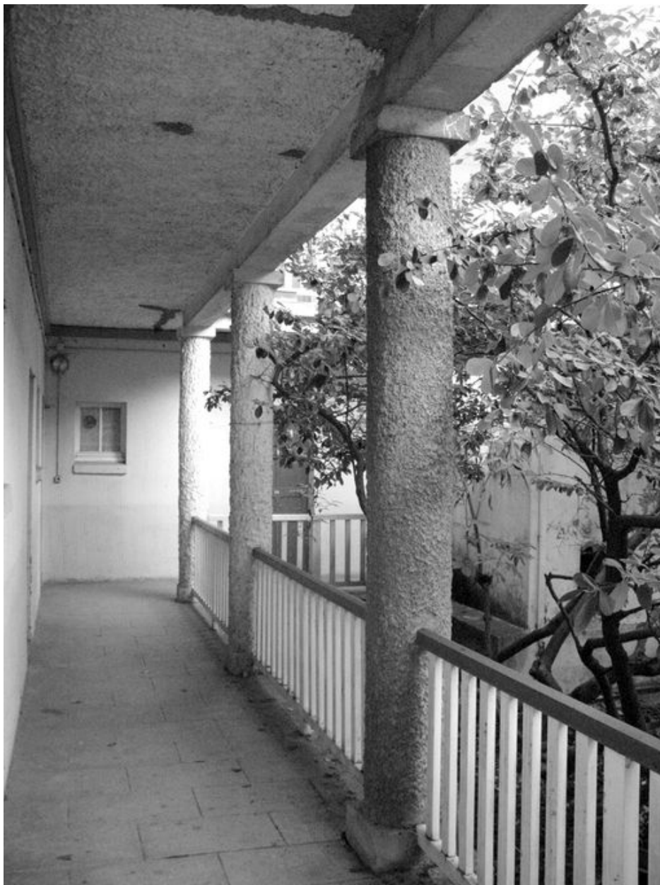
Bâtiment 520 : Détail de la coursive du rez-de-chaussée.