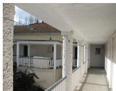
Bâtiment 520 : Premier étage de la coursive. IVR22_20096005110NUCA