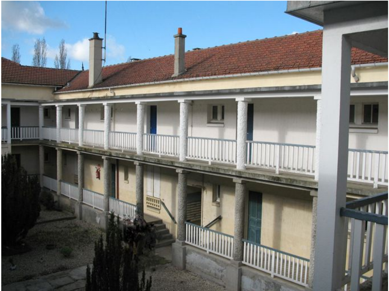
Bâtiment 520 : Détail de la coursive intérieure.