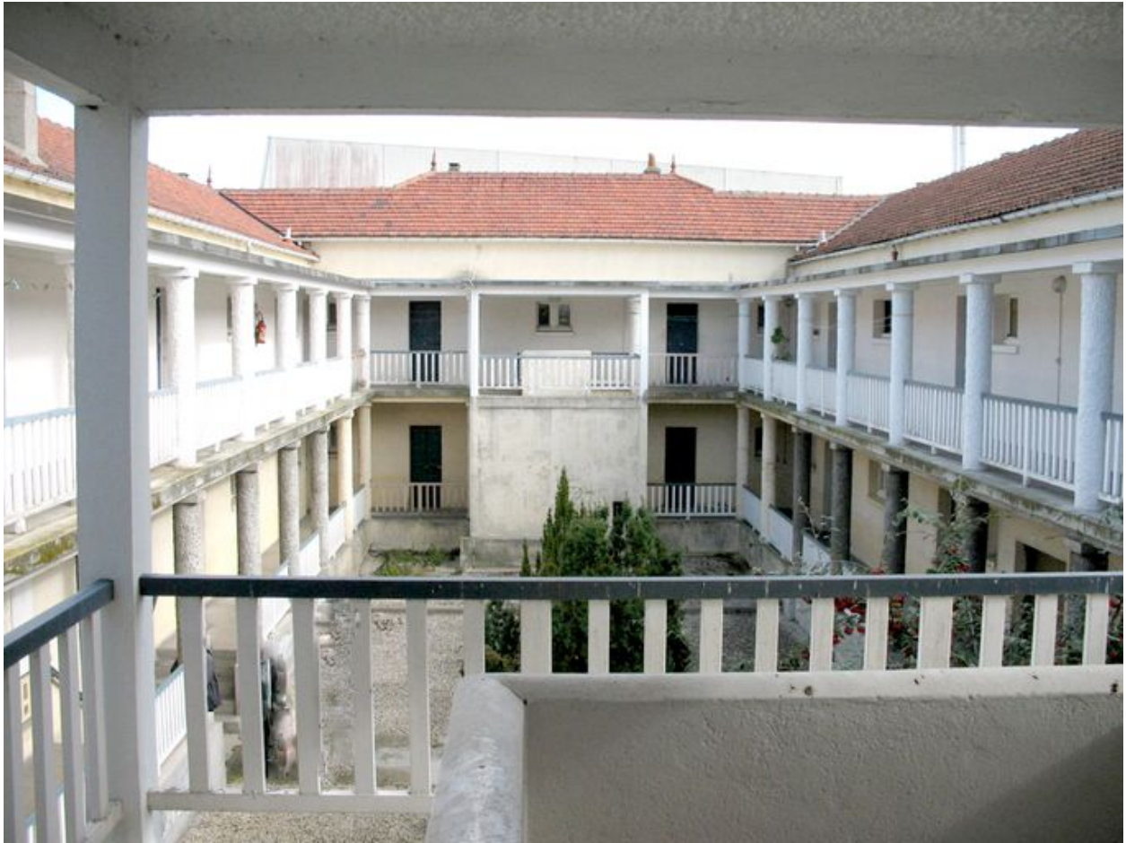
Bâtiment 520 : Cour intérieure du bâtiment pour ouvriers célibataires.