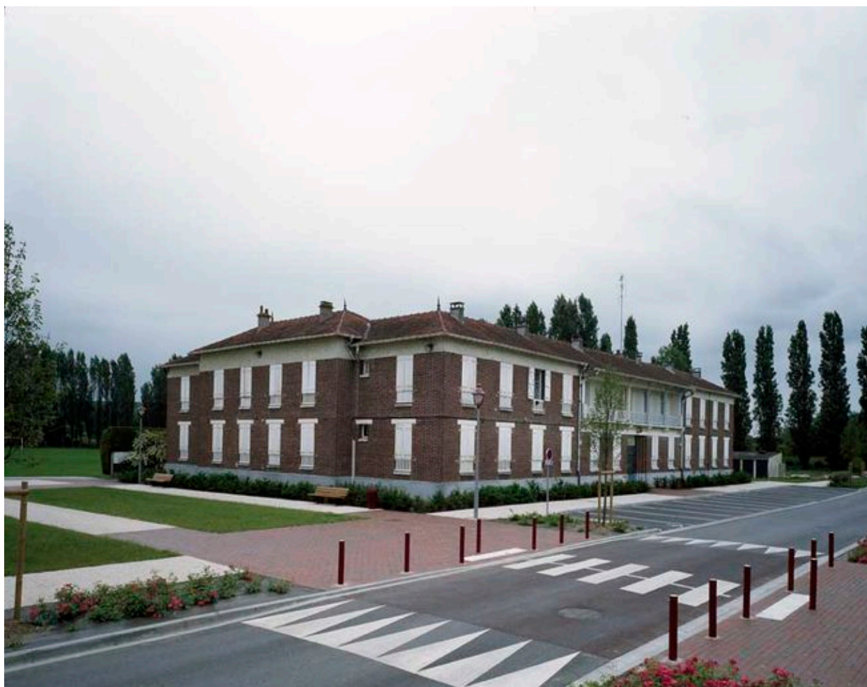
Bâtiment 520 : Vue générale.