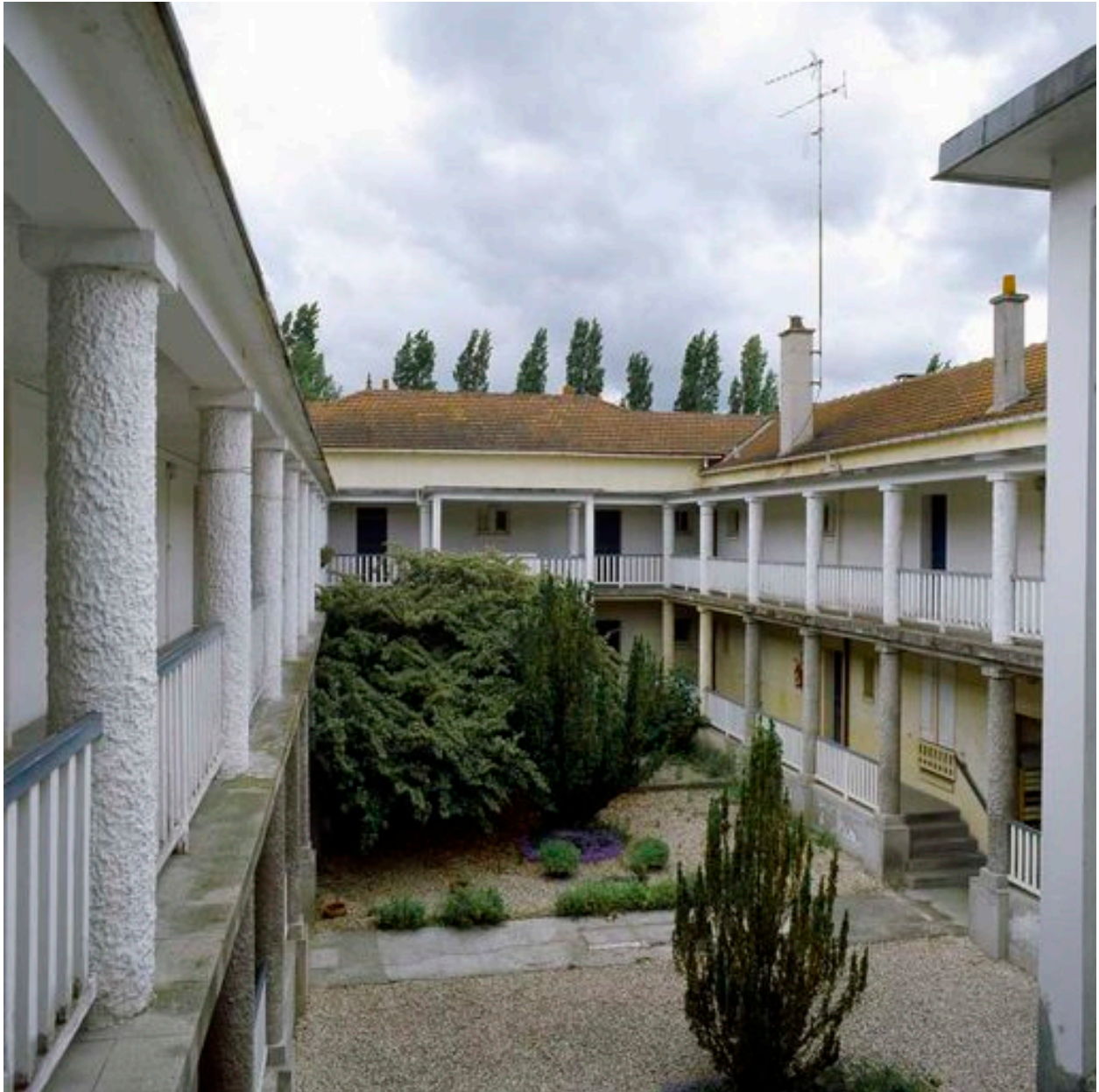
Bâtiment 520 : Vue générale de la cour intérieure.