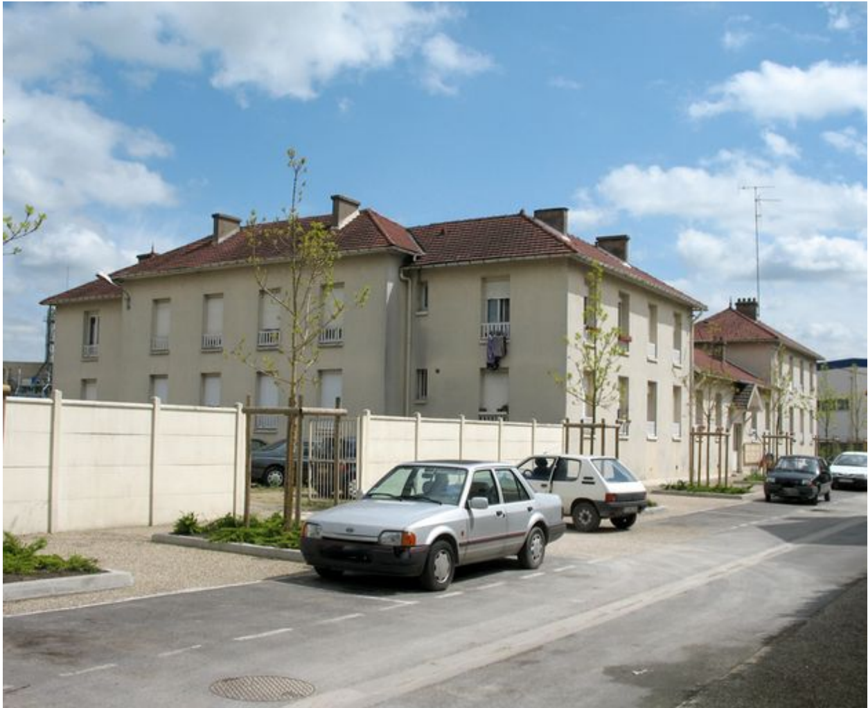
Bâtiment 523 : Logements pour ouvriers célibataires près de la cité de la Colorante.