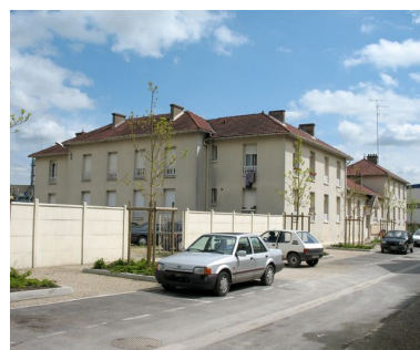
Bâtiment 523 : Logements pour ouvriers célibataires près de la cité de la Colorante. IVR22_20096005112NUCA