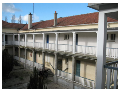
Bâtiment 520 : Détail de la coursive intérieure. IVR22_20096005108NUCA