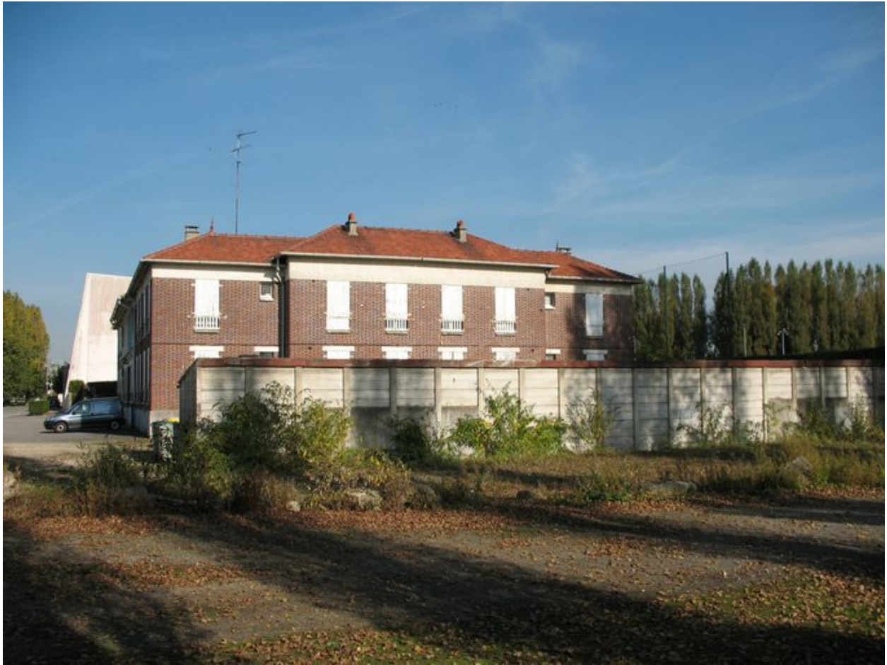
Bâtiment 520 : Logements pour célibataires construits rue Victor-Grignard, début des années 1930.