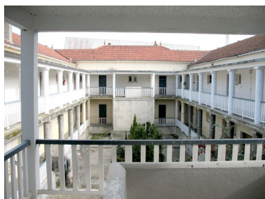
Bâtiment 520 : Cour intérieure du bâtiment pour ouvriers célibataires. IVR22_20096005106NUCA