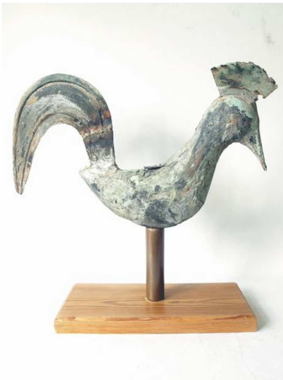
Vue générale, côté droit