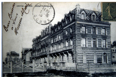
Carte postale, 1er quart 20e siècle (coll. part.).

Phot. Monnehay-Vulliet Marie-Laure IVR22_20058000580XAB