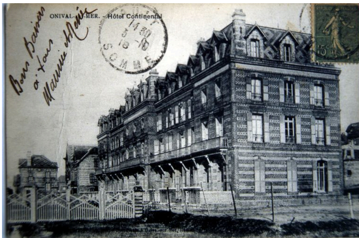
Carte postale, 1er quart 20e siècle.