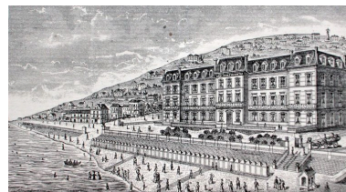
Vue d'ensemble de l'hôtel, en tête de courrier, détail, 1894 (AD Somme ; 4 M 98017/2).

IVR22_20058000583XAB