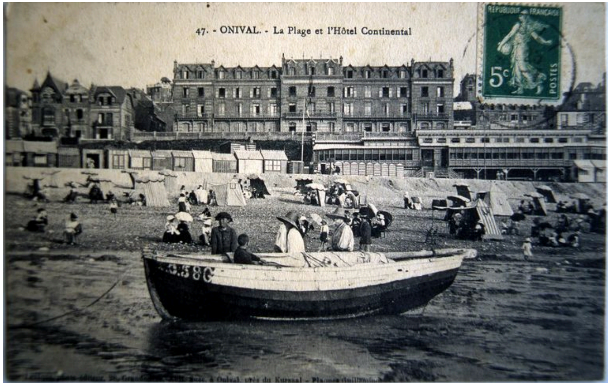
Vue de l'hôtel depuis la plage, carte postale, 1er quart 20e siècle (coll. part.).