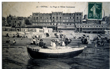
Vue de l'hôtel depuis la plage, carte postale, 1er quart 20e siècle (coll. part.).

Phot. Monnehay-Vulliet Marie-Laure IVR22_20058000580XAB