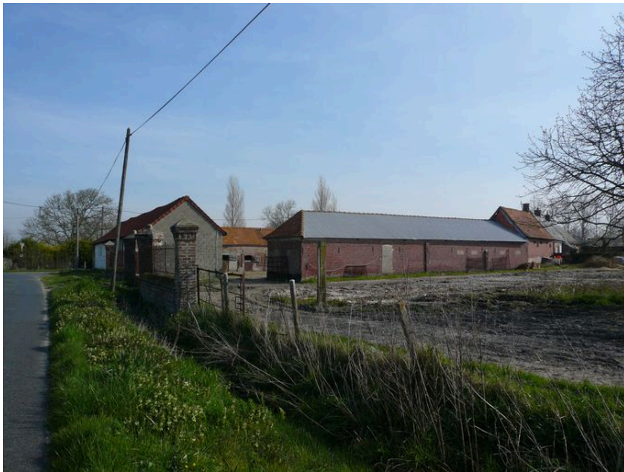
Vue générale de l'ensemble agricole depuis la sud-ouest.