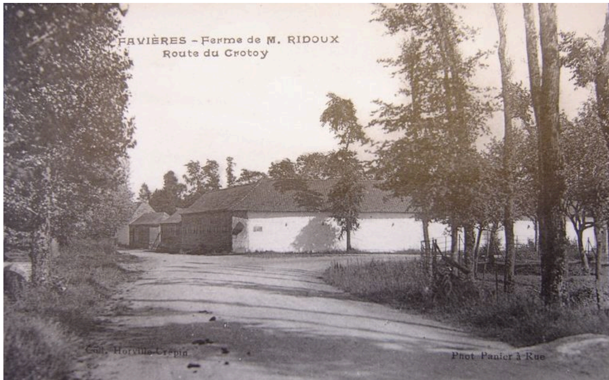
Vue de la ferme au début du 20e siècle.