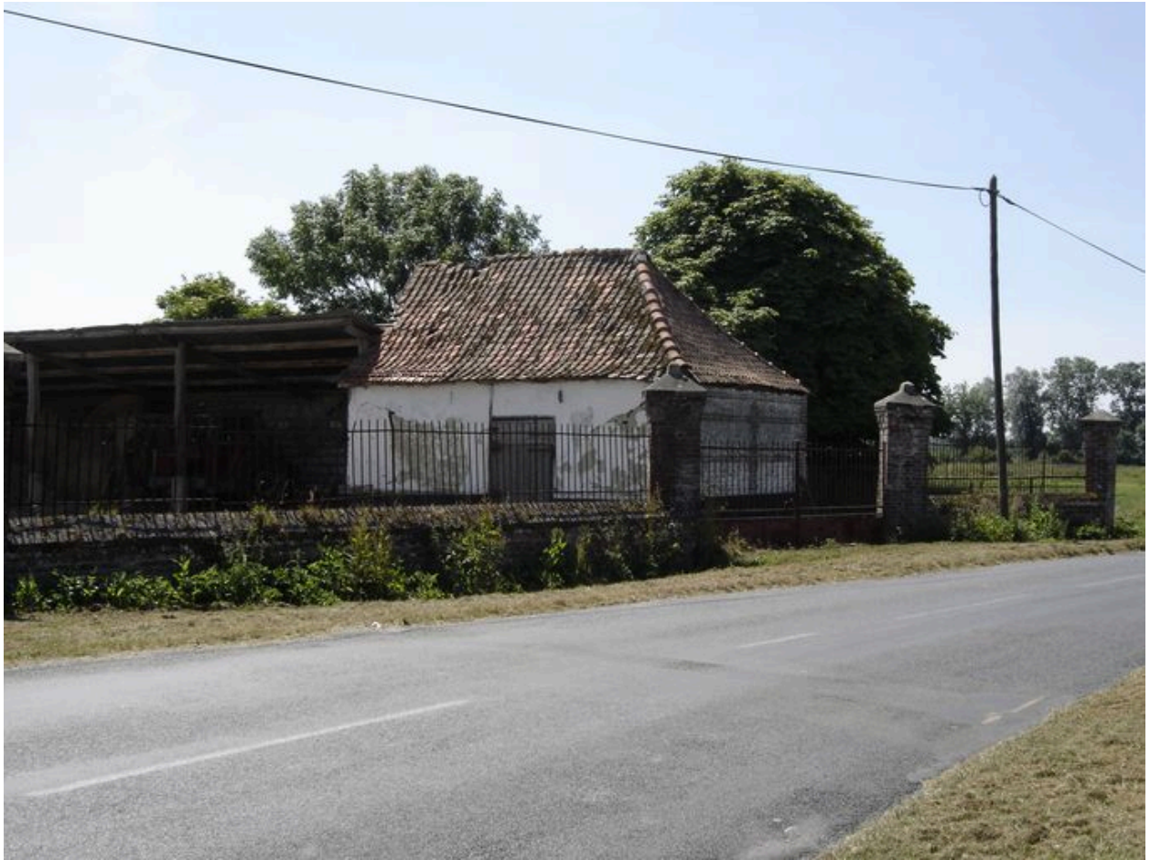
Vue sur l'entrée à l'ouest.