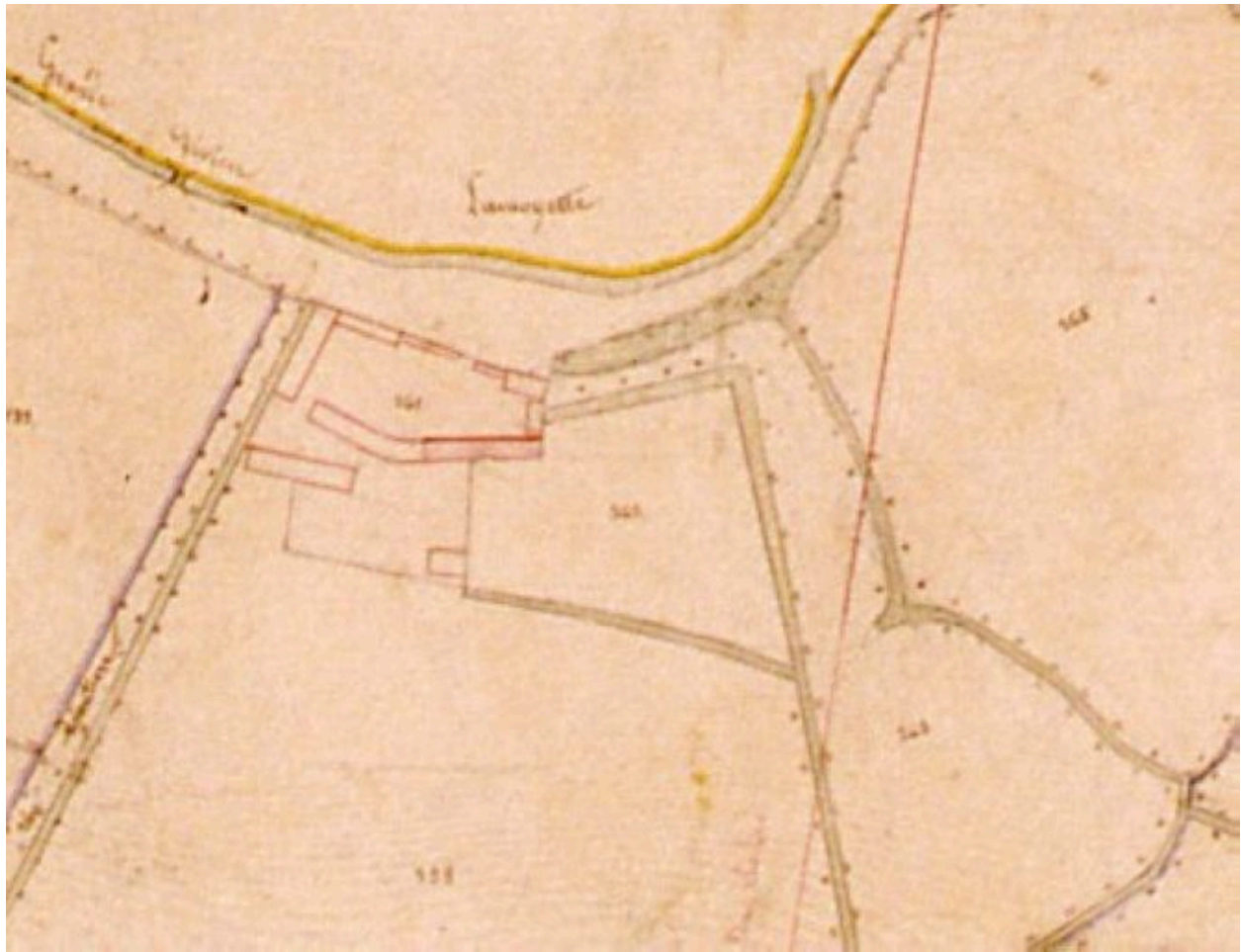
Extrait du cadastre napoléonien présentant le plan de la ferme en 1828.