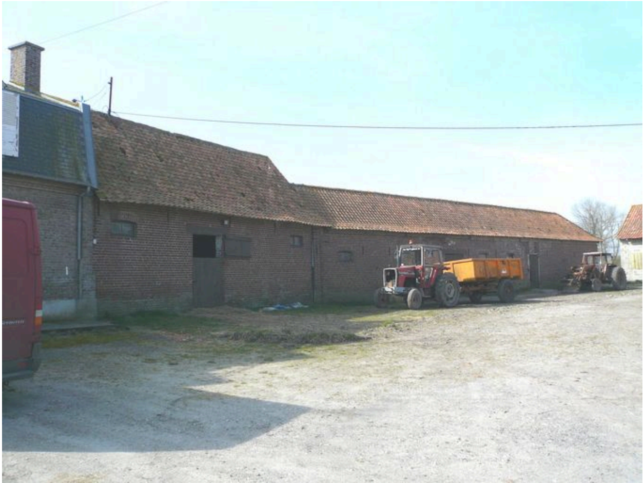
Vue des écuries dans le prolongement du logis.