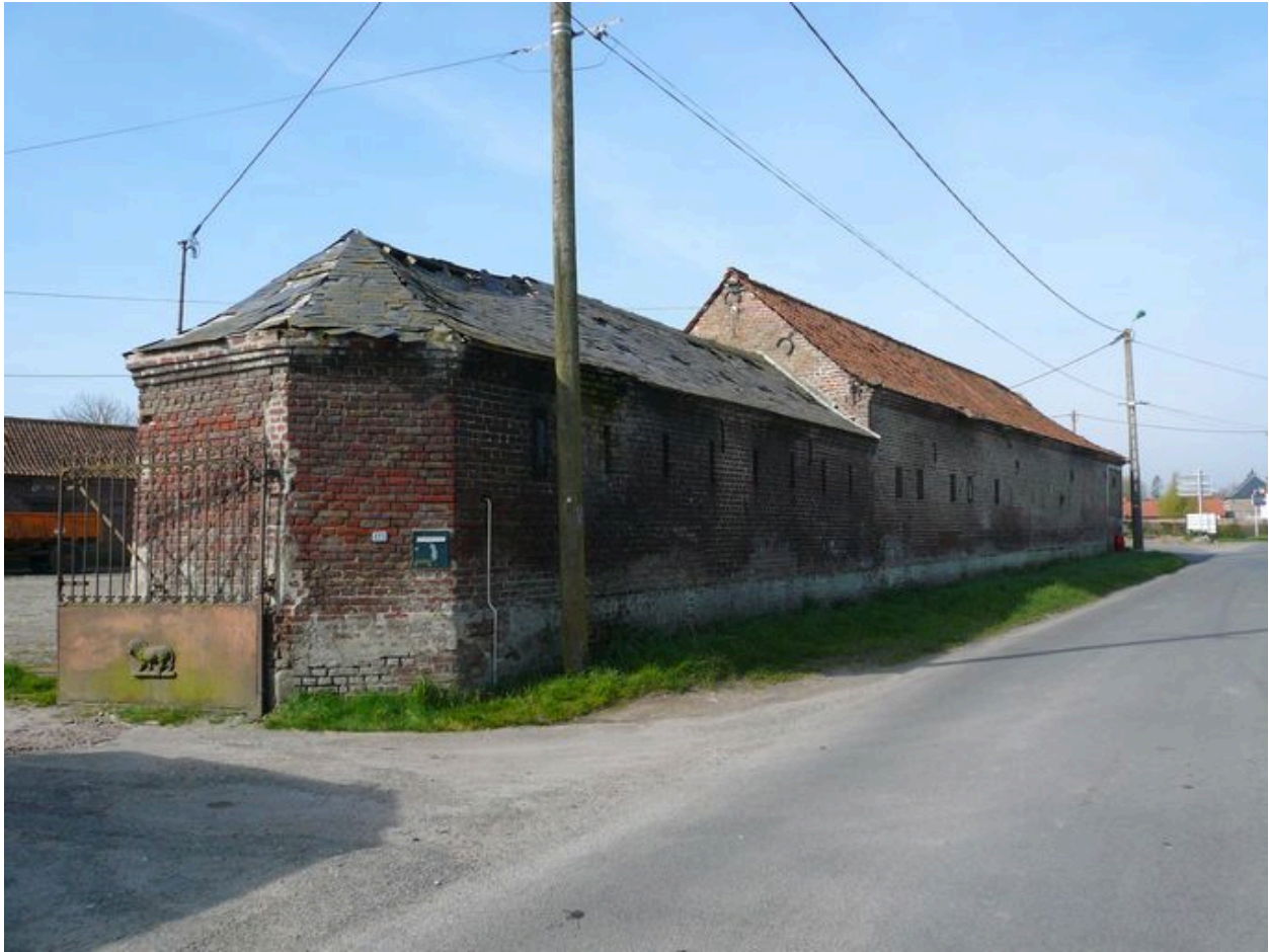
Vue sur les étables depuis la rue datées par les ancrs de 1900 et sur l'entrée principale.