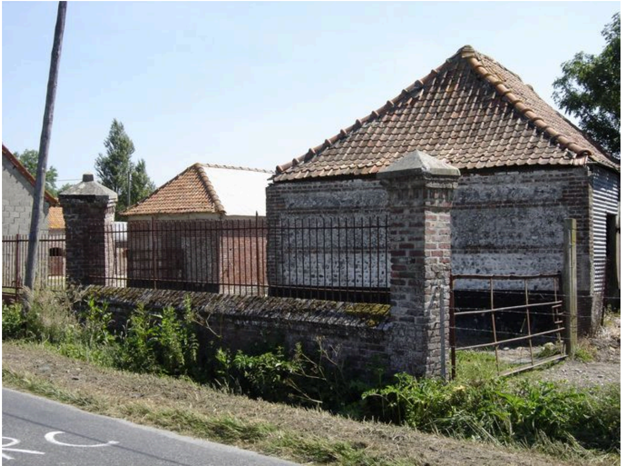
Vue sur l'angle sud-ouest de l'ensemble avant la destruction des bâtiments.