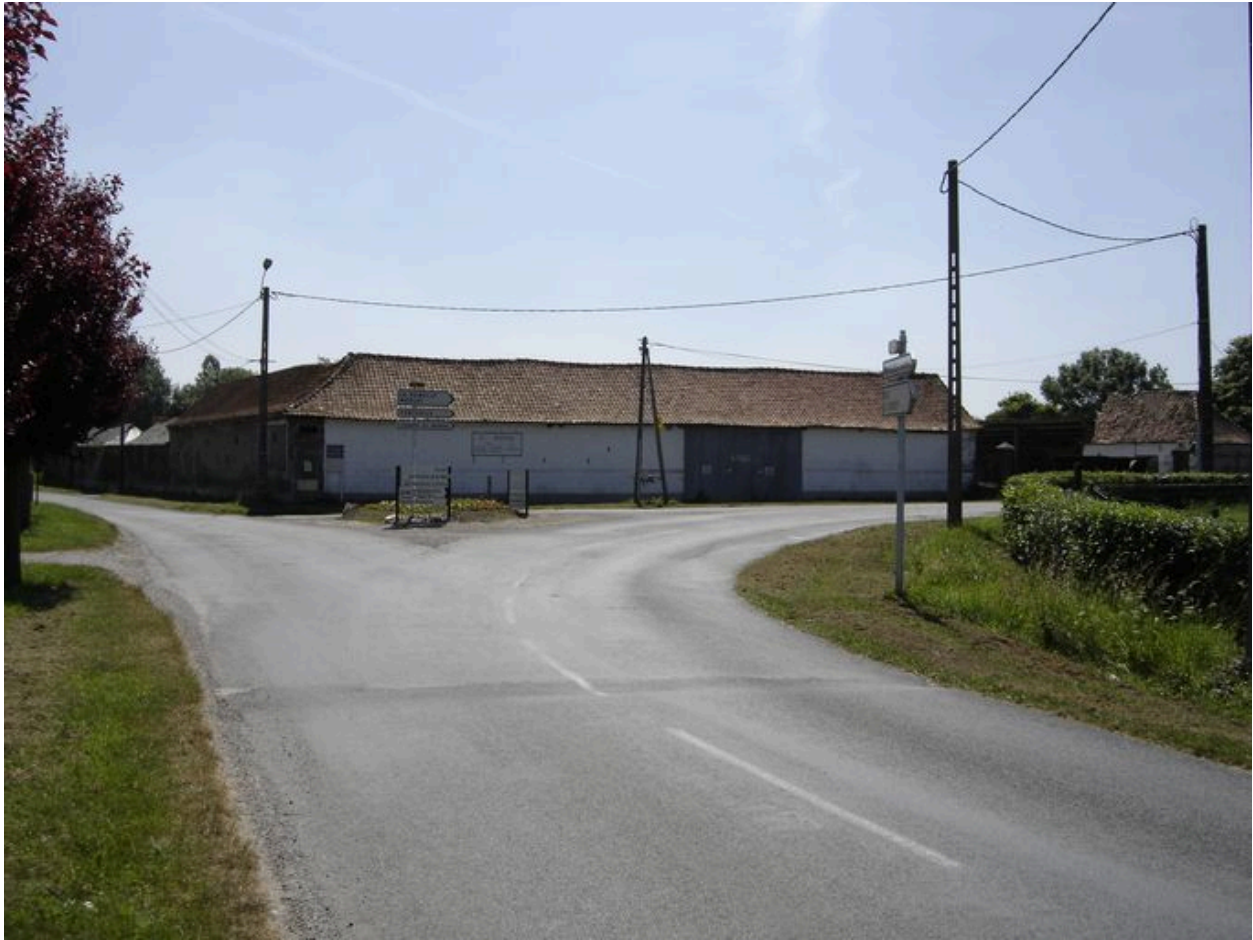
Vue de la grange depuis la rue des Forges.