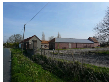
Vue générale de l'ensemble agricole depuis la sud-ouest.

IVR22_20078005791NUCAB