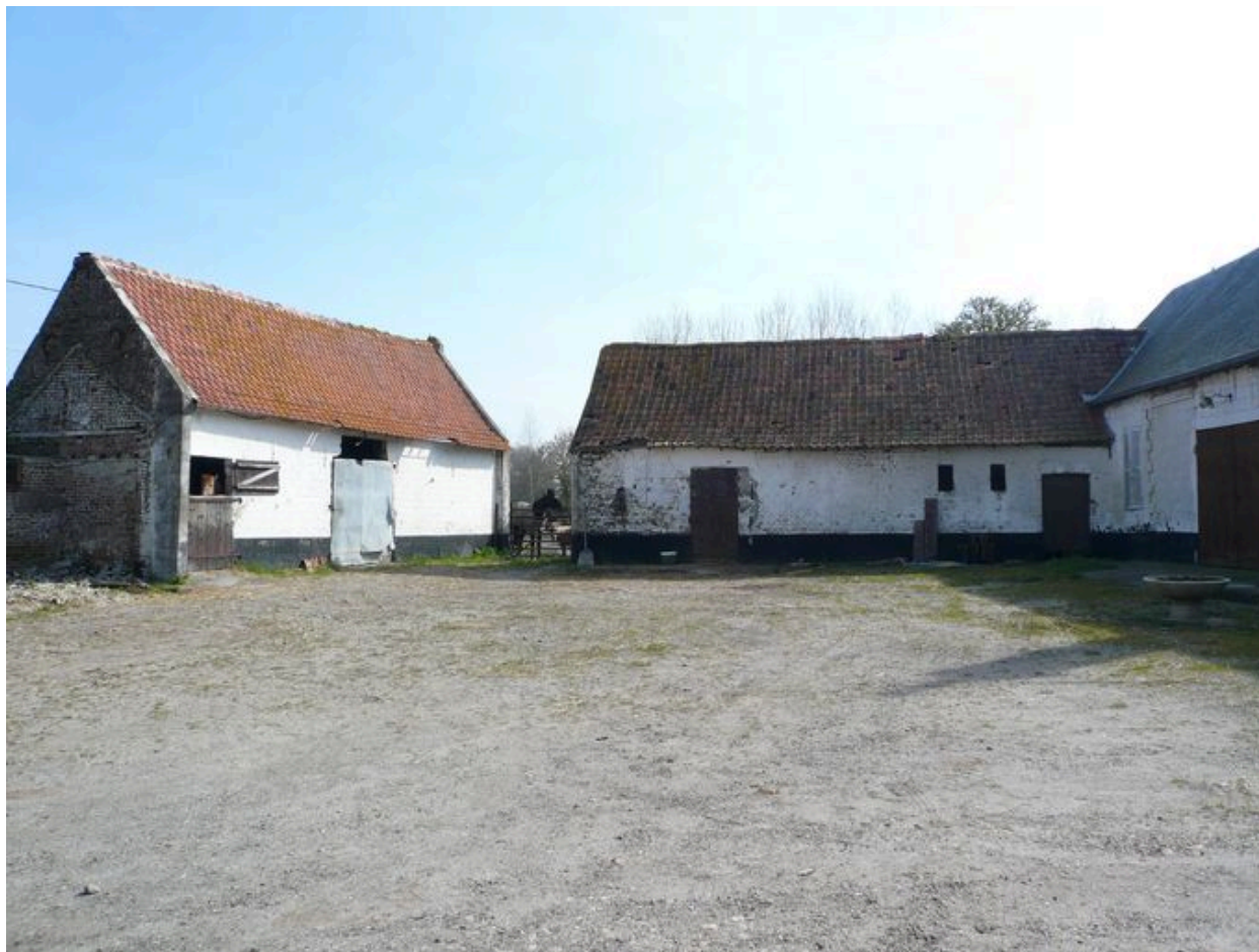
Vue des écuries sur rue et des étables à l'est de la cour.