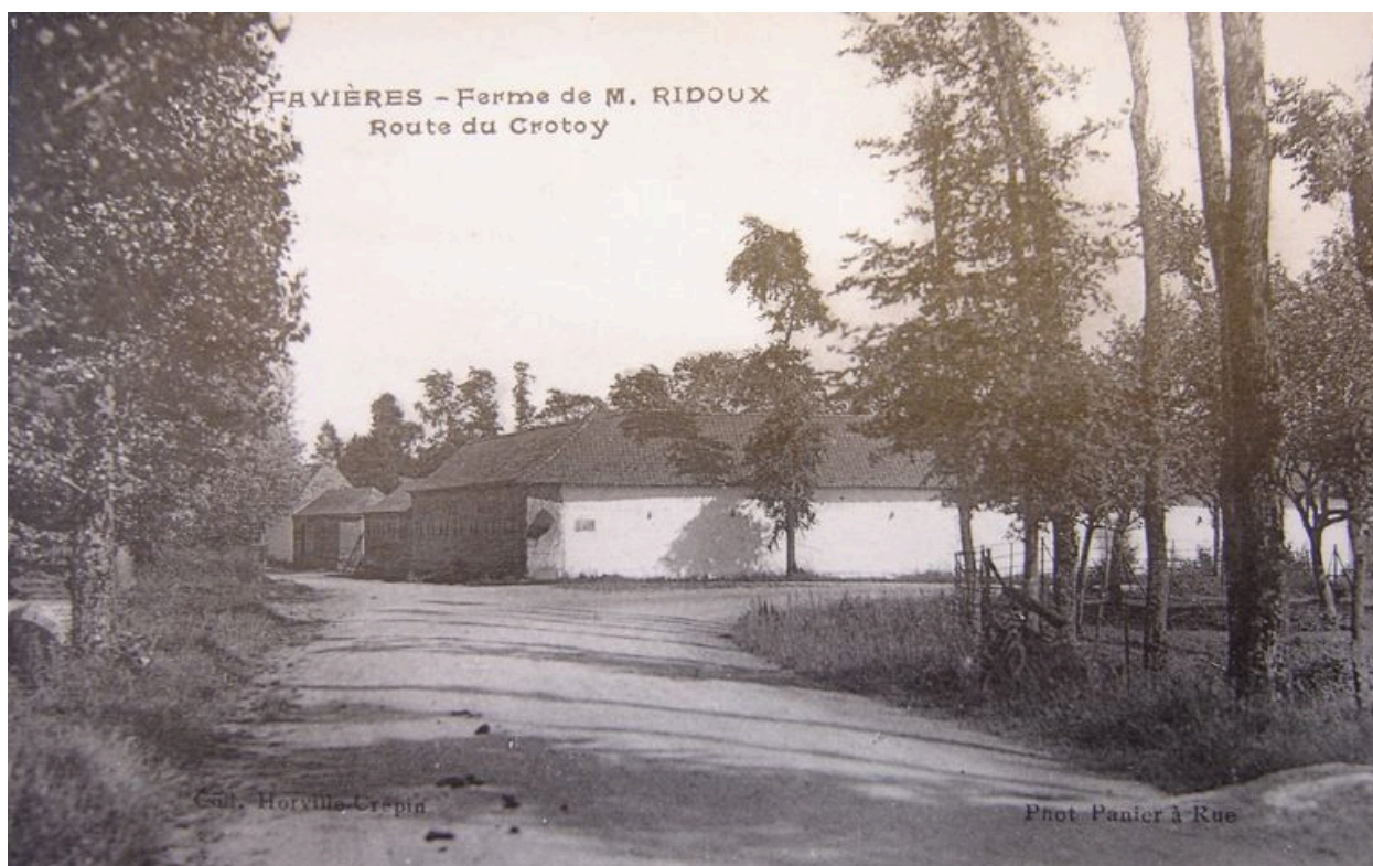
Vue de la ferme au début du 20e siècle.