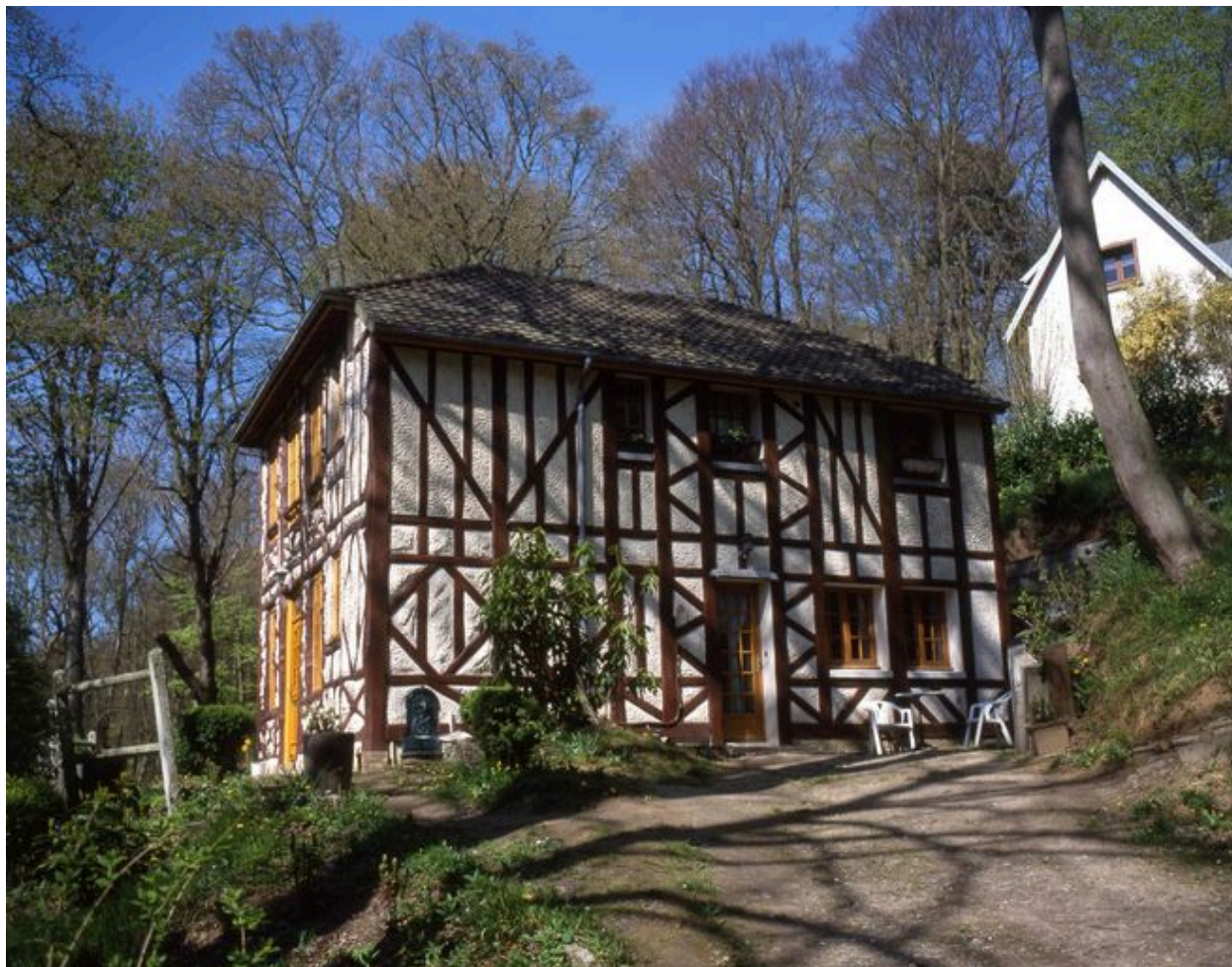
Elévation latérale droite (extension).