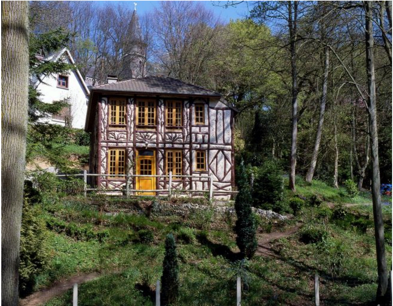
Vue d'ensemble après changement des huisseries.