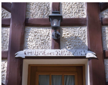
Détail de l'appellation. IVR22_20048000028XA