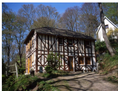
Elévation latérale droite (extension). IVR22_20048000027XA