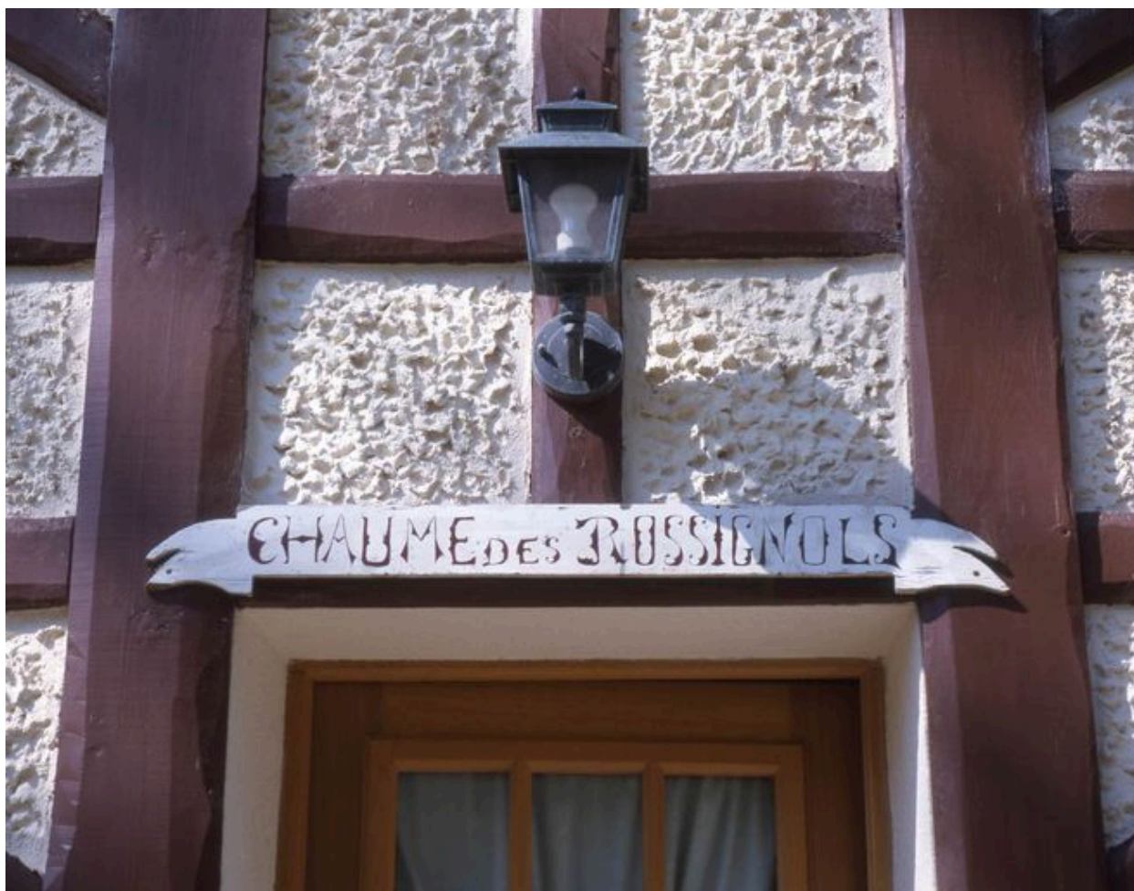
Détail de l'appellation.