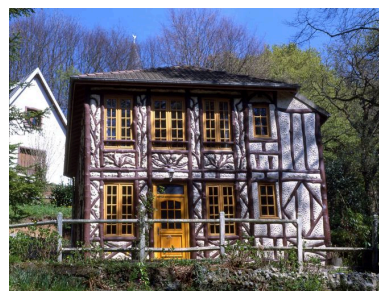
Elévation antérieure. IVR22_20048000026XA