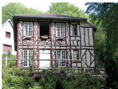
Vue d'ensemble avant changement des huisseries. IVR22_20048001355NUCA