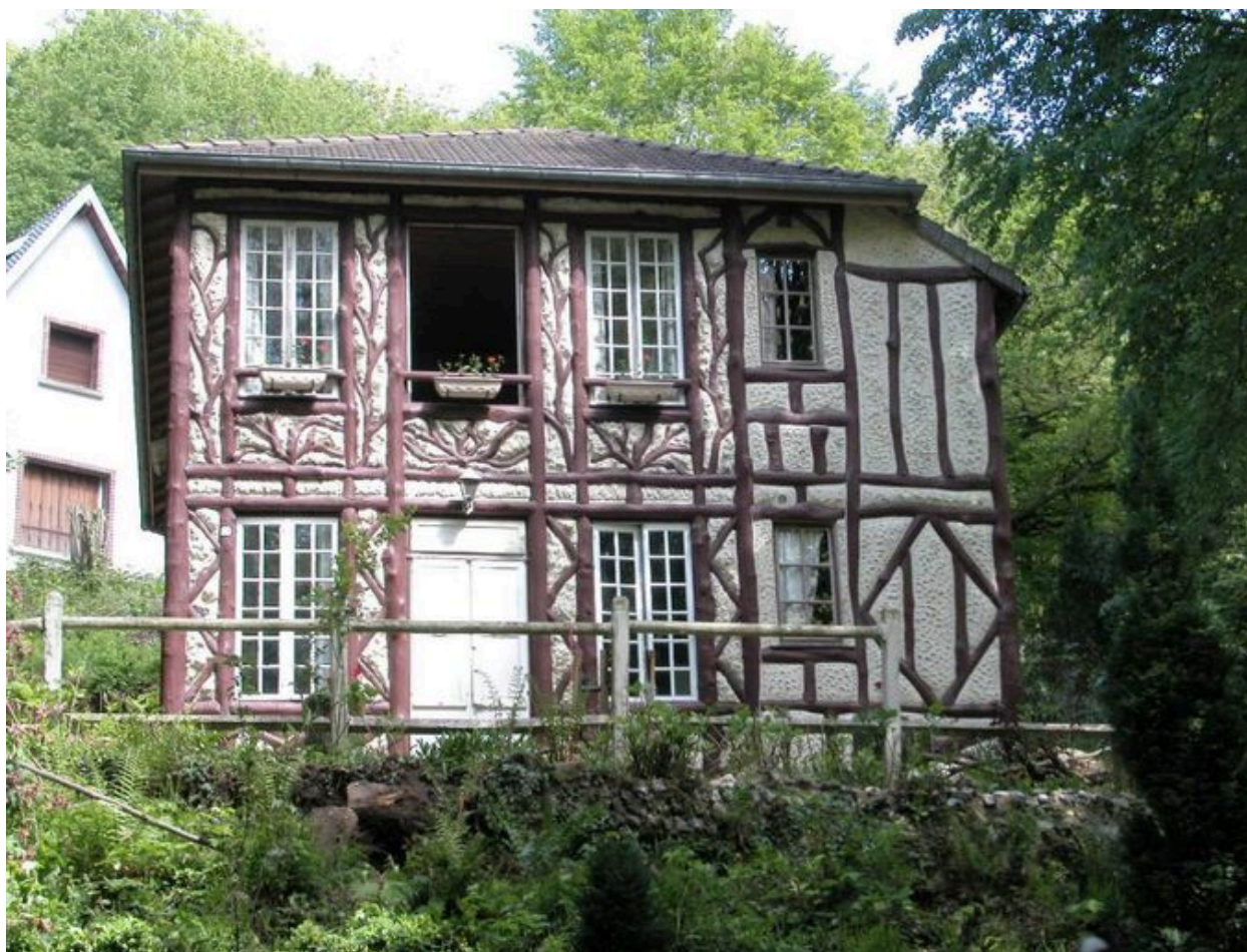
Vue d'ensemble avant changement des huisseries.