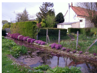
Vue du rû au pied des habitations dans l'Impasse Colasse.