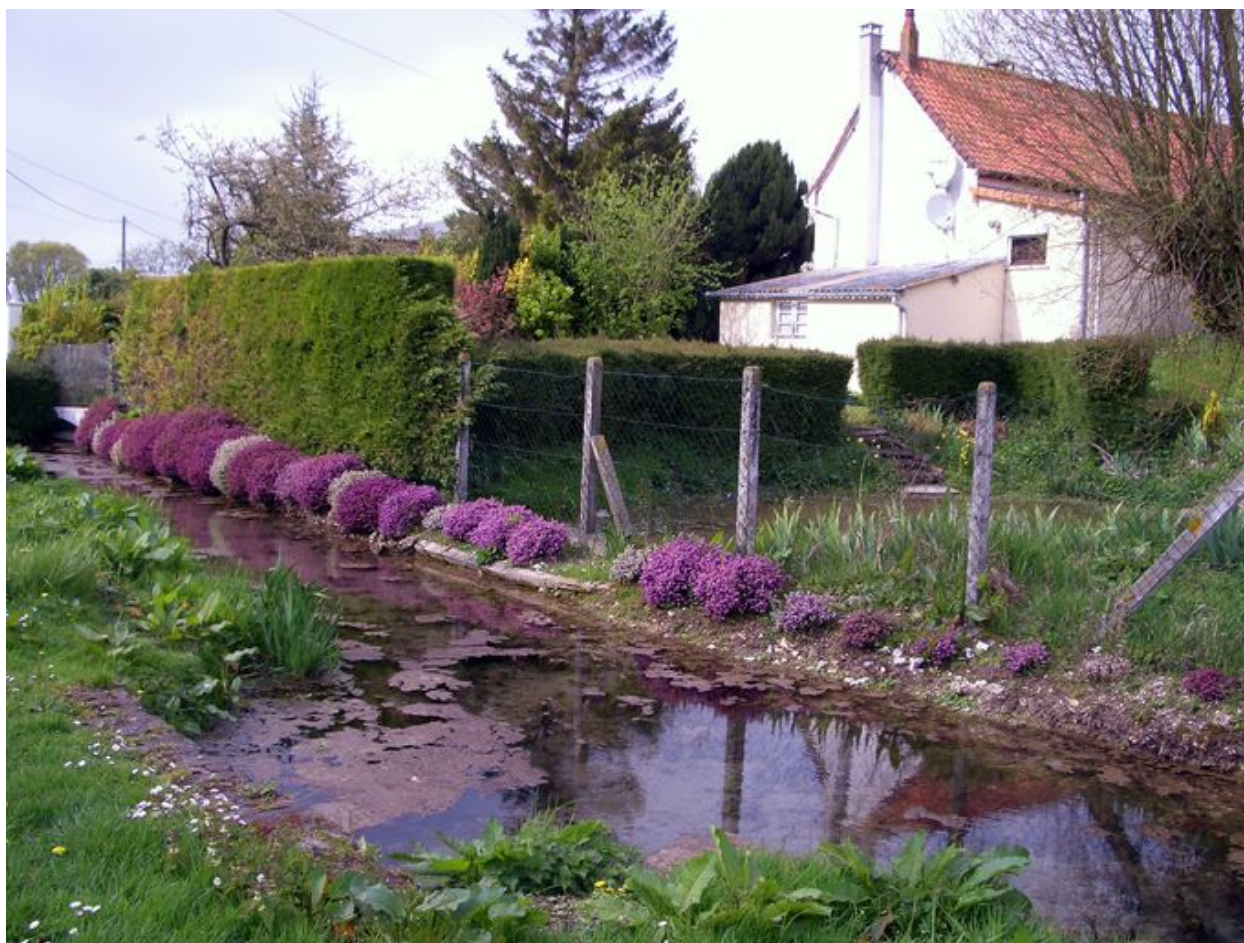
Vue du rû au pied des habitations dans l'Impasse Colasse.