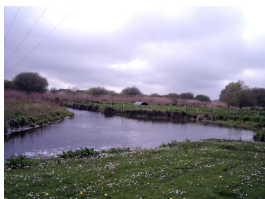
Vue des marais au bout de l'Impasse Colasse. IVR22_20058005647NUCA