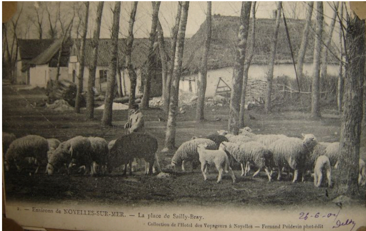
Vue de la place de Saily-Bray au début du 20e siècle.