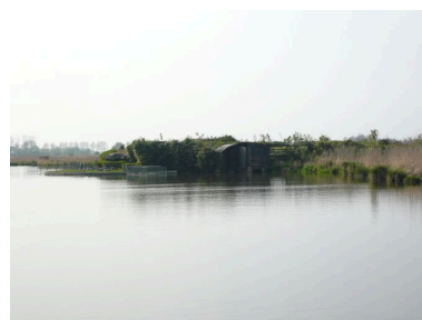
Vue de la Hutte des 400 coups.