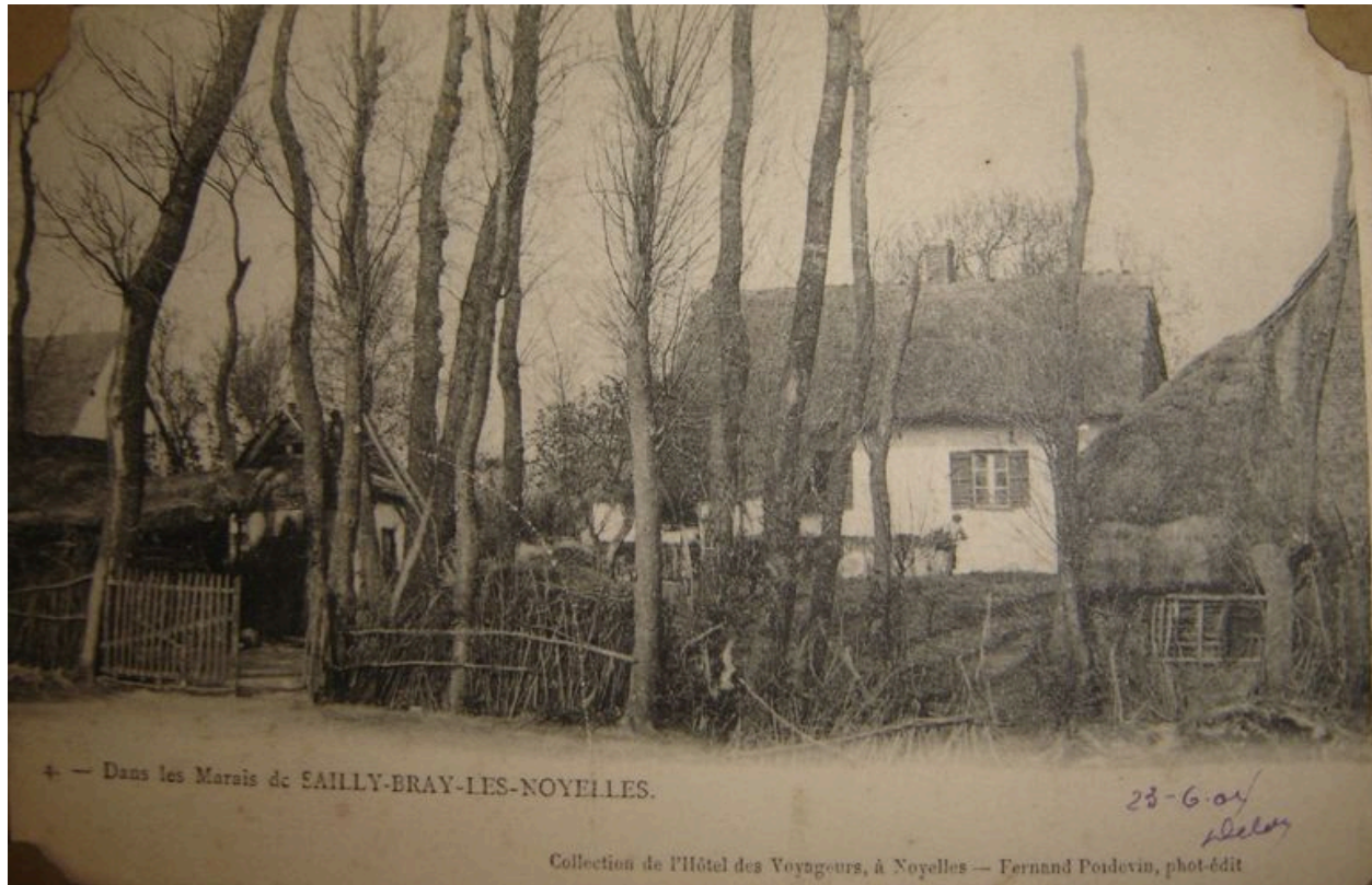
Vue de maisons situées dans les marais de Sailly-Bray au début du 20e siècle.