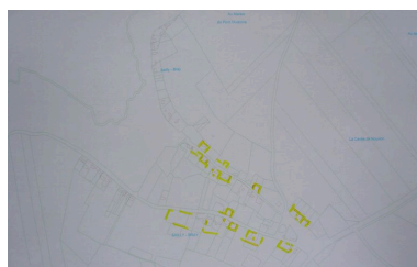
Superposition des cadastres napoléonien et actuel présentant l'évolution du bâti au cours du 19e siècle à Sailly-Bray. IVR22_20078006076NUDA