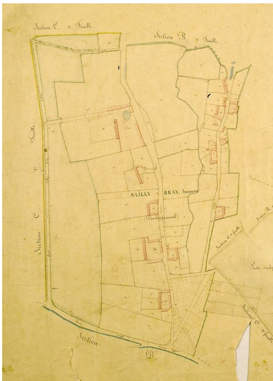
Cadastre napoléonien de la section de Saily-Bray.