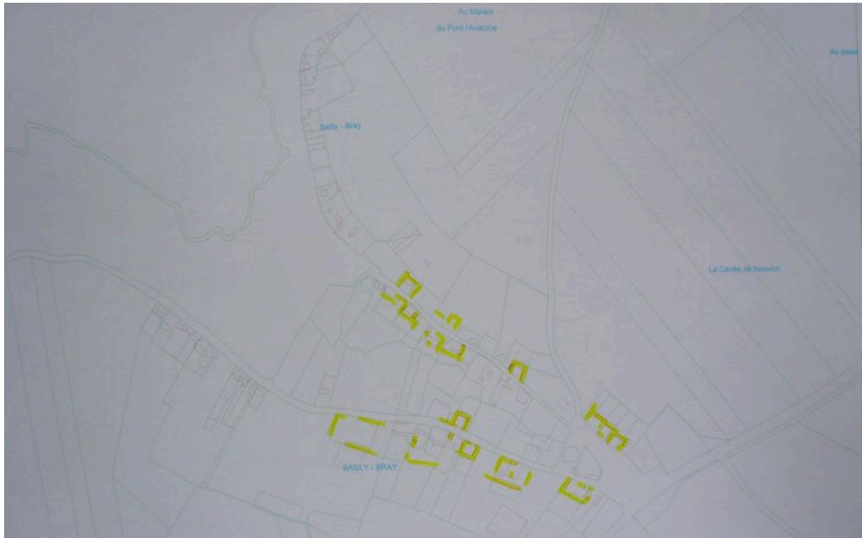
Superposition des cadastres napoléonien et actuel présentant l'évolution du bâti au cours du 19e siècle à Sailly-Bray.