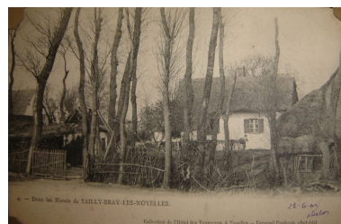
Vue de maisons situées dans les marais de Sailly-Bray au début du 20e siècle.