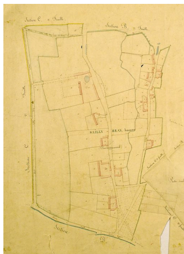
Cadastré napoléonien de la section de Sailly-Bray. IVR22_20068005704XAB