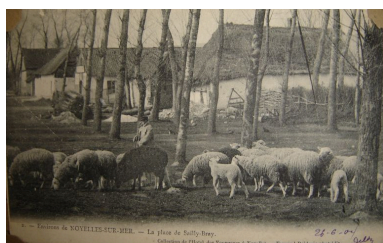
Vue de la place de Sailly-Bray au début du 20e siècle.