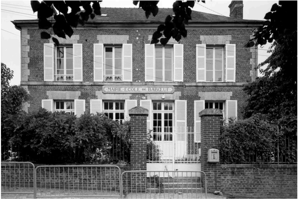
Marie-école. Élévation antérieure.