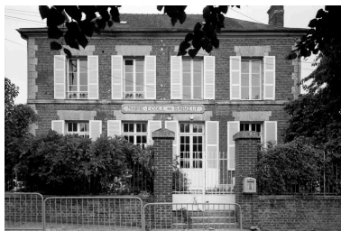
Marie-école. Elévation antérieure. IVR22_19846001012X

IVR22_20096000019NUCA