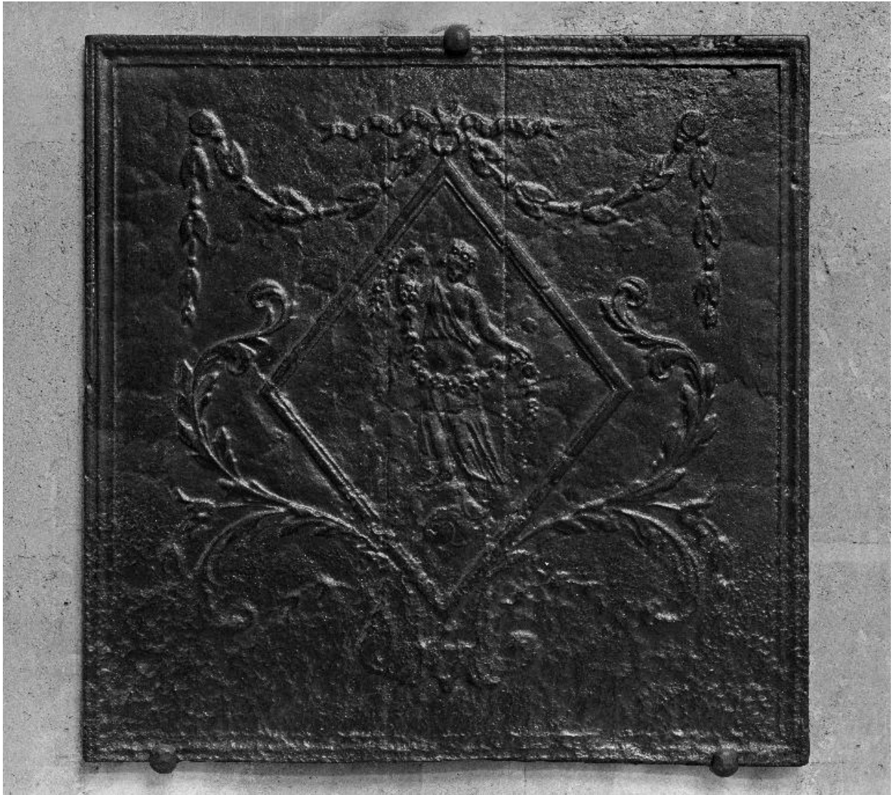
Vue générale de la seconde plaque.