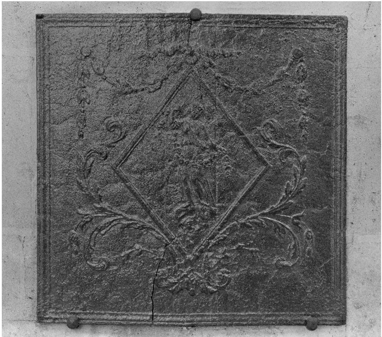
Vue générale de la première plaque.